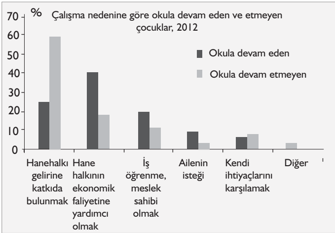
Grafik-3: Çalışma nedenine göre okula devam eden ve etmeyen çocuklar (2012).