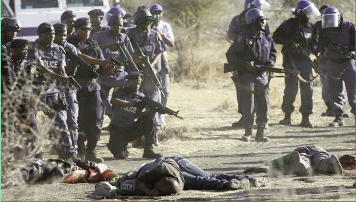
21. Yüzyıl: Ücret Kavgasına Giren ve Elllerinde Tahtadan Başka Bir Şey Olmayan Madencilere Ateş Açıldı... Onlarca Madenci Tumba Oldu; Polisin Gerekçesi: “Nefsi Müdafaa”(!)

Ülkemizdeki maden işverenleri –otokontrol beri dursun– devletin çapsız carî uygulama ve yaptırımlarını, katlanılması gereksiz bir maliyet unsuru gibi algılamakta; ayrıca, emniyet kadrolarının veya –yeni icat– İSİG uzmanlarının aldıkları ücretleri de, bir tür yasal haraç gibi görmektedir. Velakin aynı işveren taifesi; gün gelip de savcı-yargıç karşısına dikildiğinde: “... Teknik konulara bizim aklımız ermez; o işe bakan yetkili ve sorumlu uzmanlarımız var...” gibi klişe ifadelerle, güya haraç verdikleri öz insanlarımızı, birer günah keçisi gibi kullanacak kadar seviyesizleşmektedir de!... Ayrıca, işverenlerin –İSİG işleyişi konusunda takındığı– marazî ve hayatî tehlike endükleyici tutum ve davranışları; sadece maden ocaklarına değil, her tür işyerine de, epidemik bir hızla bulaşmıştır. Soma’da olup bitenin temel nedeni de –bodoslama tanımla geçilen– aynı patolojik fenomenin sonucu olan vahşetten kaynaklanmaktadır.