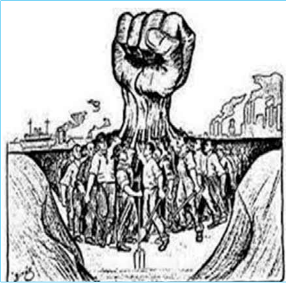
Sermayesiz Bir Dünya Mümkündür ve Daha İyidir Eylem Birliği + Direniş + İlgal + Kendi Ürettiğini Kendi Yönetme = Özyönetim

Çağdaş madencilik amentüsü olan "Sıfır Ölüm" hedefine ise; ne devletin, ne patron emniyetçilerinin, ne fennî nezaretçinin, ne de yasa