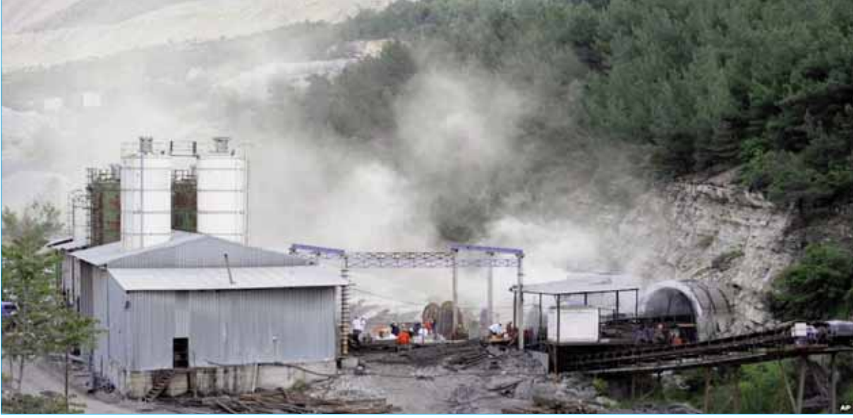
Aglebi ihtimalle, vukuat ikindisi –ortalık ana baba günü olmadan– kayda geçen yukarıdaki manzara; ancak ve ancak, çoklu grizu + toz infilaklarının ardından, arterlerdeki trafiğin dahi felç olduđu ve ocak idaresinin, her sistem ve şebeke üzerinde, her tür kontrolünü yitirdiđi, ender vakalarda müsamaha görülebilir!...