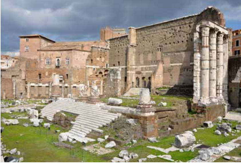
Şekil 9. Roma, Augustus Forumu.

farklıdır. 30 Başlığın iri kristalli gri mermeri Prokonnesos'dan ithal edilmiştir. Bu başlık olasılıkla Hadrianus döneminde Augustus Forumu'nda yapılan yenileme çalışması sırasında güney doğu ekseedraya eklenmiştir. Başlıkta görülen akanthus yapraklarının uçları Roma biçeminden uzak olup daha çok Doğu'ya özgü biçimde sivri ve derin olarak işlenmiştir. Geniş alt sıra akanthus yaprakları ile bunların arasından yükselen üst sıra yaprakları başlık yüzeyini kaplamıştır. Akanthus yapraklarının ana damarlarından yaprak uçlarına dek uzanan damarlar derin işlenmiş olup, zeminden dışa doğru taşmasıyla oluşan plastik etki ve sivri uçlu yaprak dilimlerinin birbirlerine bağlanmaları sonucu ışık-gölge etkisi belirginleşmiştir. Bu başlıkta görülen yaprak biçimini Pergamon Traianus Tapınağı başlıklarında görmek mümkündür. Pergamon Traianus Tapınağı'nın Hadrianus döneminde inşa edildiği göz önünde bulundurulursa 31 Augustus Forumu'nda gördüğümüz örnek de biçem olarak Hadrianus dönemine tarihlenmelidir. 32 Başlığın akanthus yapraklarının kalathos yüzeyinde geniş ve yüksek işlenmesi, sivriltilmiş yaprak dişleri ile bu dişlerin yaprak dilimlerini birbirine bağlarken oluşturdukları ışık-gölge oyunları, derin oyulmuş kanallar ve bu kanalların güçlü damarların ucuna kadar uzanmaları, plastik özelliklerinin artırılmış olması gibi özellikleri nedeniyle yaprakların Anadolu biçeminde, genel olarak da Pergamon-Ephesos Bezeme biçeminde işlendiklerini söylemek mümkündür.