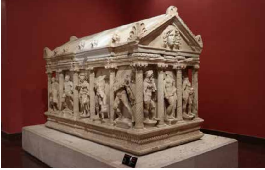
Şekil 5. Perge kazılarında bulunmuş olan Sütunlu Tip (Sidemara) Herakles lahti. MS II. yüzyıl.

ulaşmak zorunda kalan Dokimeion işliklerinden çıkan lahitler yoğun bir işçilik girdisiyle Prokonnesos ürünlerine kıyasla çok daha pahalı olan girland ve sütunlu tip (Sidemara) (Şek. 5) üretimiyle zengin bir alıcı kitlesine hitap etmeyi başarabilmiştir. 18 Bu yönü ile bakıldığında Dokimeion lahitleri olasılıkla kuzeyde Nikomedia (İzmit), batıda Smyrna (İzmir) ya da Ephesos (İzmir/Selçuk) ve güneyde ise Attaleia (Antalya) ya da Perge (Antalya/Aksu) kentlerinin limanlarından ihraç edilmiş olmalıdır. Dağılımlarına bakılacak olduğunda ise; Suriye, Filistin ve Arabistan'da, Rodos, Girit, Atina, Dalmaçya, İtalya ve hatta Roma'da Dokimeion lahitlerinin örneklerine rastlanmaktadır. 19