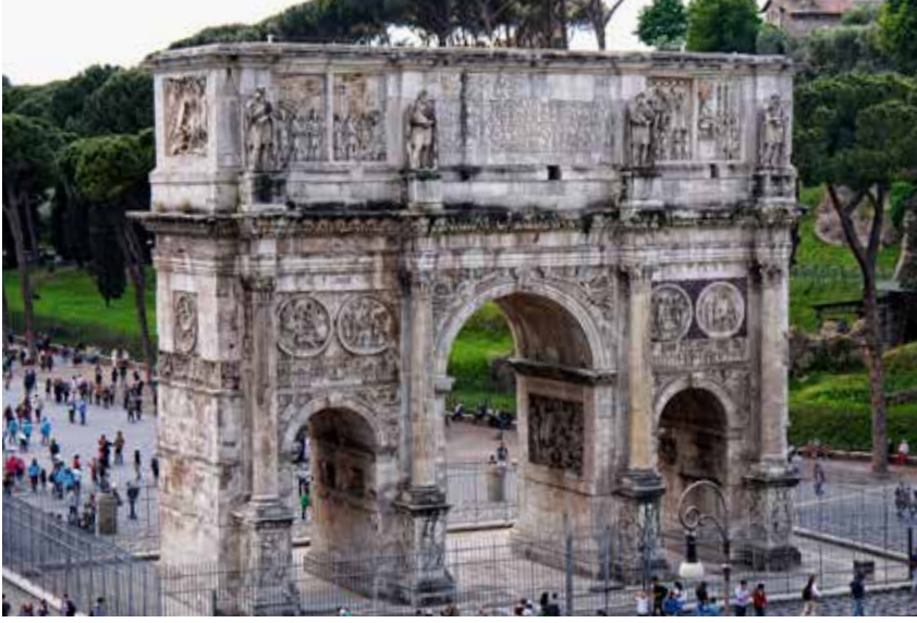
Şekil 11. Roma, Konstantinus Takı.

Roma'dan bir diğer örnek ise Konstantinus Takı'nda yer almaktadır (Şek. 11). Yine iri kristalli grimsi Prokonnesos mermerinden imal edilen başlık, Konstantinus Takı'nı çevreleyen bölümün alt kısmında, devşirme malzeme olarak kullanılmıştır. 37 Vatikan'da iyi korunagelmiş olan başlıkta belirgin bir biçimde sivri kesmeli akanthus mevcuttur. Keskin kesilmiş kertikler dar ve dik kenarlı yaprak dişlerinin arasından geçmekte ve üst sıra yapraklarını birbirlerinden ayırmaktadırlar. Colosseum ve Forum Augustus'un örneklerinde olduğu gibi Konstantinus Takı sütun başlığı grubu da özel bir form olmak üzere tek bölümlü kaulis düğümünü içermektedir. Söz konusu devşirme başlıklar Roma'da bulunan diğer iki örneğin ve Pergamon'daki Traianus Tapınağı'nın dönemsel biçimine sahiptirler. Bu nedenle Konstantinus Takı başlıklarının Hadrianus dönemine tarihlendirilmesi önerilebilmektedir. 38 Bu başlık da diğer örnekler gibi Anadolu ustaların ellerinden çıkmış olmalıdır. 39