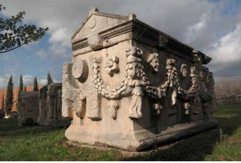
Şekil 4. Yarı işlenmiş mermer lahit. Aphrodisias Müzesi.