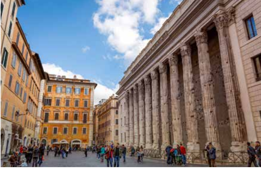
Şekil 13. Piazza di Pietra meydanında yer alan Hadrianeum'un korunagelmış cella duvarı ve 11 adet Korinth sütunu.

Anadolu mermerlerinin ve işçiliğinin görüldüğü bir diğer önemli bölge Suriye-Filistin bölgesidir. Roma'ya oldukça uzak, kendine has bir sanat geçmişi olan Suriye bölgesi mimari bezeme biçiminin değişimini, gelişimini hatta yeniden uyarlanmasını takip etmek açısından önemlidir. Roma'nın egemenlik sahasını MS I. yüzyılda Suriye-Filistin, Arap yarımadası ve Mısır'a değin genişletmesi ve tüm bu bölgelerde kendi gücünü ve ihtişamını göstermek istemesi sonucunda diğer Akdeniz kentlerinde olduğu gibi bu bölgede yer alan kentleri de bir nevi şantiye alanına çevirmiştir. 43 Roma'nın severek kullandığı Korinth yapı biçimi Suriye-Filistin bölgesinde yeni bir forma dönüşmüştür. Örneğin Baalbek'de Suriyelilerin yanında Romalıların istihdam edilmiş oldukları bilinmektedir. 44 Bu ustalar çalıştıkları projelerde artık belli bir sanatsal düşünceye ya da siyasal mimari bir akıma kendilerini bağlı hissetmemiş, aksine değişen ekonomik gerçeklere uyum sağlamakla beraber çeşitli sanat formlarını aynı binanın içinde, karışık bir biçimde kullanır olmuşlardır. 45