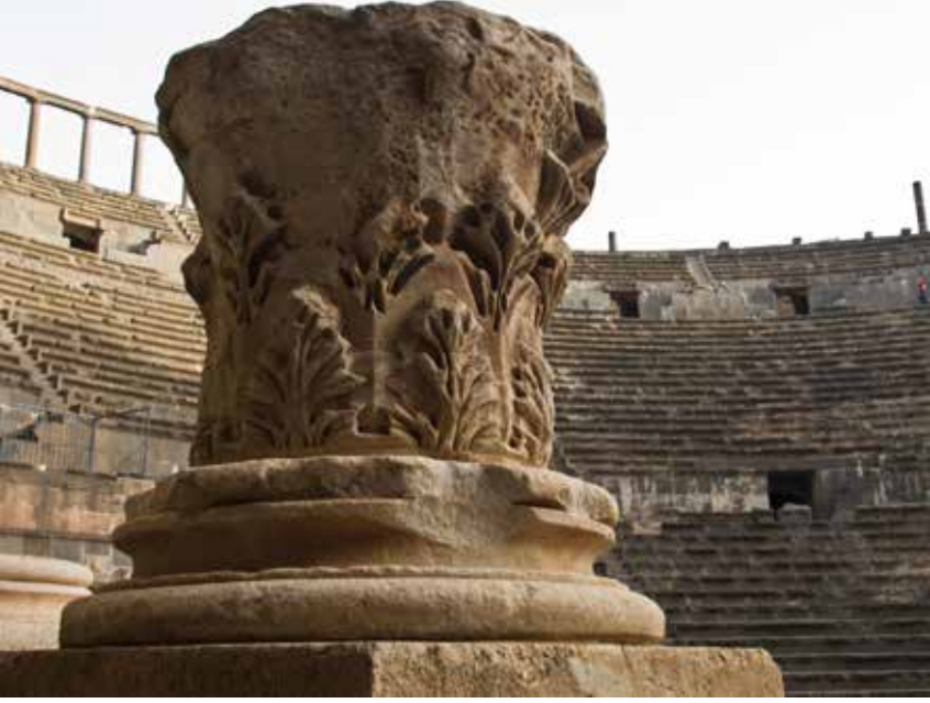
Şekil 19. Suriye, Bosra Tiyatrosu Korinth başlığı.

lanabilir. 71 Ancak bu başlık özelinde değerlendirilecek olduğunda, abakus levhasının üzerinde duran figürün yöreye has bir tasvir karakterini içinde barındırması nedeniyle, başlığın her iki biçeme de hâkim olan ustalarca tasarlandığını, fakat son işlemeyi yerel zanaatkârların yaptığını söylemek mümkündür. 72