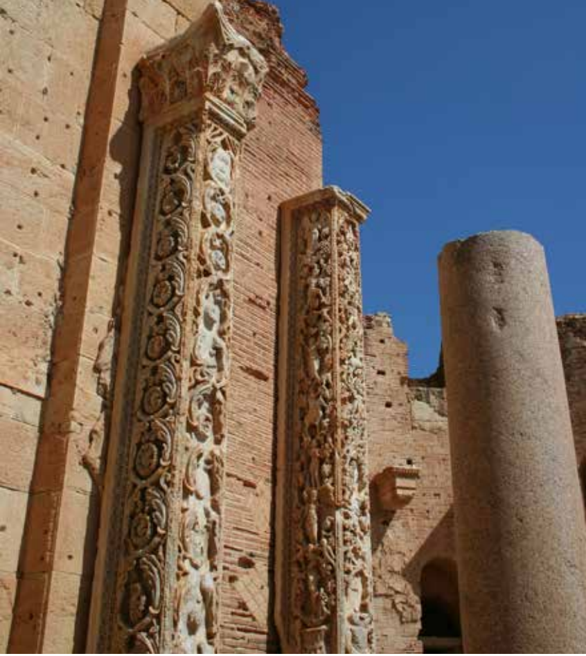
Şekil 16. Leptis Magna, Severus Bazilikası mermer pilasterleri figürlü sarmal dal bezemeleri.

Kalathosun üst kesiminde, dudağının altında bulunan boşluğa zambak biçimli bitki bezekleri işlenmiştir. Volütler geniş kanallıdır ve bunların iç köşelerinden çıkan ve her biri üçer yapraktan oluşan palmet çiçekleri ise ekhinusu süsleyen Ion kymationuna kadar uzanmaktadır. Abakus levhasının ortasında abakus çiçeğine de yer verilmiştir. 53 Bazilika A yapısında görülen bu başlık tipi Aphrodisias Bezeme Okulu'nun biçimini yansıtmaları açısından önemlidir. MS II. yüzyılın ikinci yarısından itibaren bu başlık tipi hemen hemen bütün Roma kentlerinde görülen başlık tipi olacaktır.