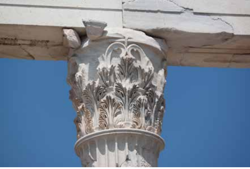
Şekil 8. Pergamon Traianus Tapınağı Korinth başlığı.

reklidir (Şek. 8). Başlıklarda kalathos kuvvetli bir etki vermektedir. Kalathosun üstünü kaplayan iki sıra akanthus yaprakları kalathos yüzeyinden belirgin bir biçimde dışa taşmaktadır. Bu da yapraklardaki plastik etkiyi güçlendirmiştir. 26 Üst sıra akanthus yaprakları alt sıra akanthus yapraklarının arasından yükselmektedir. Akanthus yapraklarının damarlarının daha ince ve derin oyulduğu görülebilmektedir. Yaprak dişlerinin üstlerinin içe doğru güzel bir biçimde oyulması ışık-gölge oyununun etkisini artırmıştır. Kaulisler üst yaprakların arasında küçük birer prizma olarak yerlerini almışlardır. Başlığın üst bölümünde, abakus levhasını taşıyan ve kırık olduğu görülen volütlerin altları derin oyulmuş, heliksler ise kalathos dudağının hemen altında içe doğru geniş bir kavisle kıvrılmıştır. Heliksler de volütler gibi güçlü bir etki bırakmaktadır. Bu derin oymalar başlıktaki ışık-gölge oyunu etkisini artırmaktadır. Kalın olarak işlenmiş olan abakus levhasının altındaki dudak alt kesiminde kalathosun içeriye doğru belli belirsiz bir kavis yapması ile güzel bir biçime sahip olmuştur. 27