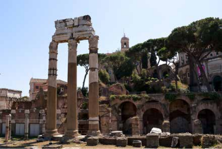
Şekil 3. Iulian Forumu Venus Genetrix Tapınağı.

kentin kimliğini değiştirmek isteyen imparatorun arzusuna paralel olarak girişilen imar projelerinde Carrara mermerinden eserler vermişlerdir. 8 Augustus Forumu'nun yer yer Atina ve Pergamon özellikleri sergilemesini de bu neden ile doğal karşılamak gerekir. 9