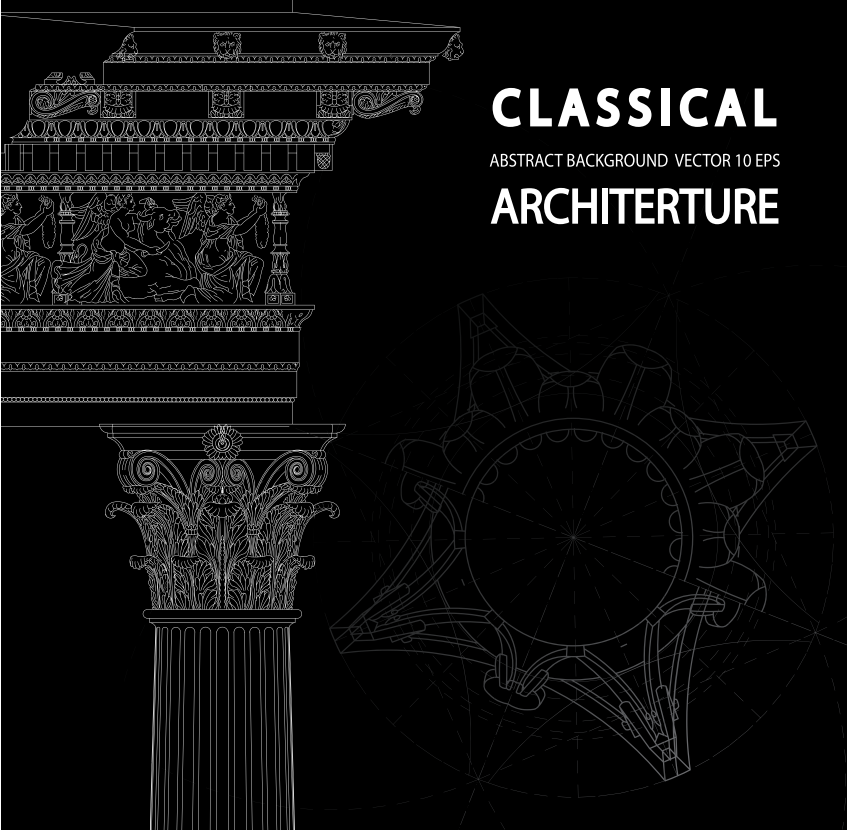
Şekil 6. Korinth Düzeni.

kolaylıklar nedeniyle irdelenmesi gereken mimari eleman Korinth başlıkları olmalıdır (Şek. 7). 21