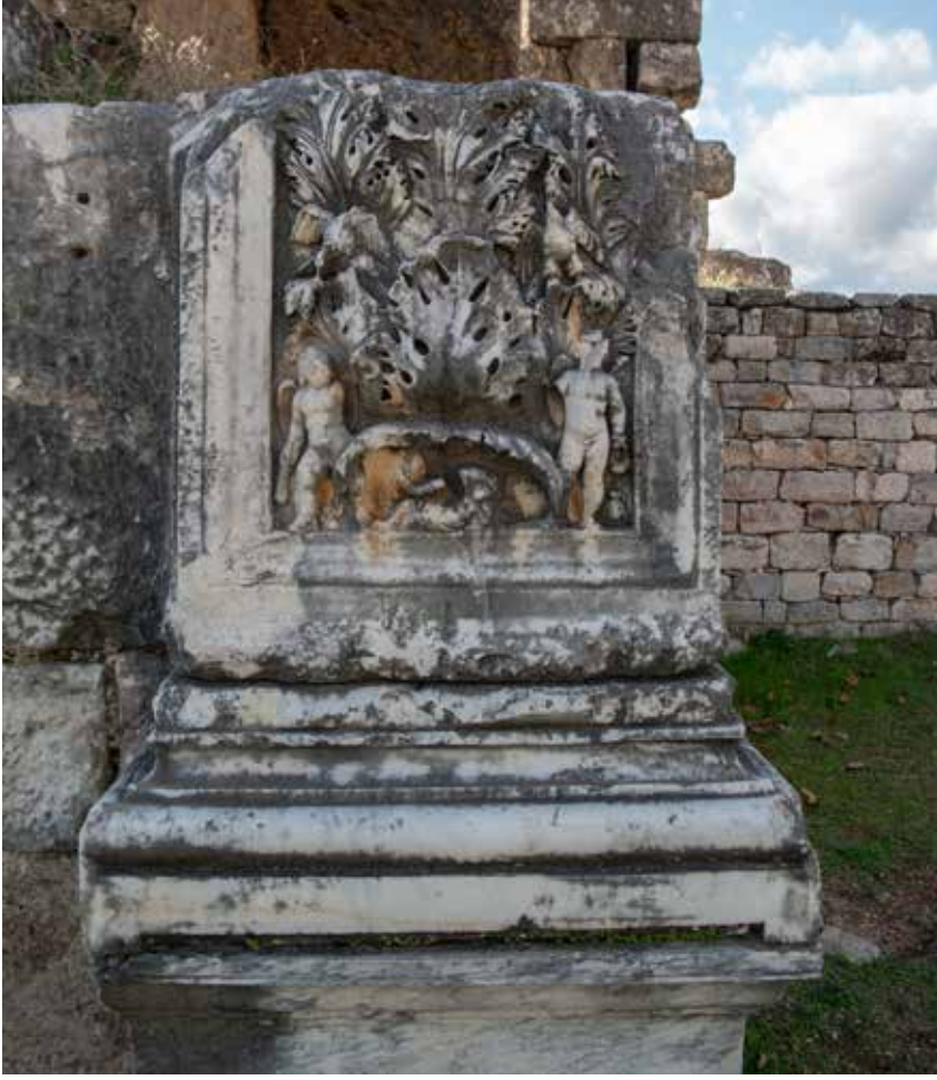
Şekil 17. Aphrodisias, Hadrianus Hamamı pilasteri sarmal dal bezemesi.

luğu gücünü yeni kurulan ya da yeniden imar edilen kentlerde yürüttüğü imar faaliyetleri ile göstermiştir. Bu projelerin hayata geçmesi ile yaşanan hammadde ve usta sıkıntısını, yine Roma'da olduğu gibi, Anadolu'da işletilen mermer ocakları ve eser veren bezeme okullarının hammadde ve usta ihraç etmesi ile aşmışlardır.