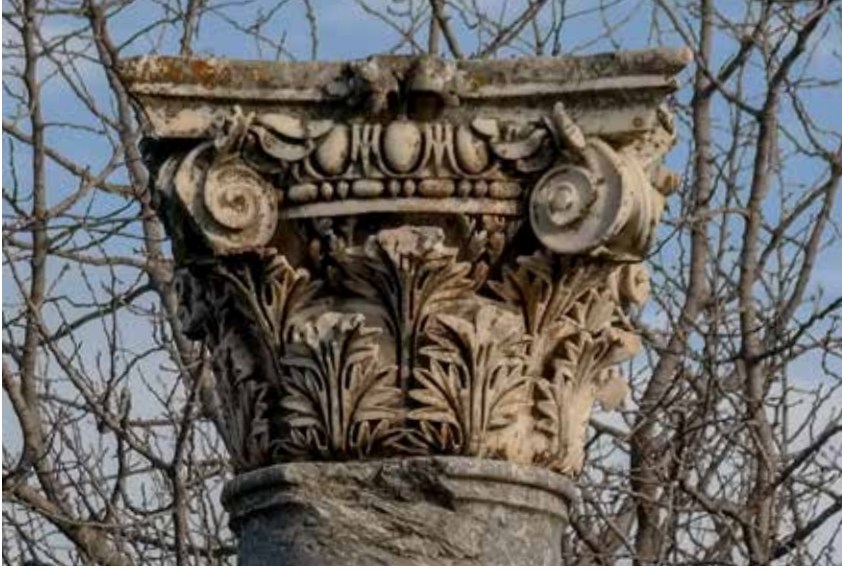
Şekil 15. Aphrodisias, Bazilika A kompozit başlığı.

me Okulu, MS II. yüzyılın ikinci yarısından sonra Roma İmparatorluk sınırları içinde yürütülen hemen hemen bütün imar faaliyetlerinde mimari bezeme konusunda tekelleşmeye başlamıştır. Roma'dan Suriye'ye, Filistin'den Kuzey Afrika'ya kadar geniş bir coğrafyada Aphrodisias Bezeme Okulu'nun biçem özelliklerini MS II-III. yüzyıl yapılarının birçoğunda görmek mümkündür.