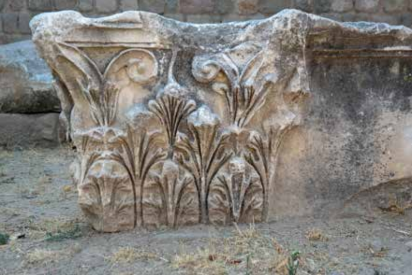
Şekil 14. Pergamon, Kızıl Avlu Korinth pilaster başlığı.

selmektedir. Bu kaideler ise çelenk yaprakları parçaları ile kısmen örtülmüşlerdir. 47 Üst akanthus yaprak çelenklerinin kalathos kaidesinden yükselmesi nedeniyle yapraklar başlığın büyük bir bölümünü kaplamaktadırlar. Söz konusu yaprakların damarları ise eğik hatlar ile ana damara erişmektedirler. Çanak yapraklar iki yarık hat ile ikiye bölünmüşlerdir. İç çanak yaprakları başlığın üst bölümünde, merkezde birbirleri ile temas etmemekte, fakat üst sıra akanthus yapraklarının üst kısımlarına kadar ulaşmaktadırlar. Heliksler ise volütlerin hemen yaprak çanağının üzerinden ayrılmakta ve kalathos dudağının altında açık bir spiralin içine doğru kıvrılmaktadırlar. Volütlerin üst yüzeyleri nispeten düzdür. Heliksler zayıf bir biçimde vurgulanmış olan bir kanala sahiptirler. Birbirlerinden kesin hatlar ile ayrılmış dört adet yapraktan oluşan sapsız abakus çiçeği, abakus levhasının cephesinin ortasında yer almaktadır. 48 Scythopolis kenti örneklerine bakıldığında ilk örneklerini Pergamon Traianus Tağnağı'nda olduğunu ve Kızıl Avlu'dan bilinen bir modeli takip ettiğini görmekteyiz (Şek. 14). Başlıkların biçemi Pergamon-Ephesos Bezeme Okulu'nun biçimini yansıtmaları nedeniyle bu başlıkların ithal ürünler olduğu düşünülmektedir. 49