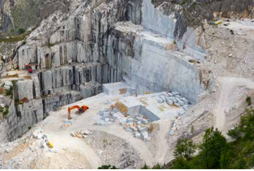
Şekil 2. Carrara Mermer ocaklarının günümüzdeki hali.