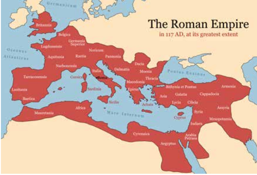
Şekil 1. MS II. yüzyıl başlarında Roma İmparatorluğu'nun hâkimiyet alanı.

gerçekliği üzerinden bir yorum yapılması durumunda Augustus dönemi öncesinde ve sırasında Roma kentini bakımsız, sönük ve donanımsız bir kent olarak tanımlamak mümkündür. 5 Augustus'un bu denli büyük bir imar faaliyetine girişip girişmediği son zamanlarda tartışılrsa da, bir idealin olduğu açıktır.