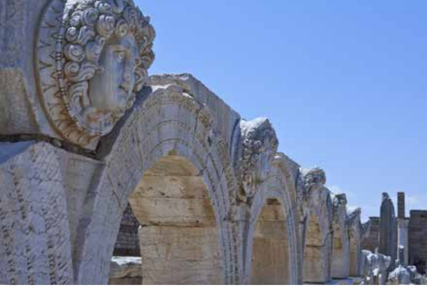
Şekil 18. Leptis Magna, Forum Portikoları'nı süsleyen Gorgo ve Nereid madalyonları.

neminden itibaren Küçük Asya'dan mermer yapı malzemesi ithal eden Leptis Magna'da Severus Bazilikası'nın mermer pilasterleri üzerinde görülen figürlü sarmal dal bezemeleri (Şek. 16), Aphrodisias Hadrianus Hamamı pilasterleriyle (Şek. 17) biçem yönünden büyük benzerlik göstermektedir. 54 Bu benzer öğeleri Leptis Magna Forum Portikoları'nı süsleyen Gorgo ve Nereid madalyonları (Şek. 18), Aphrodisias Hadrianus Hamamları Medusa ve Minotauros süslemelerinde de görmek mümkündür. 55 Ayrıca Leptis Magna'da birçok yapının Korinth başlıklarının Prokonnesos mermerinden yapıldığı ve bu başlıkların biçiminin Anadolu kökenli olduğu bilinmektedir. 56 Bu nedenle Leptis Magna'daki Severus dönemi yapılarında Aphrodisiaslı ustaların çalıştığı düşünülmektedir. 57