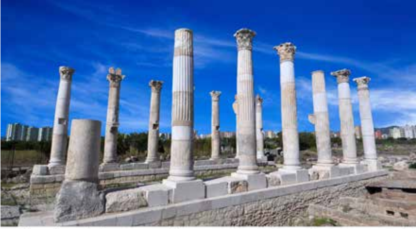
SOLİ/POMPEİOPOLİS SÜTUNLU CADDESİ GÜNEY UCU BATI PORTİKO YENİDEN KURMA DENEMESİ