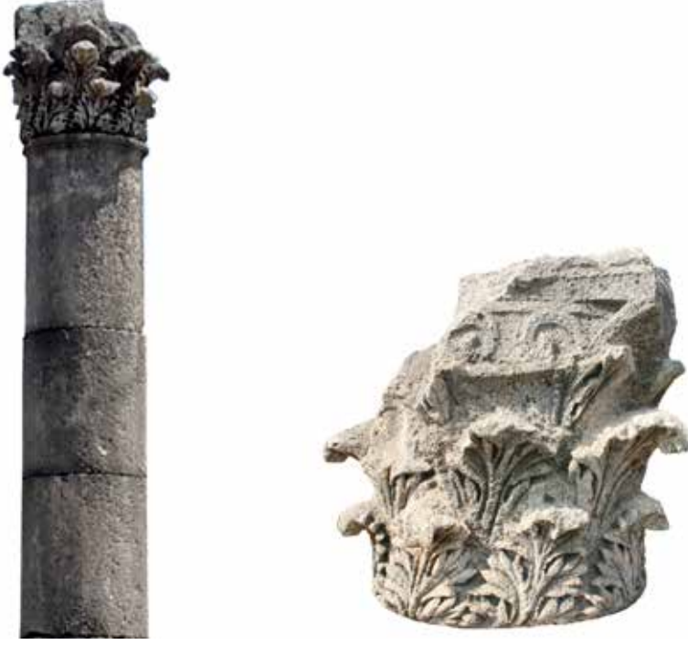
Şekil 21. Soli-Pompeiopolis, Rüzgârda Sallanan Akanthus Yaprağı bezemeli Korinth başlığı.

kaide işlevi görmüşlerdir. 79 Palmyra kentindeki sütunlu caddede sütun konsolları şehrin ünlü kişilerinin heykellerini taşımaktaydı. 80 Konsollu sütunların Anadolu'daki örnekleri coğrafi olarak Suriye'ye yakın olan Kilikia'da; Anazarbos, Hierapolis-Kastabala, Soli/Pompeiopolis ve Diokaisareia kentlerinde görülebilmektedir. 81 Yine örneklerine Kilikia-Soli-Pompeiopolis; Pamphylia-Perge ve Phrygia-Hierapolis kentlerinde rastladığımız "Rüzgârda Sallanan Akanthus Yaprağı" olarak tanımlanan yaprak biçemi de (Şek. 21) Suriye kökenlidir. 82 Sütunlardaki konsol eklentileri ve rüzgârda sallanan akanthus yaprak biçemi gibi yenilikler göz önünde bulundurulduğunda Anadolu taş ustalarının Suriye'ye taşımış olduğu sanatın değişime uğrayarak tekrar Anadolu'ya geldiği söylenebilir. Bu biçem özellikleri nedeniyle "Suriye Tipi" olarak tanımlanan mimari bezeme öğelerinin yaratıcıları, olasılıkla Anadolu ustalar ile çalışan ve özgün eserler veren yerel ustalar olmalıdır.