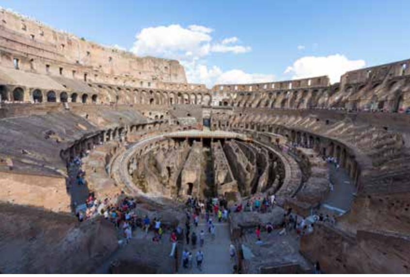
Şekil 10. Roma, Colosseum.

Roma'dan bir diğer örnek ise Colosseum'dan (Şek. 10) ele geçmiştir. İri kristalli grimsi Prokonnesos mermerinden imal edilmiş olan başlık, tıpkı Augustus Forumu başlığında olduğu gibi, Anadolu biçem özelliği göstermektedir. 33 İşçilikten hareketle başlığın Forum Augustus örneklerine yakın olduğu söylenebilmektedir. Hatta başlığın ölçüleri ve mermer türü de Forum Augustus'un başlıkları ile uyuşmaktadır. Destek yaprağı dışında özenli bir işçiliğin varlığı söz konusudur. Leon'a göre Colosseum'da bulunan başlık ile Forum Romanum'da yer alan Bazilika Iulia Korinth başlık gurubu arasında işliğe dayandırılacak bir bağlantı söz konusudur. 34 Ne var ki yapılaşlarına göre değerlendirildiklerinde başlıklar birbirlerinden esaslı bir biçimde ayrılmaktadırlar. Colosseum'da bulunan örnek, çentikli kesilmiş bir akanthus ile bezenmiştir, yaprakları daha geniş ve daha basık çalışılmıştır. Buna karşın Forum Romanum'da yer alan başlık grubunun yaprak dışlarının uçları yuvarlaktır ve yine yumuşak formlu çukurluklar Roma kentinin taş ustalarının işçilik izlerini taşımaktadırlar. Bu sayede Forum Romanum'un başlıkları daha ince ve zarif bir görünüm kazanmışlardır. 35 Bu özellikleri ile Colosseum başlığı Pergamon Traianus Tapınağı başlıklarına benzemektedir. Augustus Forumu başlığı ile olan benzerliğinden yola çıkarak başlığı Hadrianus dönemine tarihlemek mümkündür. Ancak olasılıkla başlık Colosseum'u tadil ettiren Antoninus Pius döneminde binaya eklenmiş olmalıdır. 36