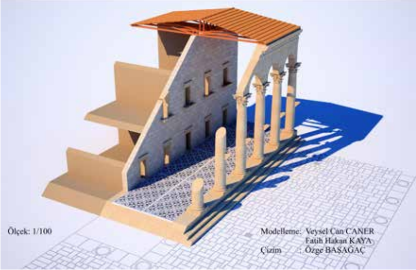
Şekil 20. Soli-Pompeipolis Antik Kenti Sütunlu Caddesi.

Sütunlu caddelerin heykel galerilerine dönmesini sağlayan ise Suriye kökenli bir eklentidir 77 ve sütun konsolları olarak adlandırılan bu eklenti Suriye kentlerinde, birçok sütunlu caddede görülebilmektedir (Şek. 20). Sütunlar üzerine inşaat sırasında ya da ihtiyaca göre sonradan eklenen konsollar 78 bu heykellere