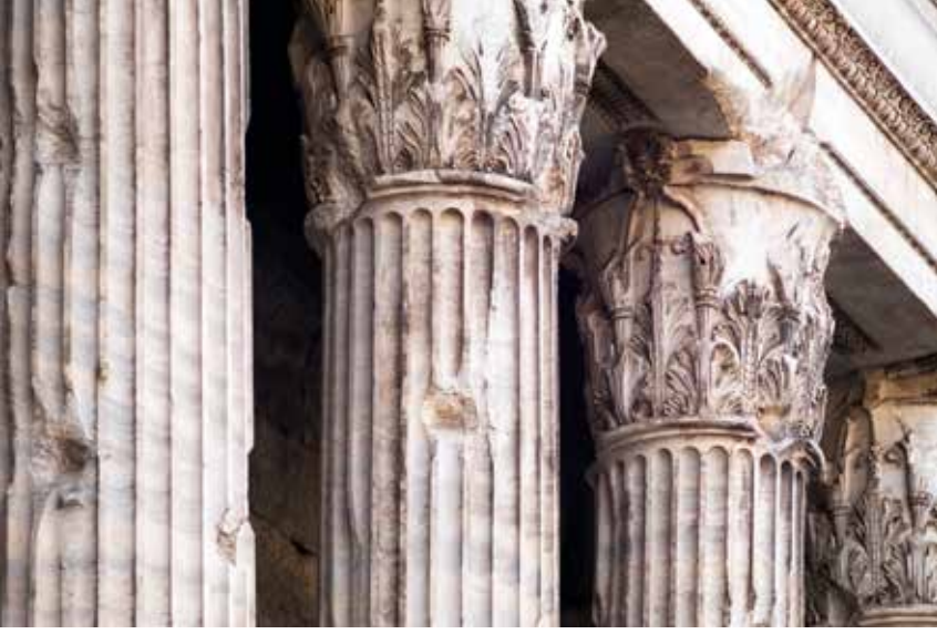
Şekil 12. Roma, Hadrianeum Korinth başlıkları.

Bugün Piazza di Pietra meydanında bulunan borsa binasının arka cephesini oluşturan cella duvarı ve korunagelen 11 sütunun taşıdığı başlıklar daha önce bahsedilen başlıklar gibi Anadolu başlıklarının biçem özelliklerini sergilemektedirler (Şek. 12-13). Gösterdiği ince işçilik nedeniyle özenli bir işin ürünü olduğu, dolayısıyla da “pahalı” olarak tanımlanabilecek eserler grubuna girdiğini rahatlıkla söyleyebiliriz. 41