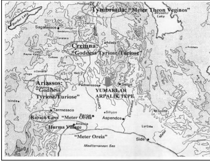
Şekil 1. Güney Pisidia ve Pamphylia (Mitchell, 1991: 120)

1998 yılında Arpalık Tepe’de yer alan kutsal alanda kaçak kazı tahribatını engellemek amacı ile Antalya Arkeoloji Müzesi tarafından kurtarma kazıları yürütülmüştür. 3 Alanda gerçekleştirilen kazı çalışmaları sonucunda, MÖ 6–MS 4. yüzyıllar arasında 1000 yıl boyunca kullanım gördüğü anlaşılan kutsal alana bırakılmış adak eşyaları ile birlikte çok sayıda sikke de açığa çıkarılmıştır. 4