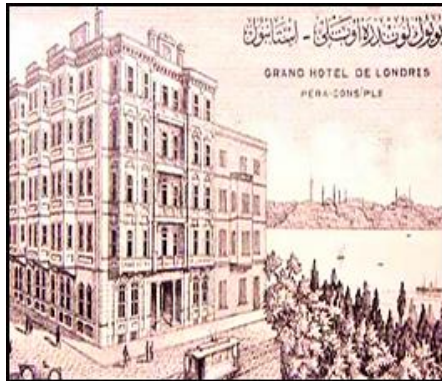
Şekil 8. 5