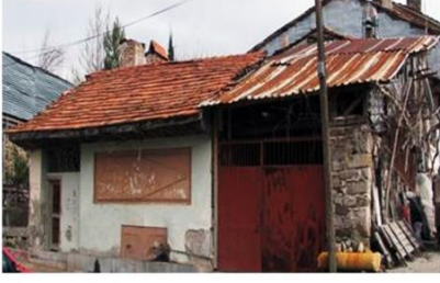
Eskiğediz Kasabası Salur Çamaşırhanesi

Fotoğraflar 13-26. Gediz Çamaşırhaneleri (Fotoğraflar yazara aittir).