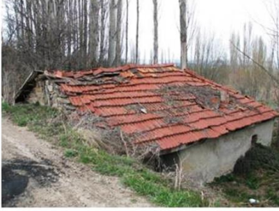
Polat Köyü Çamaşırhanesi