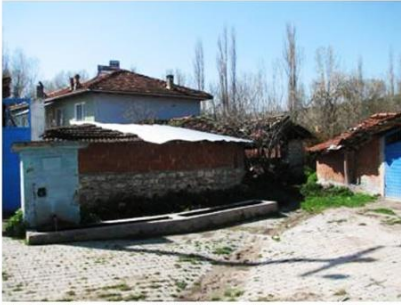
Yeğınler Köyü Yukarı Çamaşırhane