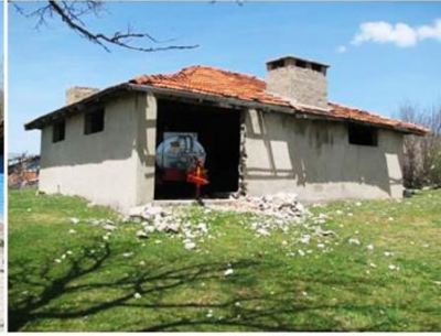
Yeşilova Köyü Çamaşırhane 1-2