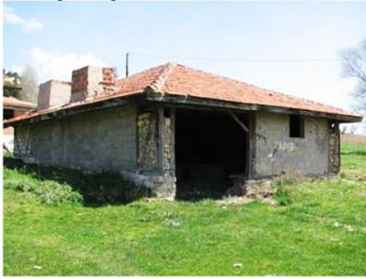
Yeşilova Köyü Yukarı Köy Çamaşırhanesi