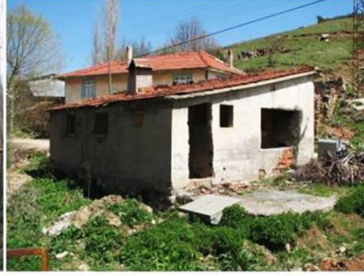
Yağmurlar Köyü Çamaşırhanesi ve Orta Mahalle Çamaşırhanesi