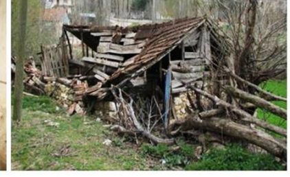
Işıklar Köyü Çamaşırhanesi