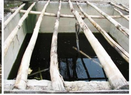
Ali Ağa Köyü Çamaşırhanesi