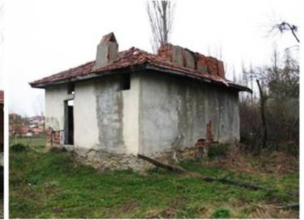
Cebrail Köyü Çamaşırhanesi 1-3