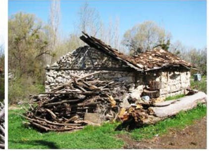
Yeğınler Köyü Aşağı Çamaşırhane