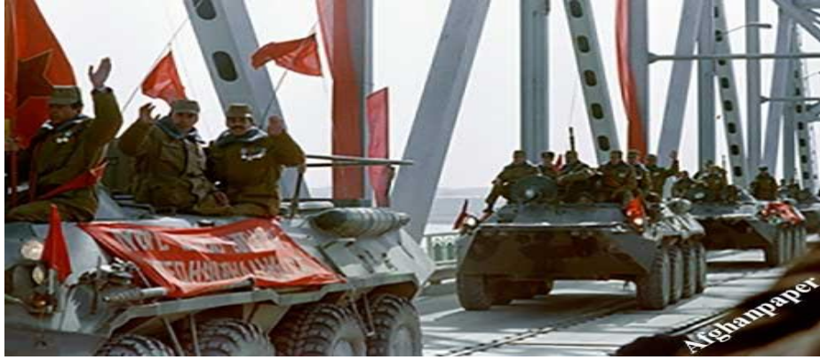
Resim 3: Sovyet Birliklerinin Afganistan'dan çekilmesi,

yararlanmaya odaklandılar. Bu özellikle Rusya'dan ekonomik yardım alan ülkelerde belirgin bir haldedir. Bu yardım karşılığında Rus kültürünün yayılması amaçlanmaktadır. Afganistan'daki durum bu şekildedir. Eğitim ve öğretimden başlayan süreç ekonomik yardım ve kültürel ilişkiler yoluyla tamamlanmaktadır. Askeri destek böylece sosyalist ideolojiyi ve Marksist ideolojiyi yaymaya başlamıştır. Afganistan'daki Komünist Parti, yönetimi devraldığına ve bazı komünist fikirlerin Afganistan'daki Marksist sisteme uygulanmasının başlamasıyla bu ortaya çıkmıştır. 22 Başlıca hedefleri, güney sınırlarının güvenliğini korumak, Pakistan limanlarını ele geçirmek, sıcak denizlere ulaşmak ve Arap denizindeki petrol kuyusuna yakın olan Arap Denizi'ne yakın yerleri elde etmektir. Körfezde Afganistan'daki gelişmeleri izleyen ABD, Rusya tarafından BM'nin Afganistan'ın işgaline itiraz etmeye başlamasına neden olmuştur. Birleşik Devletler, Rusya ile savaşan Afgan direniş örgütlerine yardım ve silah transferleri sağlamıştır. ABD, Pakistan, Suudi Arabistan ve Birleşik Arap Emirlikleri, Afganistan direnişini destekleyen önde gelen ülkeler arasındadır. 23