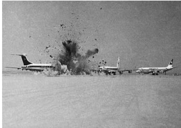
Resim1: Eylül olayları, https://sites.google.com/site/mrmooreswhsemesterii/vocabulary-pictures/one-day-in-september (20.08.2019).

ve devlet içinde bir devlet kurulması öngörülmekteydi. 12 4 Mart 1973 tarihli Bozkurt gazetesinde ise Kara Eylül ile ilgili olarak, "Kara Eylül Örgütü 1970 yılında Ürdün ile Filistinli gerillalar arasında meydana gelen iç savaştan sonra kurulmuştur. Bilindiği gibi iç savaş Filistinlilerin kanlı bir biçimde imha edilmesi ve Ürdün'den çıkarılmalarıyla sonuçlanmıştı. İsrail kadar Ürdün'e de düşman olan Filistinli gerillaların en radikal kanadı, iç savaşın intikamını almak için kurdukları gizli örgütte, savaş eylül ayında cereyan ettiğinden "Kara Eylül" adını takmışlardır" biçiminde ifadelere rastlanmaktadır. 13 1970 yılında Filistin Kurtuluş Örgütü (FKÖ), halka açık olarak Ürdün'deki monarşinin yıkılmasını talep etmeye başlamış, Ürdün yasalarını görmezden gelmiş ve bazı durumlarda Kral Hüseyin'i öldürmeye çalışmış ama başaramamıştır. 10 Eylül 1970 de FKÖ üç sivil uçağı ele geçirmiş, yolcuları rehin almış ve uçakları yakmıştır. Bu durum Ürdün hükümetince kabul edilemez bulunmuştur. Ürdün hükümeti anlaşma olmadan Ürdün içindeki herhangi bir arazinin elden çıkarılmasına izin verilemezdi. 17 Eylül 1970 de, Yaser Arafat'ın önderlik ettiği Filistin Kurtuluş Teşkilatı ile Ürdün silahlı kuvvetleri arasında silahlı bir çatışma yaşanmıştır. El Fetih ve FKÖ taraftarları, Ürdün'deki rejimi devirmeyi başaramamıştır. Savaş, Ürdün ordusunun zaferiyle sonuçlanmıştır. Bu bağlamda FKÖ, Lübnan iç savaşında savaşıyan taraflardan biri olmuştur. 14