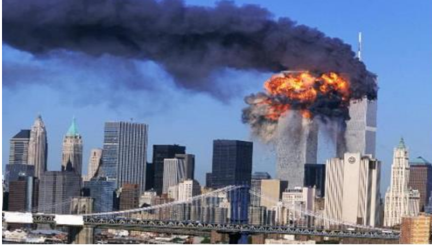
Resim: 4. 11 Eylül Saldırıları

başlamıştır. 18 dakika sonra, ikinci bir uçak doğrudan ikinci kuleye çarptığında ise bu durum büyük bir patlamaya neden olmuştur. Bu terör eyleminde Pentagon'da saldırıya uğramıştır ve birçok insan bu bombalamanın kurbanı olmuştur. Söz konusu olay olduğunda, Başkan George W. Bush hayatını korumak için Paxil üssüne transfer edilmiştir. Federal binalar, Pentagon ve diğer devlet binaları, Beyaz Saray, Meksika ve Kanada sınırının kapatılması ve hava sahasının kapatılması dışında boşaltılmıştır. 24