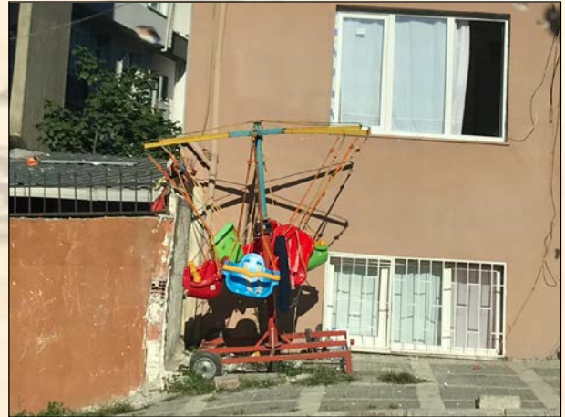
Şekil 5. Selamsız Bölgesi Sokak Görünümleri