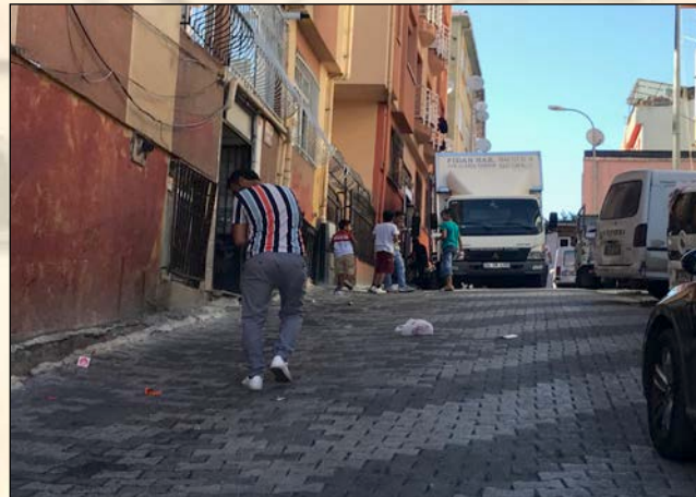
Şekil 4. Selamsız Bölgesi Sokak Görünümleri