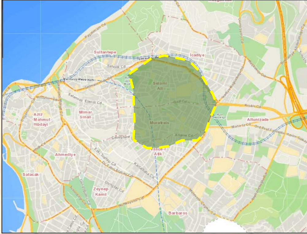
Şekil 2. Selamsız Konum (İBB Şehir Rehberi, 2019)