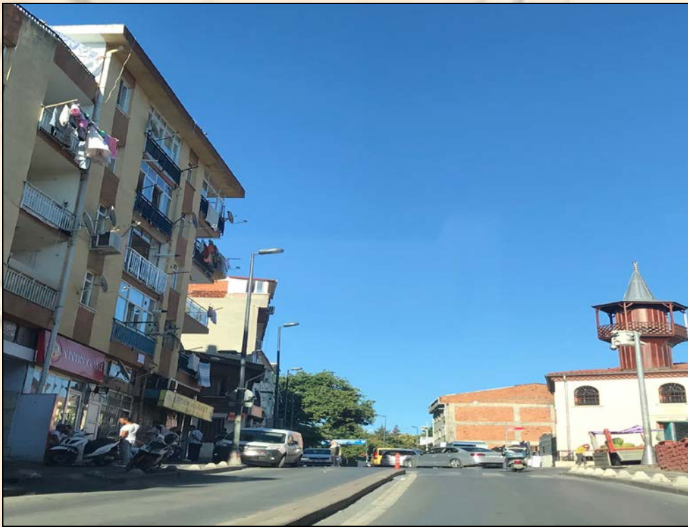
Şekil 3. Selami Ali Efendi Caddesi'nden Görünüm