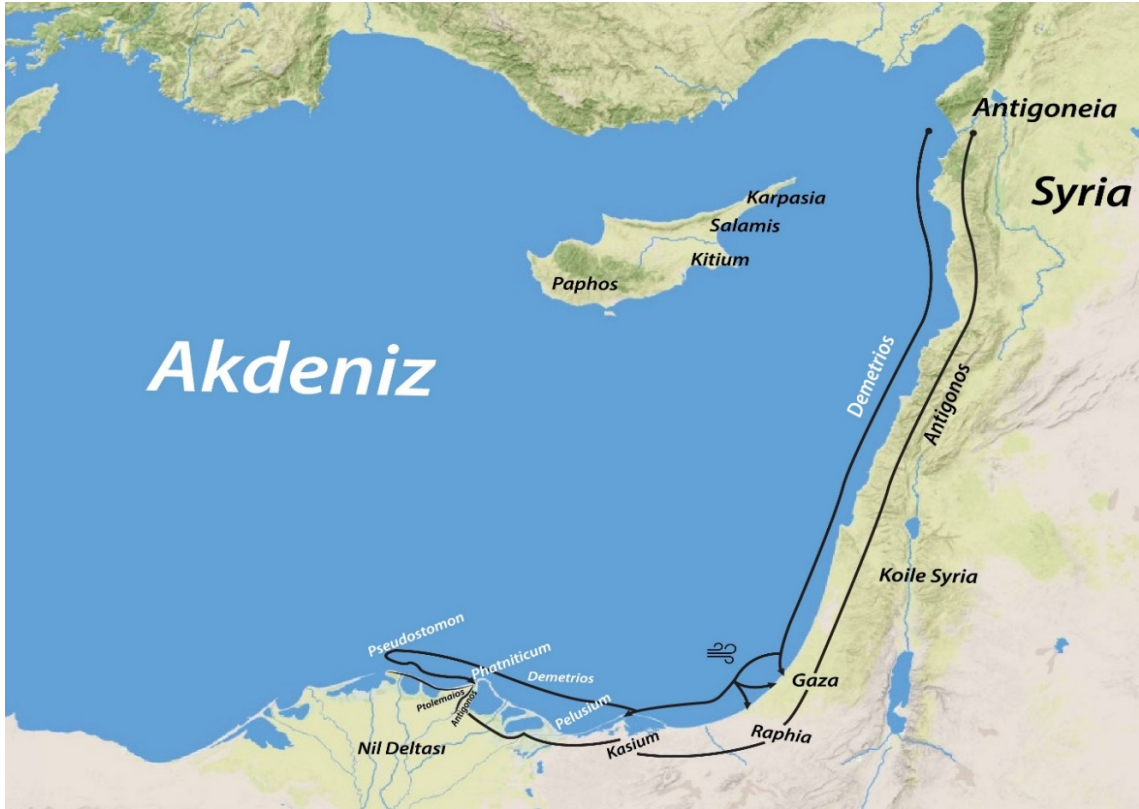
Fig. 1. Antigonos Monophthalmos ve Oğlu Demetrios'un Mısır'ı İstila Girişiminde İzledikleri Güzergâh

Karadan ve denizden eş zamanlı bir saldırı planı düzenleyen Antigonos'un Mısır'ı ele geçirmek için yaptığı hazırlıkların oldukça yeterli olduğu görülmektedir. Fakat Demetrios tarafından denizden gerçekleştirilecek çıkarma için coğrafi ve iklimsel koşulların göz ardı edildiği söylenebilir.