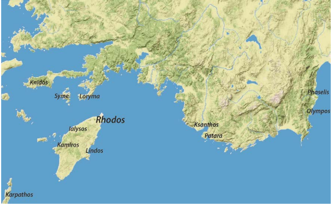
Fig. 3. Rhodos Adası'nın Genel Konumu