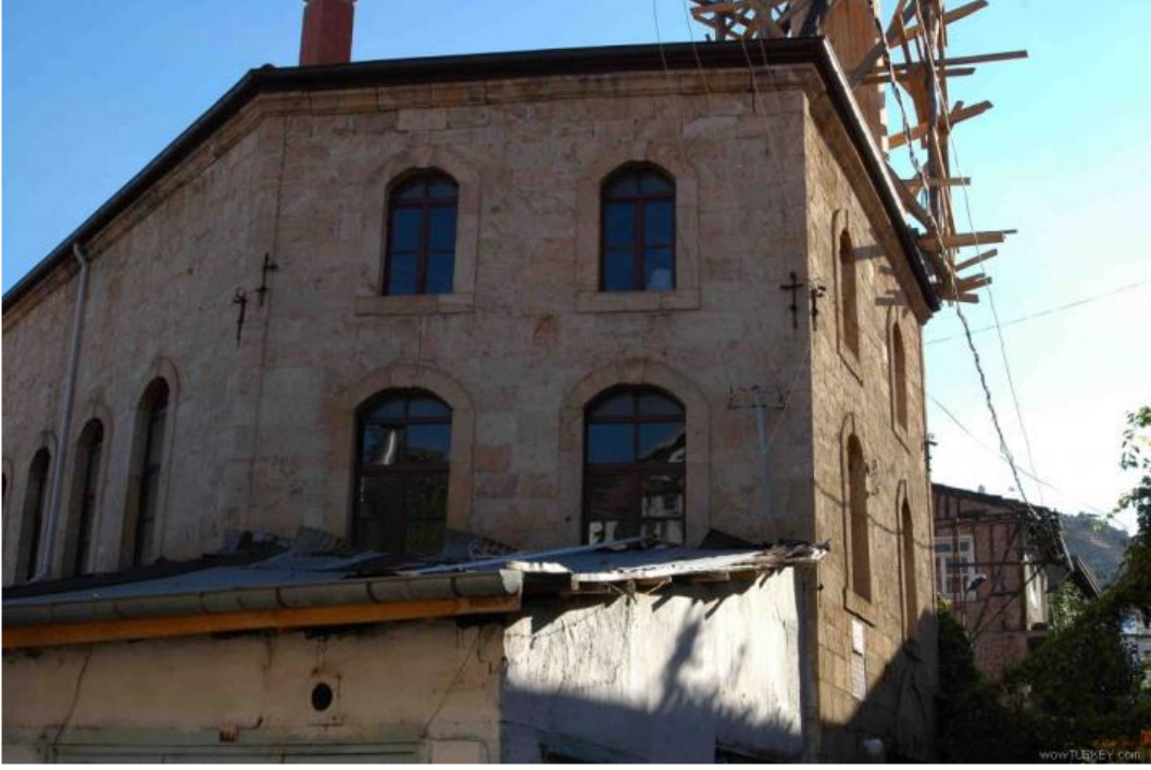
Fotoğraf 1: İncili Camii (1903 M.) dış cephe genel görünüşü. http://www.beypazarliyiz.com/bilgiarsivi/beycami.aspx (17/07/2014).

İstiklal Mahallesi, Kuyumcular Sokak No. 5'de bulunan yapı, Kuyumcular Sokağı ile Çilingirler Sokağı'nın kesiştiği kavşak noktasında yer almaktadır. Cami, kareye yakın dikdörtgen planlı harim ile bir son cemaat mahallinden oluşmaktadır. Üst örtü, dıştan çatı ve içten düz ahşap tavanlıdır. Muntazam kesme taş kullanılarak inşa edilen yapının güney ve doğu cephelerinde her katta ikişer adet olmak üzere dört kemerli pencere yer almaktadır. Güneybatı cephesi ise yine kemerli olmak üzere beş pencereye sahiptir. Yapı külesine dâhil edilen tek şerefeli ahşap minare görülmektedir.