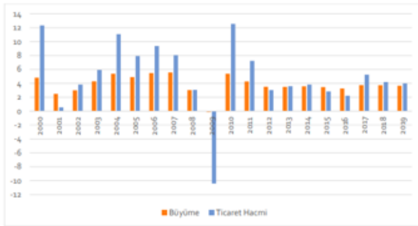
Grafik 2: Küresel Ticaret Hacmi ve Büyüme (%)

Dünya GSMH’sı ve büyüme oranlarında yaşanan gelişmeler doğrudan mal ve hizmet ticaretini de etkiler. Eğer gelişmeler olumlu yönde gerçekleşmiş ise bu durumdan mal ve hizmet ticaretini olumlu; aksi yönde ise olumsuz yönde etkileyecektir. Kısaca, büyüme ile mal ve hizmet ticareti arasında her zaman doğru yönlü bir ilişki bulunmaktadır. 2000-2018 dönemini kapsayan ekonomik göstergelerin değişim seyrinin gösterildiği (Tablo 1) incelendiğinde bu durum açıkça görülmektedir. 2000 yılında % 12.1 olan dünya mal ve hizmet ticareti ortalaması 2001 yılında % 0.3 seviyelerine kadar gerilemiş. 2004 yılına gelindiğinde ise bu oran tekrar % 10.4 seviyesine kadar yükselirken; 2008’de ABD ortaya çıkan küresel mali krizin etkisiyle % 2.9’a gerilediği açıkça görülmektedir. Ancak esas düşüşün küresel mali krizi takip eden 2009 yılında % -11.0 olarak gerçekleşmesiyle ortaya çıktığı görülmüştür. 2011 yılına gelindiğinde ise tekrar 2000’li yılların ortalaması yakalanarak % 12.4 olarak gerçekleşmiş. Takip eden yıllarda ise bu oranlar; 2015 yılında % 2.6, 2017’de % 5.2 ve 2018 yılında ise % 3.8 olarak gerçekleştiği (Grafik 2)’de görülmektedir