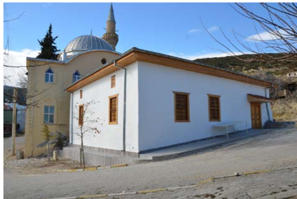
Fig. 3. Yeşilyayla Eski Kerpiç Camii Güneydoğu Cephesi