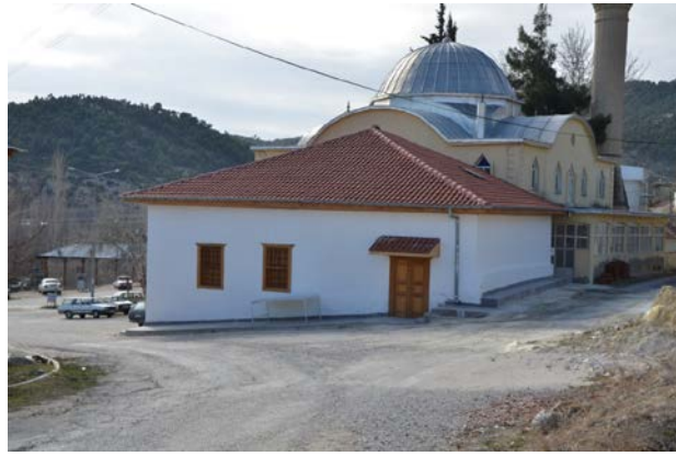
Fig. 2. Yeşilyayla Eski Kerpiç Camii Genel Görünüm