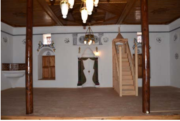
Fig. 8. Yeşilyayla Eski Kerpiç Camii Güney Duvarı