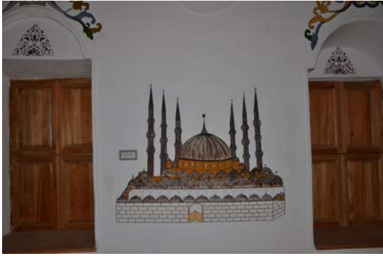
Fig. 6. Yeşilyayla Eski Kerpiç Camii'nin Doğu Duvarındaki Sultanahmet Camii Resmi