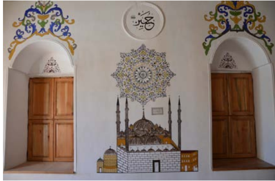
Fig. 7. Yeşilyayla Eski Kerpiç Camii'nin Batı Duvarındaki Süleymaniye Camii Resmi

Güney duvarın ortasındaki yarım daire planlı mihrap, 0.94 m. genişliğinde ve 2.44 m. yüksekliğindedir. Mihrap nişi, köşelere toplanmış beyaz zemin üzerine yeşil renkte perde motifleriyle bezelidir. Perdelerin birleştiği noktadan yukarıdan aşağıya doğru zincirle sarkıtılan ve ucunda tanrısal ışığı ve nuru simgelediği düşünülen bir kandil motifi yer almaktadır 8 . Nişin her iki yanında ise duvara gömülü şekilde yerleştirilmiş sütunceler yer almaktadır. Sütunceler basit profilli kaide ve başlıklarla sahiptir. Sütun ve kaideler yeşil ve mor renkte boyanmıştır. Başlıklar ise yeşil ve pembe renkteki palmet ve yaprak motifleriyle süslenmiştir. Süsleme açısından yalın bırakılan mihrap kavsarası, aşağıdan yukarıya doğru üç kademeli olarak daralmaktadır. Mihrabın hemen üzerinde, yatay dikdörtgen formunda kelemişi tekniğinde düzenlenmiş bir çerçeve yer almaktadır. Çerçevenin yüzeyinde, gri zemin üzerine siyah renkte küllemâ de hale aleyhâ zekeri yüzyule'l-mihrâb 9 yazmaktadır. Çerçeve, her iki yönden kalemî tekniğinde korint başlıklı sütunlarla sınırlandırılmıştır. Harimin kuzey duvarının zemin seviyesi, dikdörtgen panolarla hareketlendirilmiştir. Panolar atlamalı olarak kırmızı, yeşil ve pembe renkteki perde motifleriyle süslenmiştir (Fig. 8).