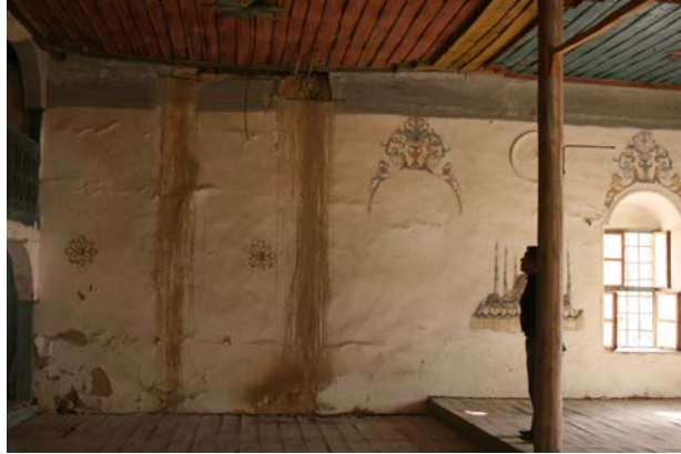
Fig. 11. Yeşilyayla Eski Kerpiç Camii Restorasyon Öncesi Durumu