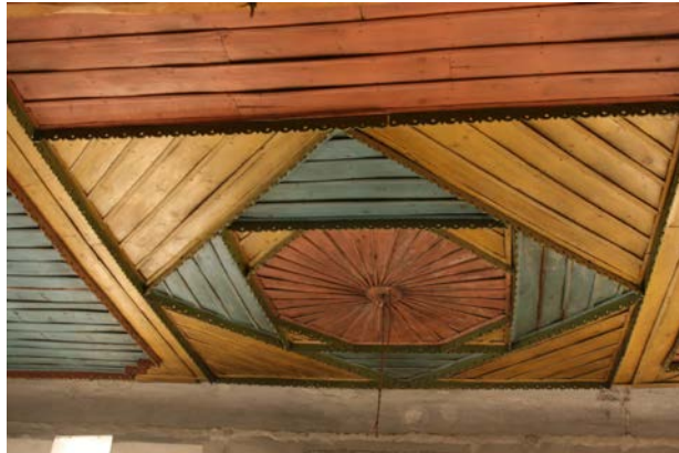
Fig. 12. Yeşilyayla Eski Kerpiç Camii Restorasyon Öncesi Tavan Süslemelerinden Detay