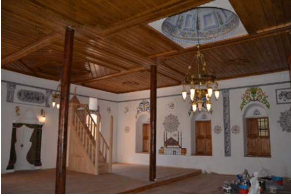
Fig. 4. Yeşilyayla Eski Kerpiç Camii Harim İçi Genel Görünüm