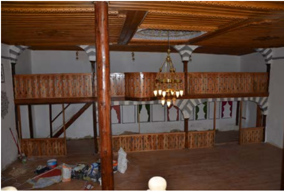
Fig. 9. Yeşilyayla Eski Kerpiç Camii Kuzey Duvarı

iki mahfil korkulukları basit profilli ahşap şebekelerden meydana gelmektedir (Fig. 9).