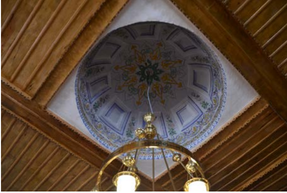
Fig. 5. Yeşilyayla Eski Kerpiç Camii Bağdadi Kubbedeki Kalemîşi Süslemeleri

cephesi hem süsleme hem de pencere düzenlemesi bakımından sağır tutulmuştur.