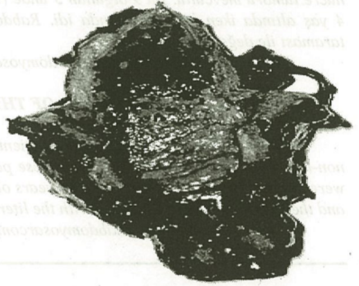
Şekil.3: Sistoprostatektomi materyalinde duvar kalınlaşması, mukozal hemoraji odakları

radikal sistoprostatektomi + lenf nod disseksiyonu + üreteroileokutanostomi uygulandı. Postoperatif patolojik değerlendirmede bilateral lenf nod tutulumu rapor edildi, bu nedenle patolojik evrenin grub-2c bildirildi. Lenfatik yayılım nedeniyle olguya bölünmüş dozlar halinde 5.000 cGy'lık eksternal radyoterapi ve sistemik kombine kemoterapi (pulse-VAC) uygulandı. Kemoterapi düzenli uygulanamadı ve takipteki olgu tanıdan 4 yıl sonra kaybedildi. (Şekil.3)