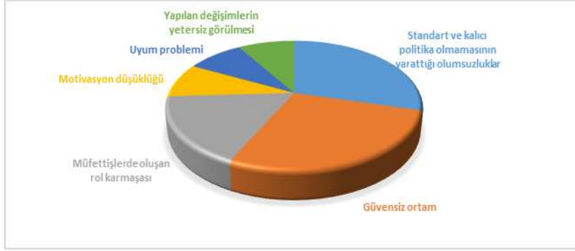
Şekil 1. Sıklıkla yapılan değişimin okul yöneticileri, öğretmenler ve müfettişler üzerindeki etkileri

Şekil 1’de görüldüğü üzere denetim politikaları ile ilgili standart ve kalıcı politikaların olmaması ve sıklıkla sistemde değişiklik yapılması paydaşlar arasında belirsizlik ve güvensiz bir ortam oluşturmaktadır.