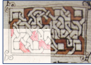
Görsel 7. Süsleme detay çizimi 3

Görsel 8'de Aziz Mor Dimet'in bölümü görülmektedir. Tanrıdan Mor Dimet'in dualarıyla onlara yardım etmesini dilerler. Mor Dimet'in asker iken tanrının onu nasıl hidayetler ile kendi yoluna çektiğini ve geçirdiği ruhsal değişimini anlatıyor. Süslemesinde daha net çizgiler ile çizilmiş dikdörtgen form içerisinde zencerekler ile oluşturulmuş bir kompozisyon ve bu kompozisyonun merkezinde yan yana oluşturulmuş iki artı işareti görülmektedir.