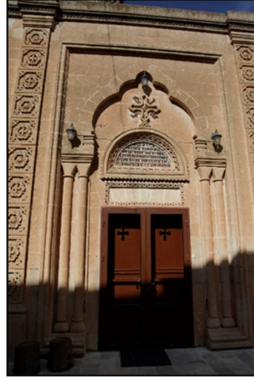
Görsel 1. Mor Barsavmo kilisesi