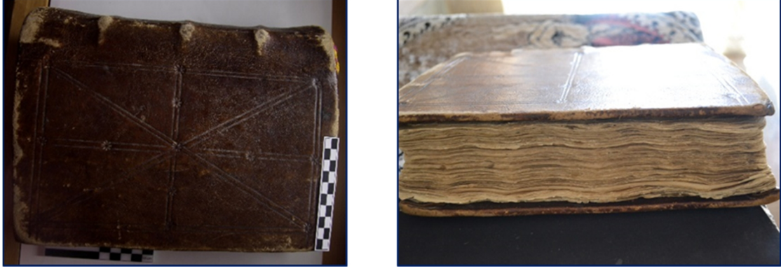
Görsel 2. El yazmasının cildi

Görsel 3’de Kaide üzerine oturtulmuş ve zencerceler ile çevrenilmiş içerisinde küçük geçmelerden oluşturulmuş büyük haç motifi görülmektedir. Karşısındaki sayfada sol elinde yeryüzü hâkimiyetini temsil eden asa ve sağ elinde ise göksel krallığı simgeleyen ‘haç’ı tutan İsa figürü yer almaktadır.