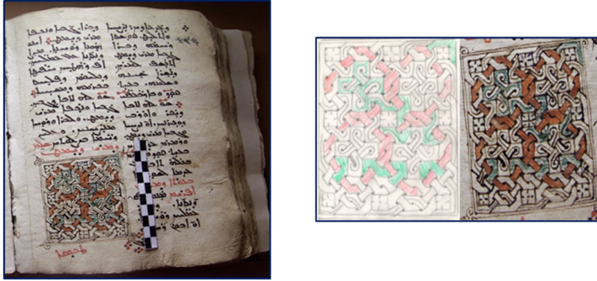
Görsel 9. Süsleme detay çizimi 5

Görsel 9'da Rab İsa'nın dostu Aziz Mor Dimet'in bahsi geçmektedir. Kutsal Üçleme tarafından sevilen duası ile bize yardımcı, şefahtçi ol ki Rab bize merhamet etsin! diye başlayan litürjiler bulunmaktadır. Süslemede zencerek kompozisyonu kare forma yakın dikdörtgen bir çerçeve içine alınmıştır. Kapalı kompozisyon oluşturan ve birbirine tutturulmuş iki aynı biçimdeki zencerek kompozisyon kendi içinde simetri oluşturmuştur.