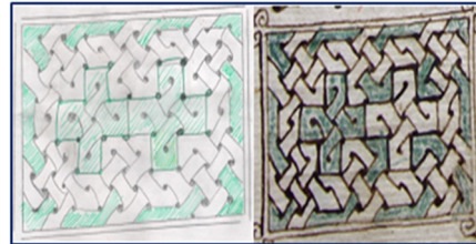
Görsel 8. Süsleme detay çizimi 4