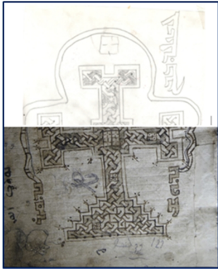
Görsel 4a. Kaideli haç detay çizimi (2.sayfa)

Bu yazının açılmış hali ise şöyledir: “ܕܝܢܐ ܕܡܝܬܐ ܕܚܘܪܐܢܐ - ܕܝܢܐ ܕܡܝܬܐ ܕܚܘܪܐܢܐ” “Bokh ndaqar l-b’aldbobeyn-u-metul şmoxh ndawaş l-soneyn” “Seninle süngüleriz düşmanlarımızı- ve senin adın uğruna hasımlarımızı ayaklarımızın altında çiğneriz”. Burada dikkate değer olan şey bu form ve içeriğe sahip yazıların haçın etrafına istif edilmesi son derece ilginç ve ilgi çekicidir. Ayrıca büyük kaideli haçın sağ ve sol üst başlarında geçme ile oluşturulmuş küçük haçlar da görülmektedir.