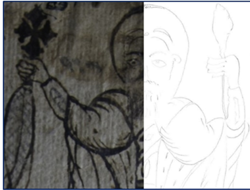
Görsel 4b. İsa figürü detay çizim (1.sayfa)