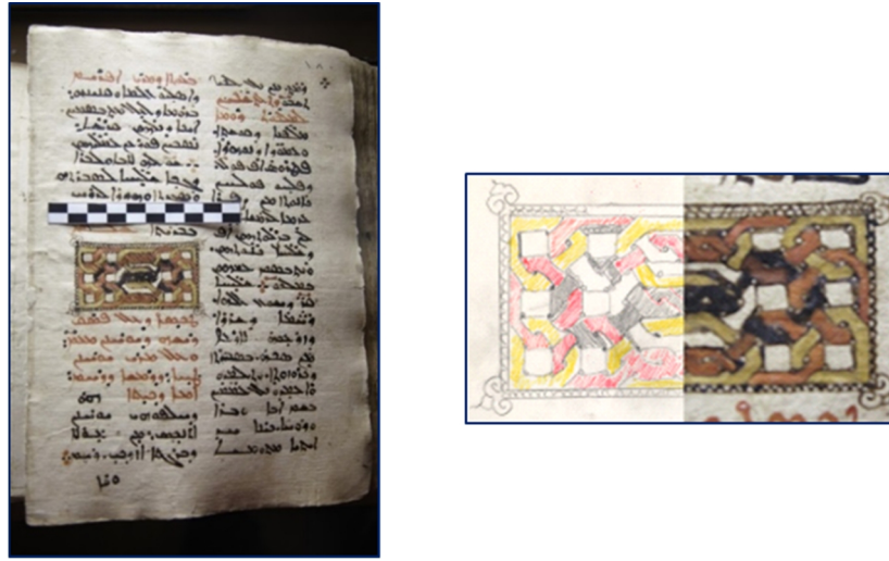
Görsel 10. Süsleme detay çizimi 6

Görsel 10'da Vaftizci Yahya'nın kafasının kesilmesi ve Mor Yuhanon Tayoyo (Arap) Hakkındaki Bölümü bulunmaktadır. Süsleme'de Kompozisyonun bütününde dikdörtgen bir çerçeve içinde merkezde dikdörtgen geniş zincir etrafında küçük kare boşluklar oluşturacak şekilde zincir geçmeler bulunmaktadır. Kırmızı, siyah ve sarı renkler ile zincir detaylar birbirlerinden ayrılmışlardır. Dikdörtgen çerçevenin sol ve sağ üst ve alt köşe kenarları tepelik tabir edilen motifler ile sonlandırılmıştır.