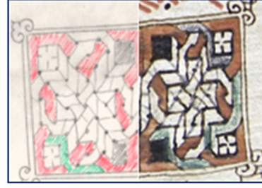
Görsel 6. Süsleme detay çizimi 2

Görsel 7'de Mecdelli Meryem Bölümü bulunmaktadır. Ferisi Simon, evinde İsa Mesih'in önünde ağlayıp tövbe ettiğini ve İsa'nın tövbesini kabul edip günahlarını bağışladığı anlatılmaktadır. Aynı zamanda anma bölümünde; Mesih'ten günahlarının bağışlanmasını, yeryüzüne barış esenlik getirmesini dilerler. Süslemesinde dikdörtgen form içinde zencereklerle birbirine bağlanmış kompozisyon ve iki artı işareti göze çarpmaktadır. Beyaz zemin üzerine içilen desen en dış kenardan birer atlamalı şekilde kırmızı ile boyanmıştır. Dikdörtgen form köşegenler ile sonlandırılmıştır.