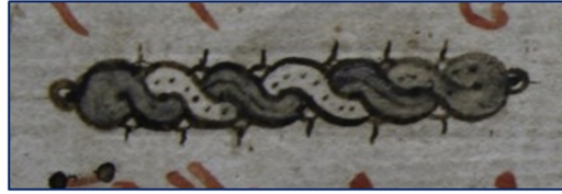
Görsel 12. Süsleme detay çizimi 8