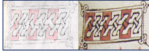
Görsel 11. Süsleme detay çizimi 7

Görsel 12’de Mor İzozel bölüm bitişi ve çile çekenlerin başı Mor Barsavmo’nun anma günü bölümü yer almaktadır. Süslemesinde ayrıç olarak sayfadaki yerini alan ve kapalı bir kompozisyon oluşturan ikili örgü motifi, siyah ve beyaz olarak renklendirilmiştir. Bu örnekte örgü motifi sayfanın sağ ortasında, düz bir şerit halinde kapalı kompozisyon oluşturmaktadır.