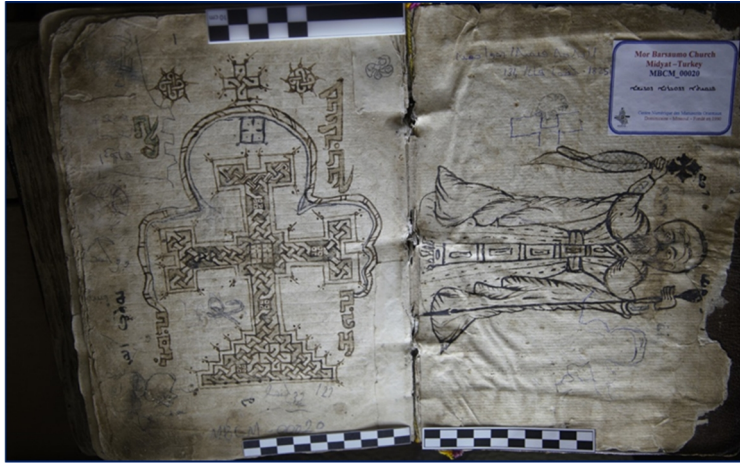
Görsel 3. Kaideli haç ve İsa minyatürlü süslemeli sayfa

Görsel 3’de Kaide üzerine oturtulmuş ve zencerceler ile çevrenilmiş içerisinde küçük geçmelerden oluşturulmuş büyük haç motifi görülmektedir. Karşısındaki sayfada sol elinde yeryüzü hâkimiyetini temsil eden asa ve sağ elinde ise göksel krallığı simgeleyen ‘haç’ı tutan İsa figürü yer almaktadır.