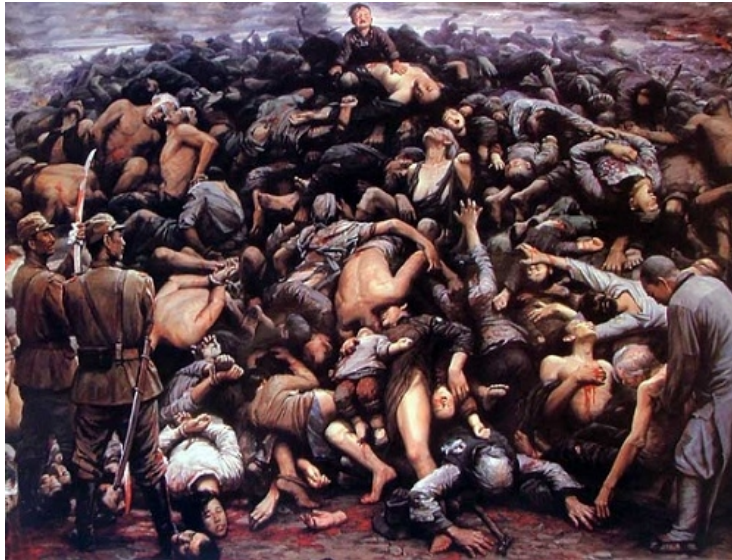
Görsel 4. Zi Jian Li, Nanjing Katliamı, 1992, 213 x 290 cm tuval üzerine yağlı boya

Savaşlar ve şiddetin çok sık yaşandığı Ortadoğu'da 1982 yılında İsrail yanlısı Hristiyan milisleri tarafından gerçekleşen ve "Sabra ve Şatilla Katliamı" olarak anılan olayda, aşırı sağcılar Filistin mülteci kampına saldırmış ve içlerinde çocukların da olduğu yüzlerce kişiyi öldürmüşlerdir. Dia al-Azzawi'nin 1982-83 yıllarında olayın ardından ürettiği "Sabra ve Şatilla Katliamı" adlı eseri, 300 x 750 cm boyutuyla, yaşanan katliamın arkasından yakılan bir ağıt gibi durmaktadır. Altı parçadan oluşan tuvalin üzerine yapıştırılmış kağıtlara tükenmez kalem, yağlı pastel boya ile oluşturulan eser, boyutu dışında da taşıdığı bağlam nedeniyle anıtsal bir değer taşımaktadır. Stilize, deforme edilmiş insan ve hayvan figürleri, bombalar ve şiddete dair diğer semboller yaşanan vahşeti açığa çıkarmaktadır. Sanatçının eseri Picasso'nun Guernica tablosuyla da paslaştığı görülmektedir. İki eser arasındaki plastik benzeşmenin dışında, şiddet ve vahşet görüntüsünde de benzerlikler bulunmaktadır. Bununla birlikte sanatçının eseri üretmeye iten gücü anlamada, Tate Modern küratörüne yaptığı açıklamada net bir şekilde ortaya koymaktadır: