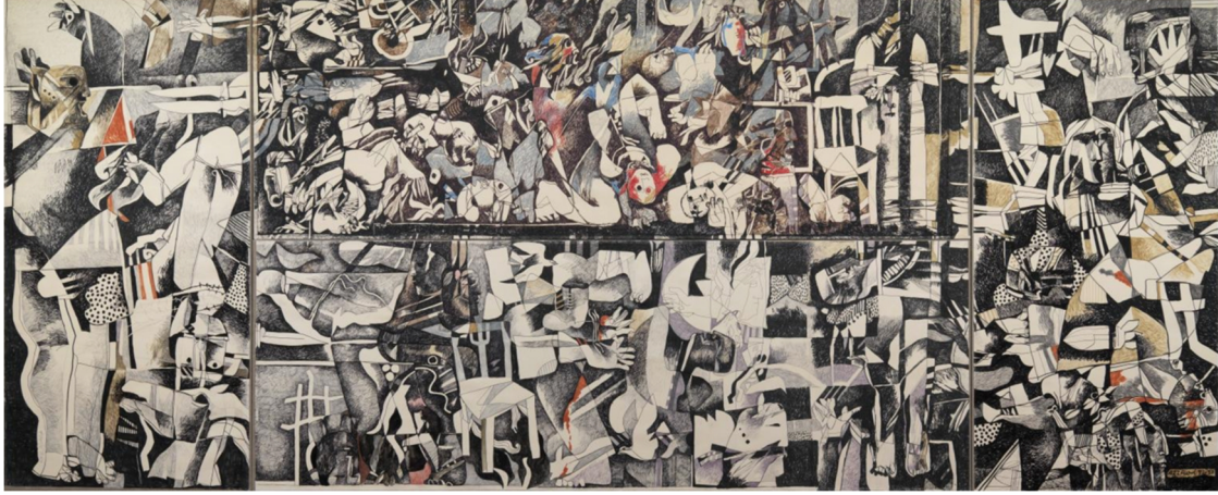
Görsel 5. Dia al-Azzawi, Sabra ve Şatilla Katliamı, 1982-1983, 300 x 750 cm, tuval üzerine karışık teknik

Sanatçının Genet'in yazısından etkilenecek başladığı çalışması yaşanan vahşeti açığa çıkarmaktadır. Bir köşeden bomba bırakarak gelen uçak, dikenli teller, öylece duran sandalyeler, resmin nerede başladığı ve nerede bittiğinin belirsizliği ile tuvalin içine ve karanlığına gömülmüş figürler, bir tür labirente hapsolmuş gibidir.