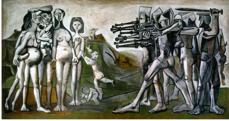
Görsel 3. Pablo Picasso, Kore Katliamı 1951, 1951, 1.1 x 2.1 m. tuval üzerine yağlı boya