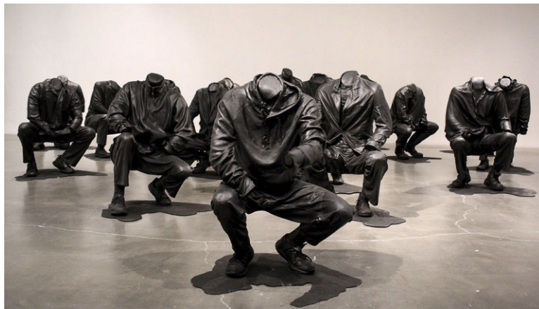
Görsel 7. Haroon Gunn “Senzenina”, 2018, enstalasyon.