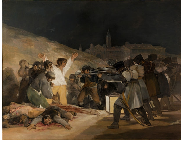
Görsel 1. Francisco Goya, Üç Mayıs Katliamı, 1814, 2.68 x 3.47 m. tuval üzerine yağlı boya.