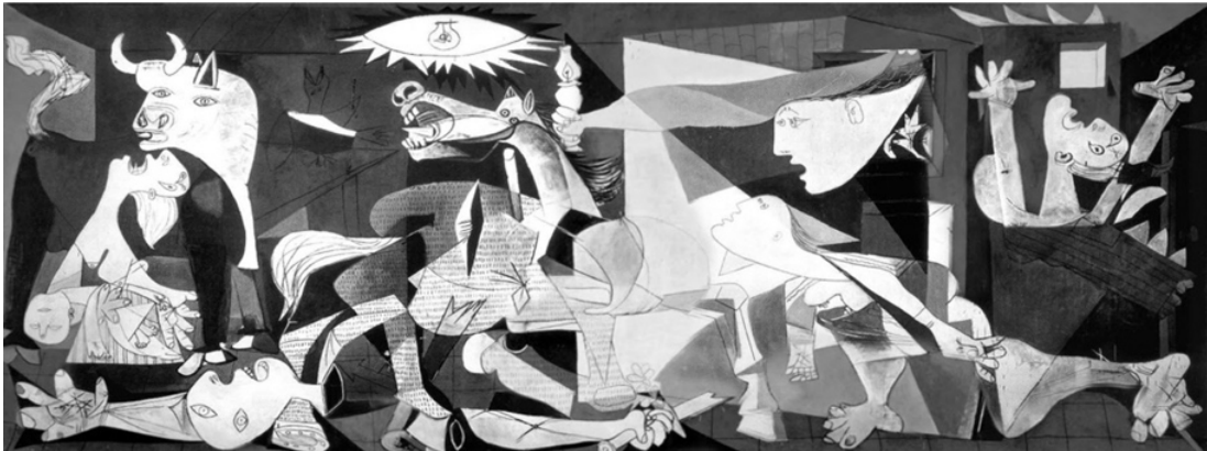
Görsel 2. Pablo Picasso, Guernica, 1937, 3.49 x 7.77 m. tuval üzerine yağlı boya

Bellek, geçmişten gelen birikimlerin diğer kuşaklara aktarılmasıyla anlam kazanır. Geçmişle gelecek arasındaki köprü olan ve şimdinin içinde yaşadığı yer bellektir. Bellek sadece zihinsel bir işlev olmaktan ziyade içinde yaşadığımız şu anda bulunmaktadır. Bellek, bir kişinin münferit olarak hatırlayabildiği anıların yaşadığı zihinsel bir ambar olarak görülebilir. Aynı şekilde toplumların da geçmişlerinde önemli rol oynayan tarihsel, sosyal, kültürel, ekonomik vs. olayların kolektif bir bellek etrafından yeniden zuhur etmesiyle toplumsal bellekten söz etme ihtiyacı doğar (Atik ve Bilginer Erdoğan, 2014, s. 2).