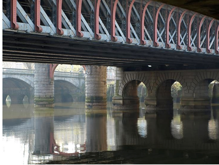
Resim 1. Susan Philipsz, "Lowlands", 2010

Philipsz bir halk şarkısından esinlendiği bu eserini İskoçya'da yaşadığı tesadüfi bir karşılaşmanın ardından hayata geçirmiştir. Sanatçı Lowlands adlı bu ses enstalasyonu İskoçya'nın Glasgow kentindeki Clyde nehri üzerinde yer alan üç köprüünün altına yerleştirmiştir. Bu köprüler sırasıyla Caledonian Köprüsü, Glasgow Köprüsü ve George V köprüsüdür. Philipsz Lowlands için neden özellikle bu köprüleri tercih ettiğini şu sözleriyle ifade eder: "Caledonian köprüsü üzerinde yürüyüş yaptığım sırada yere bırakılmış bir demet çiçeğe takılarak tökezledim, daha sonra çiçeklerin köprüden atlayarak intihar eden bir genç için bırakıldığını öğrendim" (Amar, 2010). Lowlands Away 'in boğularak ölen bir kişiyle ilişkili olması ve üzerinde tren istasyonu bulunan bu köprüünün oldukça aktif bir kamusal alan olması sebebiyle Philipsz enstalasyonunu Caledonian ve devamındaki iki köprüünün altına da yerleştirmeye karar verdiğini ifade etmiştir.