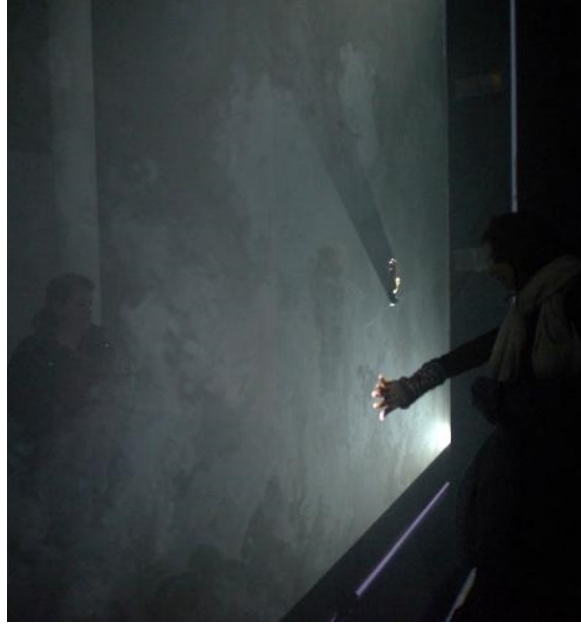
Resim 2. Anke Eckardt, "Between You and Me", 2011

Eckardt bu yerleştirmesiyle mekânda bir duvar inşa etmiştir. Bu duvarla etkileşime girildiğinde işitilen kırılma sesi, gerçek bir duvarın katılığı ve geçirimsizliğine karşın kolaylıkla aşılabilen, dayanıksız ve geçirgen bir yapıdadır. Bu ses yerleştirmesi izleyicisini duvarın dışına çıkmaya davet ederken ötekiyle aramıza çekilen sınırları kaldırmamızı ve empatiyle dinlemenin önemini vurgulamaktadır. Eckardt katılımcı politikaların geliştirilmesi ve demokratik toplum anlayışının yerleştirilmesini önerirken, görmezden gelinen ve yalnız bırakılmış toplumsal gruplara olan bakışımızı, bu sınırı yaratan mekanizma ve aygıtları kullanarak eleştirmektedir.