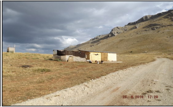
Resim 8: Tahta Kulübe ve Ağıl, Çayır Yaylası Altınyayla Ballık Güzergâhı. Aksu.

Çayır yaylasında hayvancılık yapan Yörükler yaylada çadır ya da barakalarda yaşamada ortaya çıkan barınma güçlüğüne “yurtlarına” iki odalı; duvarı taş, tuğla ya da briketten üzeri saç kaplamalı sabit evler yaparak barınma koşullarını iyileştirmişlerdir.