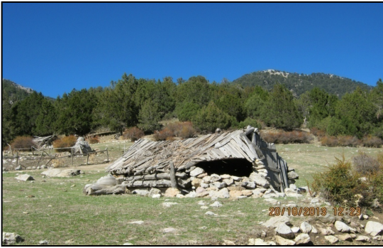
Resim 7: Taş Tabanlı Ahşap Baraka,

Yarı konargöçer Yörükler günümüzün ulaşım ve iletişim imkânlarının yarattığı koşullar nedeniyle yaylalarda çok uzun süre kalmadıkları için yaylak meskenlerine de eskisi kadar özen göstermemektedirler (Bkz. Resim:6,7). Yarı konargöçerler konargöçerlikten farklı olarak çoğunlukla köyleri ile ortalama her gün iletişim halindedirler. Komşular arasında iş bölümü ve yardımlaşma yaparak hayvanlarının otlatılmasını sağlamakta aynı zamanda köylerindeki tarımsal faaliyetlerini ya da diğer işlerini de aksatmadan sürdürmektedirler. Her sabah erkenden hayvanlarını, otlatmak için meralara sürdükten sonra komşu dayanışması yaparak patpat, traktör veya taksi ile köylerine giderler. İkinci sonrasına kadar köydeki evlerinde ya da bahçelerinde çalışırlar, hayvanlar yaylımdan gelmeden önce tekrar toplanırlar ve yaylalarına geri dönerler.