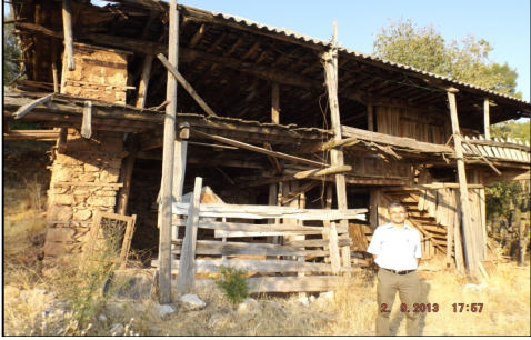
Resim 11: Bucak Kızıllı Köyünde 1900'lerin başında yapılan toprak damlı ev 11