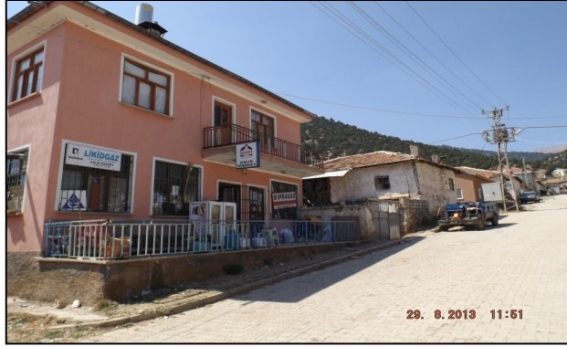
Resim 13: Gedikli Köyü Sokak Görünümü, Eski ve Yeni Evler

Köyde yaşayan Yörüklerin yerleştikleri coğrafi koşullara göre kerpiç, taş ya da betonarme ev yaptıkları görülmüştür. Kerpiç evlere, Sarıkaya, Yeniköy, Kökez, Büyüksöğle, Esenyurtta rastlanırken, kâgir evlerin (yığma taş ya da tuğladan yapılan) Yörüklerin yerleşik hayata geçtiklerinde -çoğunlukla o günkü imkânlarla istinaden- kâgir ev yaptıkları; daha sonraları ise artan ekonomik refah ve teknolojik imkânlarla istinaden betonarme evlere doğru bir geçişin olduğu görülmektedir.