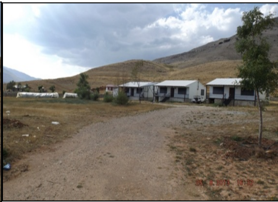
Resim 10: Yaylalama Amaçlı Yapılan Kalıcı Konutlar, Çayır Yaylası Aksu (Anamas)