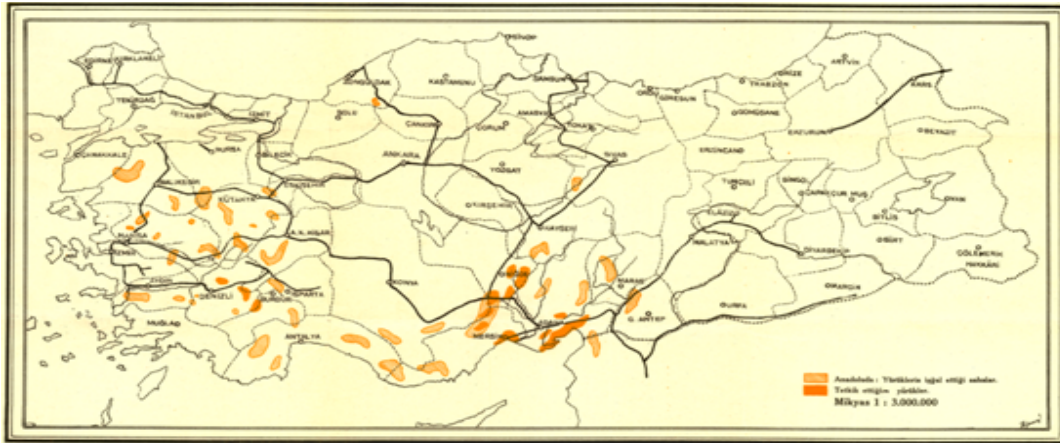
Harita 1: Anadolu'da Yaşayan Yörüklerin Yaşam Sahaları

Ülkemizde 1940'lı yıllara gelindiğinde güney Akdeniz bölgesinde yaşayan konargöçer Yörüklerin etno-antropolojik tetkikiyle ilgili ilk çalışma Kemal Güngör tarafından yapılmıştır (Bkz. Harita 1). Güngör yapmış olduğu bu çalışmada aynı zamanda Anadolu'da o dönem konargöçer yaşam süren Yörüklerin de bir haritasını çıkartmıştır. Bu haritada da görüldüğü gibi Yörükler bu yıllarda da, Anadolu'ya ilk gelişlerinden itibaren yaşamaya başladıkları yerlerde meskûn haldedirler. Genel olarak Kızılırmak'ın batısı olarak betimlenen bu bölge, Akdeniz ve Ege boyunca uzanan ve Toros sıra dağlarıyla sınırlanan kıyı şeridi üzerinde bulunmaktadır.