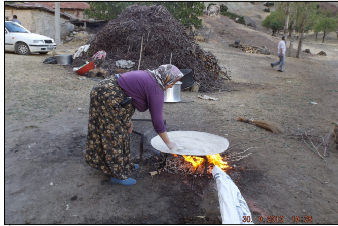
Resim 16: Günlük İşlerini Yaparken Bile Cep Telefonunu Yanından Ayrılmayan Yörük Kadını Pekmez Kaynatırken, Yukarıtirtar Köyü Yalvaç.

Kırsal yaşam sürenler ile şehirde yaşayan Yörüklerin tamamı TV, Uydu Alıcı, Buzdolabı, Oturma odası mobilyası kullanmaktadır (%100). Kırsal yaşam sürenlerde en çok kullanılan diğer eşyalar Çamaşır Makinesi (%97,8), Gün Isı (%85,6) ve Cep Telefonu (%81,1) Ütü (%66,70), Fırın (%63,3), Elektrikli Süpürge (%61,1) Derin Dondurucu (%31,1) Ev Telefonu (%26,7) Klima (%21,1) Bilgisayar (%21,1) Dikiş Makinesi (%20) Bulaşık Makinesi (%18,9) Saç Kurutma Makinesi (%16,7) İnternet (%14,4) Fotoğraf Makinesidir (%13,3). Köyde en az kullanılan yemek odası takımı (%1,1) iken hiç kullanılmayan mikrodalga fırındır. Kırsal yaşam sürenlerin 1/5’inde bilgisayar varken (%21,1), internete sahip olanların oranı %14,4’tür.