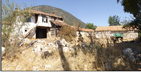
Resim 12: Gedikli Köyünde Yerleşik Hayata Geçişte İlk Yapılan Kiremit Çatılı Ev, Yapım Yılı: 1952 12