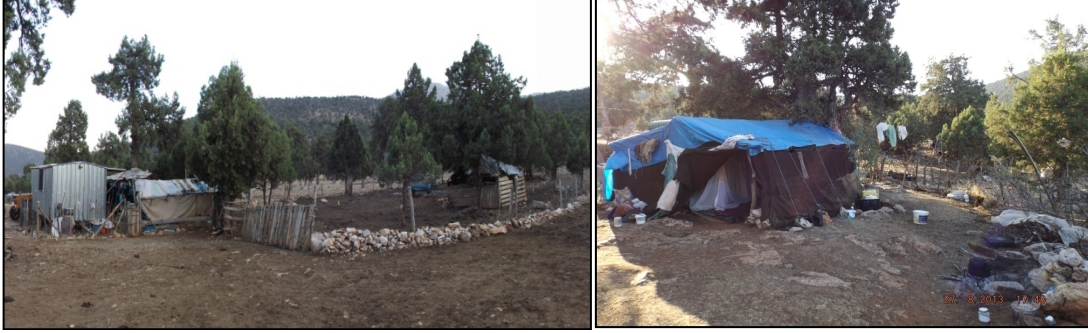
Resim 5-6: Galvaniz Saçtan Isı Yalıtımlı Karavan ve Ağıl. Naylon Branda Kaplamalı Karaçadır ve Ağıl. Şarkıkaraağaç Gedikli Köyü Küre Mevkii.

Yarı konargöçer Yörükler günümüzün ulaşım ve iletişim imkânlarının yarattığı koşullar nedeniyle yaylalarda çok uzun süre kalmadıkları için yaylak meskenlerine de eskisi kadar özen göstermemektedirler (Bkz. Resim:6,7). Yarı konargöçerler konargöçerlikten farklı olarak çoğunlukla köyleri ile ortalama her gün iletişim halindedirler. Komşular arasında iş bölümü ve yardımlaşma yaparak hayvanlarının otlatılmasını sağlamakta aynı zamanda köylerindeki tarımsal faaliyetlerini ya da diğer işlerini de aksatmadan sürdürmektedirler. Her sabah erkenden hayvanlarını, otlatmak için meralara sürdükten sonra komşu dayanışması yaparak patpat, traktör veya taksi ile köylerine giderler. İkinci sonrasına kadar köydeki evlerinde ya da bahçelerinde çalışırlar, hayvanlar yaylımdan gelmeden önce tekrar toplanırlar ve yaylalarına geri dönerler.