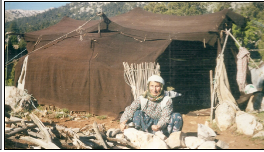
Resim 4: Honamlı Yörükleri

(Ata Balık'ın Çadırı, Çayır Yaylası Aksu, 2013) (Emine Karasu, Gedikli Sindel Yaylası, 2003)