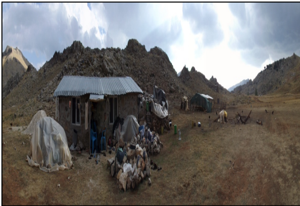
Resim 9: Taş Kulübe ve Ağıl,

Çayır yaylasında hayvancılık yapan Yörükler yaylada çadır ya da barakalarda yaşamada ortaya çıkan barınma güçlüğüne “yurtlarına” iki odalı; duvarı taş, tuğla ya da briketten üzeri saç kaplamalı sabit evler yaparak barınma koşullarını iyileştirmişlerdir.