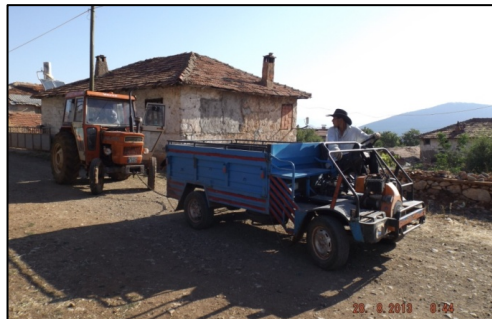
Resim 14-15: Kabinli ve Kabinsiz Patpatlar, Gedikli Köyü Şarkıkaraağaç.

Bu aracın en önemli özellikleri az yakıt yakması, bakım masrafının az olması, kolay tamir edilmesi, ulaşım, yük taşıma, ilaçlama, odun kesme, tarla/bahçe sulama gibi işlevleri kırsal yaşamda köylünün ihtiyacına yönelik olarak karşılamasıdır. Patpatlar modernleşen Yörüklerin geleneksel yaşamda ulaşım ve bitkisel üretimde kullandıkları at ve eşeğin yerini almıştır. Adeta onların modern eşekleri olmuştur (Öter, 2018).