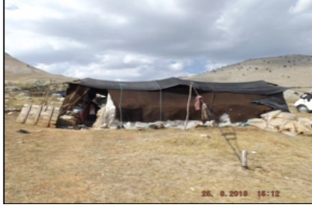
Resim 3: Karakoyunlu Yörükleri

Aşağıdaki resimlerde Honamlı ve Karakoyunlu Yörük aşiretlerince kullanılan kara çadır örnekleri yer almaktadır.