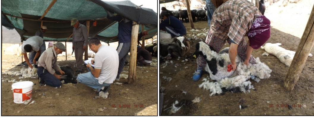
Resim 1-2: Koyun Kırkımı ve Yardımlaşma, Çayır Yaylası Aksu (Anamas)

Köyde ve yarı konargöçer yaşayanlar para ihtiyacı olduğunda ilk önce akrabalarına müracaat etmektedir (%86,7), daha sonra bankaya (%25,6), komşularına (%18,9), arkadaşlarına (%15,6) müracaat ederek parasal ihtiyacına çözüm getirmektedir. Antalya Kumluca Ereentepe (eski adı Buldur ) Mahallesinde yaşayan Yeniosmanlı Yörüğü 1930 doğumlu O. K. para ihtiyacı olduğunda kimlere müracaat edersiniz sorusuna “Kanaat ettim kimseden istemedim” demiştir. 10 O. K. yaşadığı yerde kendi aşiretinden kimse olmadığından olsa gerek kanaat/idare etmiş hiç kimseden borç para istememiştir. Bu tür örnekler bize Yörükler arasında bir “kanaat/idare kültürünün” olduğunu göstermektedir.