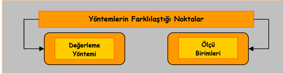
Şekil 1. Yöntemlerin Farklılaştığı Noktalar

Enflasyon düzeltmesi; paranın değerinin değişmediği varsayımı altında, geleneksel değerlendirme ölçülerine göre mali tablolarda yer alan kalemlerin uygun değerlendirme ölçüleri (katsayıları) ile düzeltilmesi işlemi olarak tanımlanabilir(Karapınar, 2004:270). Bu düzeltme işleminde kalemlerin hangi değerlendirme ilkesine göre düzeltildiği ve hangi ölçü birimlerinin baz alındığı; kullanılan yöntem adı vermektedir. Başka bir ifadeyle, kullanılacak düzeltme yöntemlerinin birbirinden farklılaştığı noktalar şunlar olmaktadır: