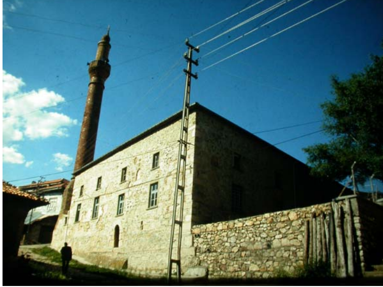
Resim 10. Barla Çaşnigir/ Ulu Camii, batı cephe.