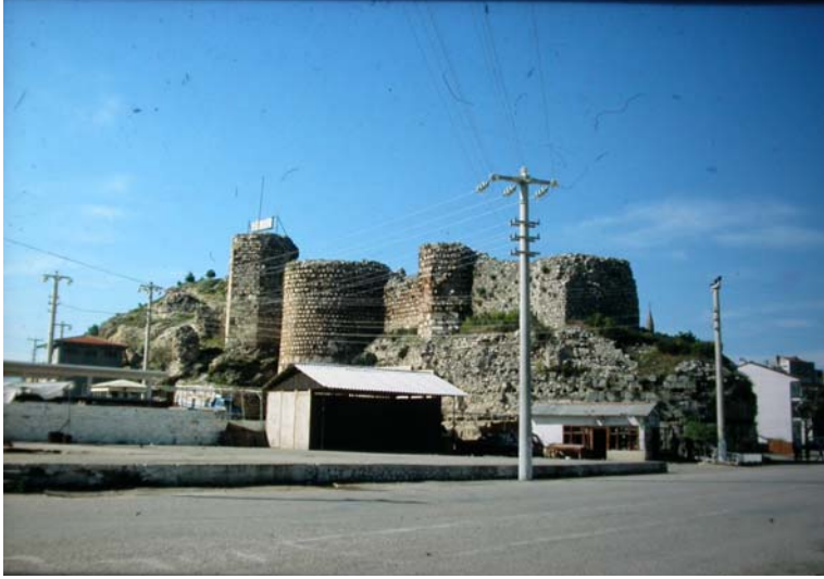
Resim 2. Eğirdir Kalesi, genel görünüm.