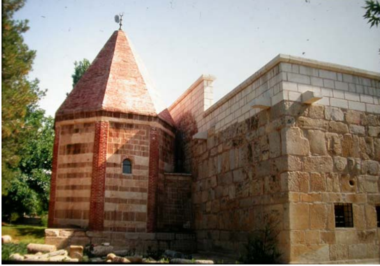
Resim 4. Atabey Ertokuş Medresesi-Türbe, batıdan görünüm.