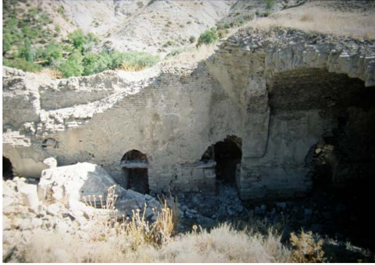
Resim 9. Uluborlu Gargılı Lala/ Taş Medrese, avlu.