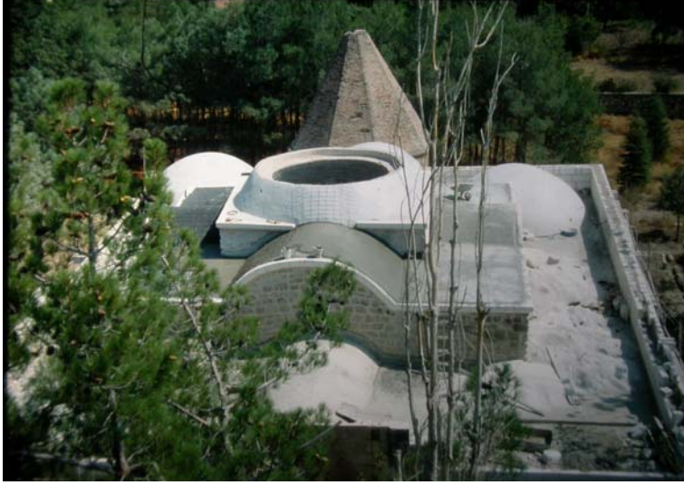
Resim 3. Atabey Ertokuş Medresesi, üstten görünüm.