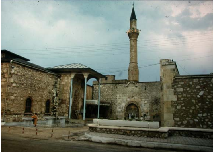
Resim 7. Eğirdir DüNDAR Bey Medresesi- Hızır Bey Camii.