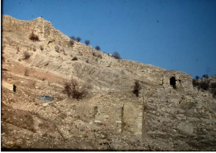
Resim 1. Uluborlu Kalesi, genel görünüm.