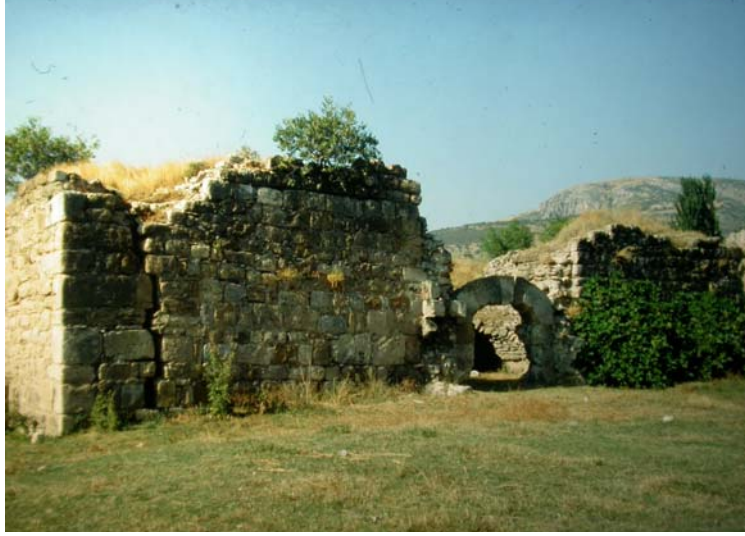
Resim 5. Gelendost Ertokuş Han, güney cephe.