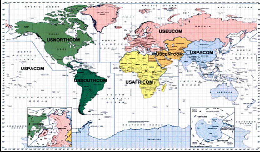
Harita-1: ABD Coğrafi Muharip Komutanlıklarının Sorumluluk Sahaları 16

sorumluluk sahası Orta Doğu ve Orta Asya'da 20 ülkeyi kapsamakta; USPACOM ise Çin, Hindistan ve Japonya dâhil 36 ülkeden sorumlu tutulmaktadır. ABD coğrafi muharip komutanlıklarının en yenisi olan USAFRICOM, Afrika'da 54 ülkeden sorumludur.