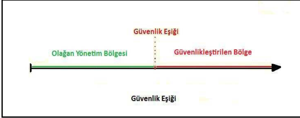
Şekil 2. Güvenlik eşiği

Güvenlik eşiği, beliren olumsuz bir olay veya olgu için tahammül gösterilebilecek son seviyedir (Şekil 2). Bu seviye geçildikten sonra olay güvenleştirilerek alınan önlemler sayesinde güvenlik eşiğinin altına yani katlanabilir seviyenin altına düşürülmesine çalışılır. Bir başka ifade ile bir olayın güvenleştirilmesinden kasıt, tahammül edilemeyecek seviyeye gelen olay veya olgunun tekrardan tahammül edilebilir bir seviyeye getirilmesini sağlamaktır. Güvenleştirilen konular, bünyenin gücü oranında iki kategoriye ayrılır. Bunlardan birincisi güvenlik riski ikincisi tehdittir (Şekil 3). Söz konusu olay veya olgu, tarafımızdan yönlendirilebilir durumda ise güvenlik riski; yönlendirilemez durumda ise ve tedbir alınmayı gerektiriyorsa tehdit aşamasında olduğu kabul edilir.