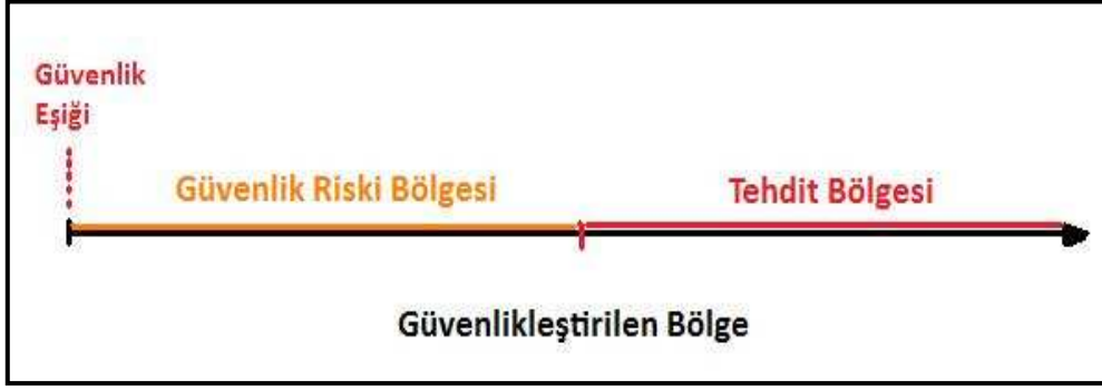
Şekil 3. Güvenlik riski ve tehdit.

Güvenlik riski aşamasının, tehdit aşamasına göre daha hafif koşulları içermesi gerekir. Her şeyden önce, güvenlik riski aşaması, normal hukuk kuralları içerisinde yürütülürken, tehdit aşaması, ilave hukuksal kararların ve tedbirlerin alınmasını gerektirir. Örneğin, Yunanistan'ın Ege Denizi'nde karasularını 6 deniz milinden 12 deniz miline çıkarması durumunda, Türkiye Büyük Millet Meclisi, 08 Haziran 1995 tarihinde, Türkiye Cumhuriyeti Hükümetine, askeri bakımdan gerekli görülecek olanlar da dahil olmak üzere tüm yetkilerin verilmesi kararını almıştır. Yunanistan'ın, Deniz Hukuku Sözleşmesinin açık denizler ve okyanuslar için belirlenmiş bazı hükümlerinden yararlanarak karasularını 12 deniz miline çıkarma isteği ile başlayan güvenlik riski, bir tehdit haline gelince TBMM karar almıştır. Bir başka örnek, PKK terörüne ilişkin çıkartılan ilave kanunlar ve kanun hükmündeki kararnameler olabilir. PKK terörüne karşı alınan önlemler yeterli olmadığı için olağan dışı hukuk tedbirleri alınarak terörle mücadele, tehdit bölgesine taşınmıştır. Oysa güvenlik riskinin yönetimi için böyle ilave bir hukuka ihtiyaç duyulmayacaktır.