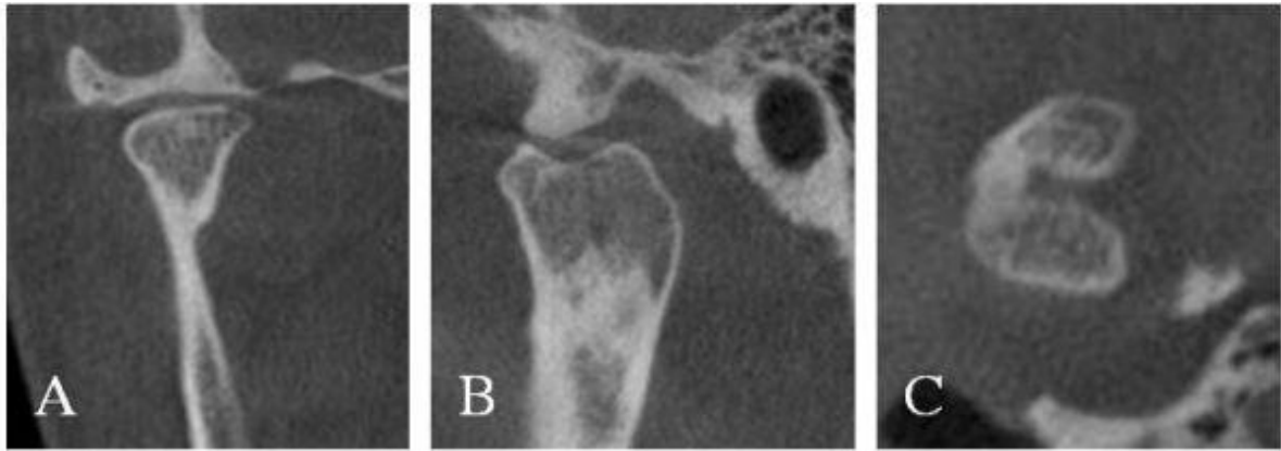
Resim 2. A. Koronal, B. Sagital, C. Aksiyal kesitlerdeki KIBT görüntüleri ile ML oryantasyonlu BMK