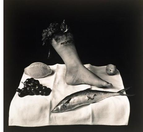
Resim 3: Joel Peter Witkin, Stil Life with Mirror, 2003, http://www.orderofthegooddeath.com/after-joel-peter-witkin/ (Erişim Tarihi: 04.11.2019)

Bir diğer dikkat çekici ölü doğa tasviri Aynalı Natürmort (Resim 3) ise izleyicisini daha açık bir ürperticilik ile karşı karşıya getirmektedir. Gümüş baskı fotoğraf ta beyaz bir kaidenin üzerine yerleştirilmiş olan kopmuş bir ayak, üzerine saplanmış 6 adet çivi, canlıymış gibi duran ve ayağın hemen yanında duran siyah bir kelebek, bir demet kuşkonmaz, ayağın hemen arkasındaki belli belirsiz ayna ve arka plandaki çiçekli kumaş perdeden oluşan kompozisyon üzerine çizgisel müdahaleler yapılmıştır.