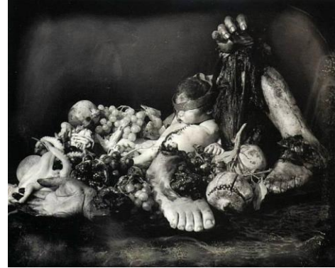
Resim 6: Joel Peter Witkin, Aptalların Bayramı, 1990, Foto gravür, 28 x 34.2 cm, http://www.orderofthegooddeath.com/after-joel-peter-witkin (Erişim Tarihi: 04.11.2019)