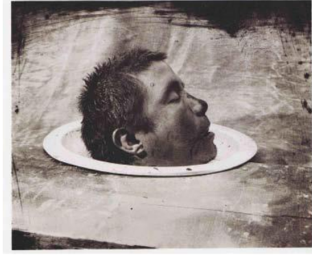
Resim 5: Joel Peter Witkin, Ölü Adamın Kafası, 1990, http://www.artnet.com/artists/joel-peter-witkin/head-of-a-dead-man-mexico-7OUh4rdMhp1r5kEg4_JiMw2 (Erişim Tarihi: 04.11.2019)