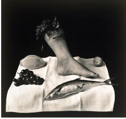
Resim 4: Joel Peter Witkin, Natürmort Meksika, 1984, Etherton Galerisi, http://www.artnet.com/artists/joel-peter-witkin/still-life-mexico-ROKl2BDVYZTnAaVCe0czgA2 (Erişim Tarihi: 04.11.2019)

Bakmamız gereken bir diğer kompozisyon yine kopmuş bir ayak ile oluşturulmuş Meksika (Resim 4) adlı ölü doğasıdır.