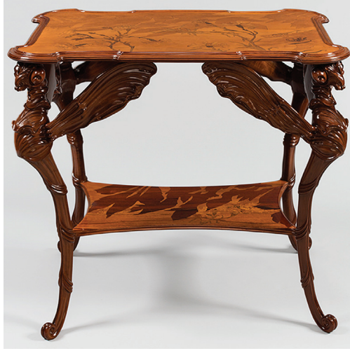
Görsel 11: Yusufluk Masa, 1900 civarı, Galle imzalı. (Macklowe Gallery, 2019)