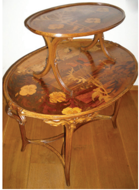
Görsel 6: Emile Galle imzalı sanatçının erken dönemine ait haşhaş bitkisinin bezeme olarak kullanıldığı masa (Gallery TinyEsveld, 2019)

sanatçının en güzel örneklerinden birisidir. Oldukça özgün eserler üreten Emile Gallé çok pahalı olmayan herkesin ulaşabileceği mobilyalar yapmayı tercih ettiğinden daha küçük boyutlu, seri mobilyalar da üretir. Yalıçapkını dolap, yusufçuk masa, kurbağa ayaklı lady masa, kelebekli büfe, müzik dolapları bu dönem mobilyaları arasındadır. Ölümünden hemen önce tasarladığı son işi ise hiç kuşkusuz en önemli eseridir. Gül, abanoz, sedef ve camı birlikte kullandığı Şafak ve Alacakaranlıkta adını verdiği bu eser, bir yatak ile beraber bir komodin, bir dolap, iki sandalye ve bir vitrinden oluşur. 29 Yaşam ve ölümü temsil eden bu eserinde figürlü sahne şafağı, yumurtanın üzerinde duran iki kelebek ise yaşamı ve doğumu simgeler. (Görsel 7-11)