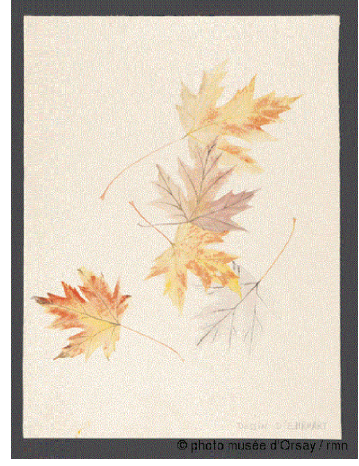
Görsel 2-3: d’Orsay Müzesi Koleksiyonunda yer alan Emile Gallé’nin çizimlerinden örnekler (d’Orsay Müzesi, 2018)

tekniklerini geliştirir. Üst üste yapıştırılmış cam levhalara kazıma ya da kabartma (cameo) tekniklerini uygular. Cameo değişik renklerde cam tabakasının üflenerek cam yüzeye tutturulması ve daha sonra tıraşlanmasıdır. Opak görünümlü bu eserlerinde sanatçı tarihsel konulardan uzaklaşır, bitkisel motifleri ve hayvan figürlerini kullanır. Söz konusu eserleri ile 1889 Paris Sergisi’nden büyük ödülün (Grand Prix), sahibi olarak ayrılır. Ayrıca bu sergiye camları haricinde seramik ve mobilyaları (çalışma masası, yabancı kiraz motifli yan sandalyesi ve satranç masası) ile katılmıştır. Seramikleriyle altın, mobilyaları ile de gümüş madalya alır. 1889 Sergisi Gallé’nin uluslararası ün kazanmasına vesile olur.