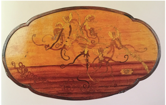
Görsel 9-10: 1898 yılına tarihlenen masa tablası üzerindeki bitkisel bezeme motifi ve sanatçının imzası. Berlin Ulusal Sanat ve Zanaat Müzesi Koleksiyonu (E. Gallé, 2014, 188-189)