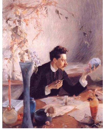
Görsel 1: Victor Prouvé, Emile Galle'nin Portesi, 1892, Ecole de Nancy Müzesi, (Filidis, 2015, 19)

Daha çok cam işçiliğinde çalışan ve uyguladığı teknikler ile bir çıkır açan Gallé'nin er-