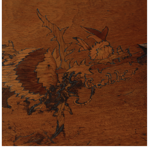
Görsel 13 a-b: Etajer ve “gallé” imza detayı, Milli Saraylar Koleksiyonu, (Baytar, 2012, 230)

Sanatçıya ait diğer eser ise 91x56x76 cm. boyutlarında bir etajerdir. Ahşap üzeri marküteri işçilikte olup kıvrımlı dört ayaklı, dikdörtgen formlu ve çift tablalıdır. Üst ve alt tablanın her iki yan kenarı dilimlidir. Tabla üstleri marküteri teknikte bitkisel formlarla bezelidir. Eserin üst tablasında gallé ' imzası yer alır. (Görsel 13a-b)