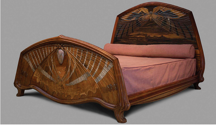
Görsel 7-8: Şafak ve Alacakaranlıkta adlı eser.