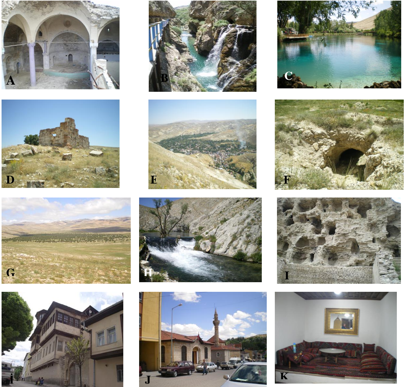
Şekil 2. A: Ermenilerden kalma olduğu bilinen Gürün kilisesi, B: Şuğul kanyonu, C: Gökpınar gölü, D: Burçevi mahallesinde Roma döneminden kaldığı düşünülen anıt mezar E: Gürün'e panoromik bir noktadan bakış, F:Bozhüyük köyündeki höyükler, G: Camiliyurt köyündeki orman kalıntıları, H: Akdere Çayı, I: İlçe merkezindeki mağaralar, İ: İlçe merkezindeki tarihi konaklar, J: Tarihi ulu cami ve eski halk kütüphanesi binası, K: Halı ve kilim dokumacılığının yaygın olduğu bölgede kilimlerle döşeli bir oturma alanı