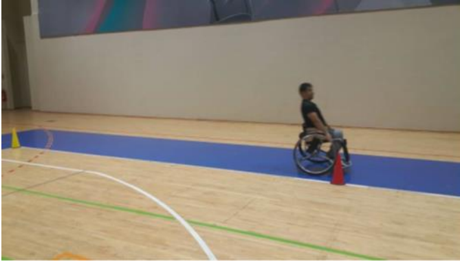
Şekil 1. 5 metre sprint testi

5 metre sprint testi: Sporcular tekerlekli sandalyenin ön barı başlangıç çizgisinin arkasında olacak şekilde pozisyonlandıktan sonra verilen uyarı ile 5 metrelik mesafeyi olabildiğince hızlı kat etmeleri istendi. Süre sandalyenin ön barının başlangıç çizgisini geçmesiyle başladı ve bitiş çizgisini geçmesiyle sonlandı. Test üç kere tekrarlandı ve üç değer ortalaması sonuç olarak kaydedildi. Değerlendirmeler arasında 2 dakika dinlenme arası verildi. Test edilen alan sporcuların başlangıç süratleridir (De Groot ve diğ., 2012) (Şekil 1).