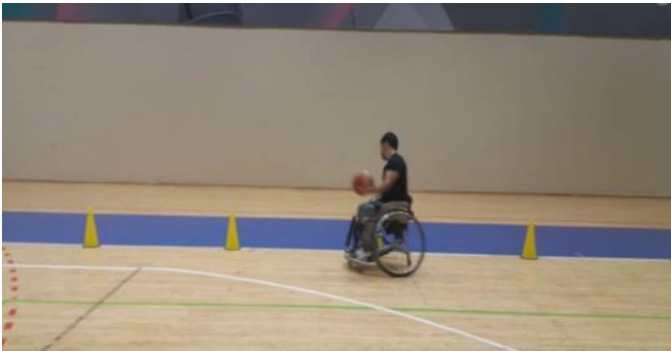
Şekil 4. Topla slalom testi

Topla slalom testi: Sporcular tekerlekli sandalyenin ön barı başlangıç/bitiş çizgisinin gerisinde olacak şekilde pozisyonlandı. Başlangıç komutu verilmesiyle sporcular konilerin arasından TS Basketbol oyun kurallarına uygun top sürerek slalom yaptı ve son koniden dönüp slaloma devam etti ve bitiş çizgisine mümkün olan en kısa zamanda ulaşmak hedeflendi. Koniler arasında 1.5 metre mesafe bulunmaktadır ve toplam koni sayısı 5'tir. Testi bitirme süreleri saniye cinsinden kaydedildi. Değerlendirilen beceriler tekerlekli sandalye kullanma becerisi ve top sürmedir (Molik ve diğ., 2010) (Şekil 4).