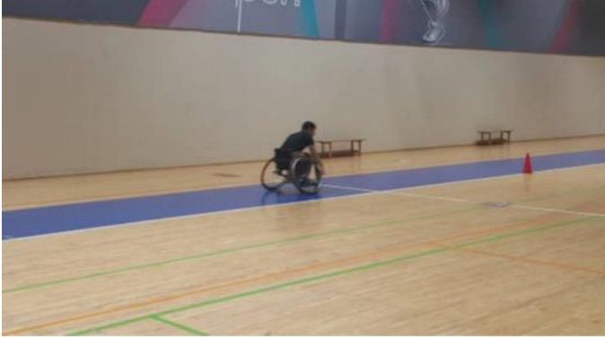
Şekil 2. 20 metre sprint testi

Slalom testi: Sporcular tekerlekli sandalyenin ön barı başlangıç/bitiş çizgisinin gerisinde olacak şekilde pozisyonlandıktan sonra mümkün olduğunca hızlı önce düz şekilde daha sonra aralarında 1.5 metrelik mesafe olan 5 koni etrafında slalom yaparak ilerledikten sonra son koni etrafından dönerek slaloma devam etti ve bitiş çizgisine geldi. Testi bitirme süreleri saniye cinsinden kaydedildi. Test edilen beceriler hız ve çabukluktur (Molik ve diğ., 2010) (Şekil 3).