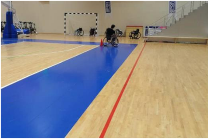
Şekil 6. Aerobik kapasite

Aerobik kapasite: 6 Dakika Dayanıklılık Yarış testi ile ölçüldü. Oyuncular tekerlekli sandalyenin ön barı başlangıç çizgisinin arkasında olacak şekilde pozisyonlandı. Başlangıç komutu ile oyuncular tam saha tur atmaya başladı ve altı dakika sonunda verilen komutla oldukları yerde durdu. Kat edilen mesafe metre cinsinden kaydedildi (Ergun ve diğ., 2008) (Şekil 6).