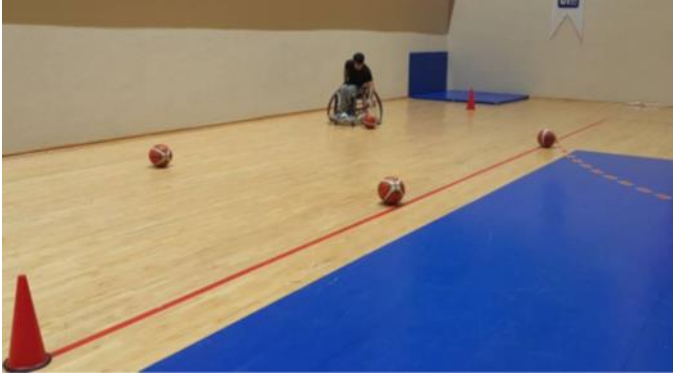
Şekil 5. Top toplama testi

Top toplama testi: Başlangıç pozisyonundan 4 metre ileriye birinci top, bu topun 6 metre ilerisine ikinci top, birinci topun 3 metre soluna üçüncü top ve ikinci topun da 3 metre soluna dördüncü top yerleştirilir, dördüncü topun 3 metre ilerisi testin bitiş noktasıdır. Sporcu sabit bir konumdan tekerlekli sandalyeyi itmeye başladı ve zemindeki toplam dört topu sol ve sağ eliyle sırasıyla toplam ikişer kez aldı. Top alındıktan sonra dizlerin üzerine koyuldu ve topu atmadan önce bir kez sandalye itildi. Testi tamamlamak için gereken toplam süre saniye cinsinden kaydedildi. Test edilen alan top taşıma ve hızdır. Sporcuların çevikliklerini değerlendirmek amacıyla uygulandı (De Groot ve diğ., 2012) (Şekil 5).