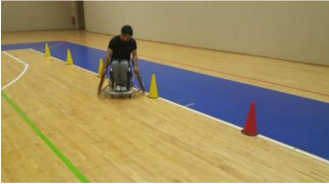
Şekil 3. Slalom testi

Slalom testi: Sporcular tekerlekli sandalyenin ön barı başlangıç/bitiş çizgisinin gerisinde olacak şekilde pozisyonlandıktan sonra mümkün olduğunca hızlı önce düz şekilde daha sonra aralarında 1.5 metrelik mesafe olan 5 koni etrafında slalom yaparak ilerledikten sonra son koni etrafından dönerek slaloma devam etti ve bitiş çizgisine geldi. Testi bitirme süreleri saniye cinsinden kaydedildi. Test edilen beceriler hız ve çabukluktur (Molik ve diğ., 2010) (Şekil 3).