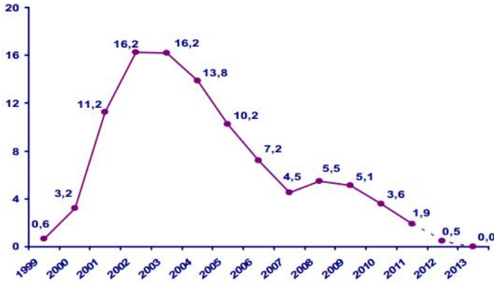
Şekil 1. Uluslararası Para Fonu'na Olan Borç Stoku (Milyar SDR)