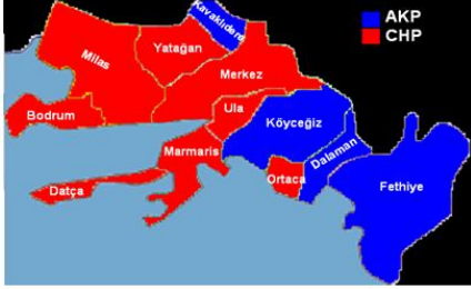
Grafik 4. Muğla İlinde İlçe Düzeyinde 2011 Milletvekili Genel Seçimleri Sonuçlarına Göre Birinci Partiler

2010 referandumuna gelindiğinde ise, 2007 referandumuna göre daha belirgin bir sonuç ortaya çıkmış ve Muğla il genelinde referandumla önerilen değişikliklere hayır oyu verenler % 69 düzeyindeyken evet oyları % 31'de kalmıştır. Bu referandumda ilçe düzeyinde Muğla iline bakıldığında Kavaklıdere ilçesi dışındaki tüm ilçeler referandumla önerilen değişiklik paketine