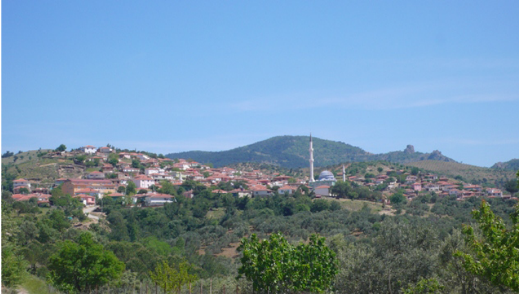
Foto 1. Hacıhüseyinler Köyü

Bu çalışmanın konusu Madra Dağı'ndaki Hacıhüseyinler Köyü sakinlerinin geleneksel yayla göçü faaliyetleridir. Madra Dağı'nın kuzeybatı yamacında bulunan Hacıhüseyinler Yaylası, Gömeç ilçesine bağlı Hacıhüseyinler Köyü halkının geleneksel hayvancılık ekonomisi kapsamında kullandığı yazlık mera alanıdır (Foto 1).