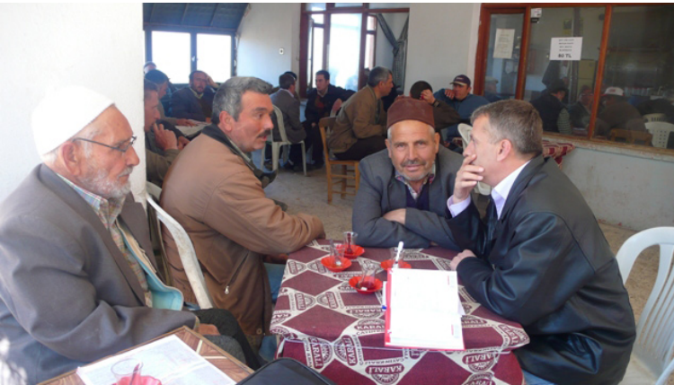
Foto 2. Hacıhüseyinler Köyü arazi çalışması

Hayvancılık faaliyetine bağlı olarak ortaya çıkan yaylaların yoğun olarak bulunduğu dağlık alanlardan biri de; Ege Bölgesi'nin kuzeyde Marmara Bölgesi ile sınırını oluşturan Madra Dağı kütesinin yüksek kesimleridir.