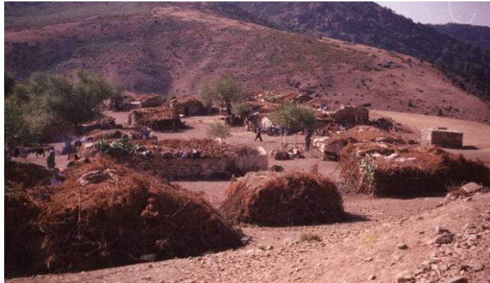
Foto 3. Hacıhüseyinler Yaylası

Geleneksel hayvancılık ekonomisinin yazlık otlak alanı olarak kullanılan Hacıhüseyinler Yaylası, Madra Dağı'nın daha nemli ve serin olan, alçak zondaki kuraklığa karşılık yazın hayvan otlatmaya uygun meraların yer aldığı,