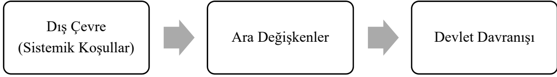
Şekil 1: Neoklasik Realizmin Kurduğu Nedensellik İlişkisi

nedensellik ilişkisini yansıtmaktadır. Bu bağlamda, realist paradigmadaki birleştirici bir yaklaşımın ortaya çıkarıldığı savunulabilir.