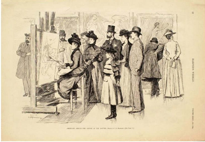
Resim: 7 Charles Stanley Reinhart, “Americans Abroad- the Copyist in the Louvre”, 1890.

Clark Sanat Müzesi koleksiyonunda bulunan orijinal adıyla “Americans Abroad- the Copyist in the Louvre” olarak bilinen eser, Charles Stanley Reinhart tarafından yapılmıştır (Resim 7). 1890 yılında, ağaç baskı tekniğiyle yapılan eser, Louvre müzesinde kopya çalışma yapan kadın bir sanatçıyı ve onu izleyen müze ziyaretçilerini konu almaktadır (Clark Museum, 2019). Müzelerdeki kopyalama çalışmalarını konu alan ve farklı dönemlerde yapılmış bu eserler, konuyu tarihsel ve düşünsel temelleri bağlamında değerlendirirken önemli bir belge niteliği taşıması açısından önemlidir.