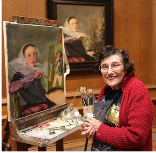
Resim: 13 “Ulusal Sanat Galerisi’nde resim kopyalayan bir sanatçı”.

Ulusal Sanat Galerisi, 1937 yılında Washington'da kurulan ve 1941 yılında halka açılan, koleksiyonu öncelikle Rönesans'tan günümüze Avrupa ve Amerikan sanatını temsil eden eserlerden oluşan bir sanat müzesidir. Amerika Birleşik Devletleri'nin Washington DC kentinde bulunan Ulusal Sanat Galerisi, koleksiyonunu, binalarını ve programlarını tüm izleyiciler için erişilebilir kılmayı taahhüt etmektedir. Ulusal Sanat Galerisinin sosyal hizmet anlayışı doğrultusunda gerçekleştirdiği kopyalama programı, müzenin halka açıldığı tarihten bu yana sağladığı hizmetlerin önemli bir parçası olmuştur (Resim 13) (National Gallery of Art, 2019).