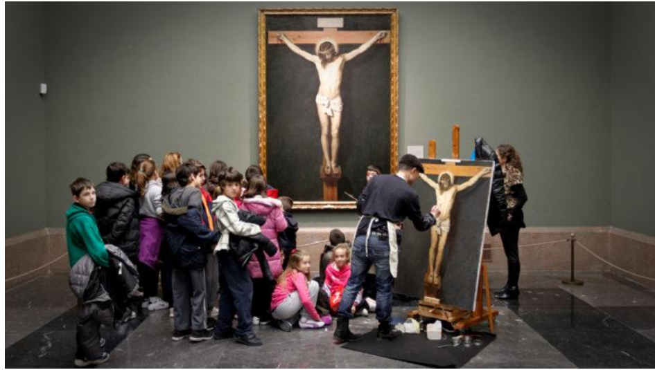
Resim: 3 “Prado Sanat Müzesi’nde kopyalama yapan bir sanatçı ve müze ziyaretçileri”, 2013. [(https://elpais.com/cultura/2013/01/27/album/1359245069_373345.html#foto_gal_1), (Ert.15.05.2019)].