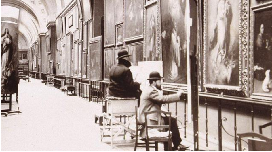
Resim: 2 “19. Yüzyıl’da Prado Sanat Müzesi’nde kopyalama yapan bir sanatçılar”, [(Gutiérrez, 2017 s.72.)].