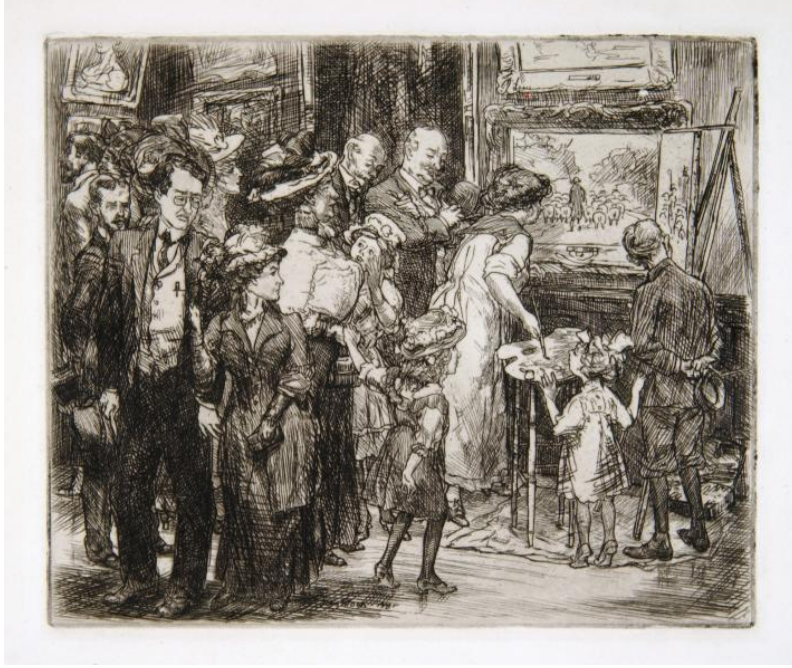
Resim: 9 John Sloan, "Copyist at the Metropolitan Museum (An Amateur Artist)", 1908.

Sanat müzelerindeki kopyalama geleneğini tasvir eden bir başka sanatçı da John Sloan'dır. Sanatçının 1908 tarihli gravür tekniğiyle yaptığı eser, Smithsonian Amerikan Sanat Müzesi'nde bulunmaktadır. Orijinal adıyla "Copyist at the Metropolitan Museum (An Amateur Artist)" isimli eserinde Metropolitan Sanat Müzesi'nde kopyalama çalışması yapan bir amatör sanatçıyı tasvir etmiştir (Resim 9), (Smithsonian American Art Museum, 2019). Gravür baskı tekniğiyle yapılmış bu eserin diğer baskıları da High Sanat Müzesi (High Museum), Ulusal Portre Galerisi (National Portrait Gallery) gibi Amerika Birleşik Devletleri'ndeki sanat müzelerinin arşivlerinde bulunmaktadır.