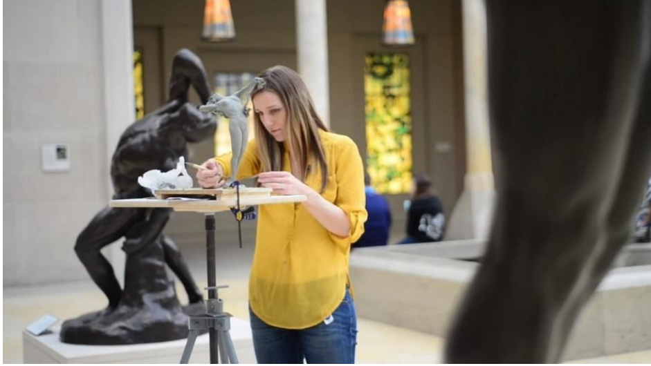
Resim: 12 “Metropolitan Sanat Müzesi’nde heykel kopyalayan bir sanatçı”.

[( https://www.metmuseum.org/metmedia/video/metkids/metkids-qanda/sebastian-interviews-a-copyist ), (Ert.15.05.2019)].