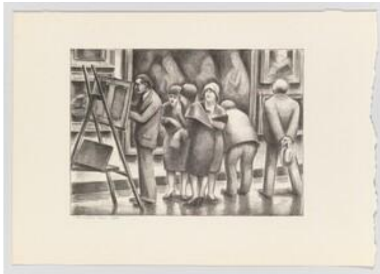
Resim: 10 Julius Bloch, "The Copyist 1930", 1930.

Julius Bloch tarafından, 1930 yılında yapılan ve orijinal adı "The Copyist 1930" olan eser, müzede kopyalama yapan sanatçıların tasvir edildiği başka bir örnektir (Resim 10). Whitney Amerikan Sanatı Müzesi arşivinde bulunan ve litografi baskı tekniğiyle yapılmış eserde, yine müzede kopya çalışma yapan bir ressam ve onu izleyen müze ziyaretçileri resmedilmiştir (Whitney Museum of American Art, 2019).