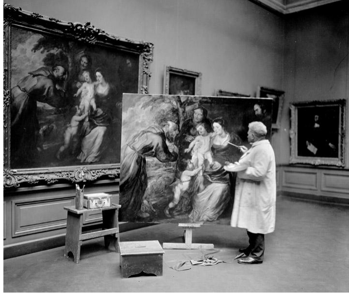
Resim: 5 “Metropolitan Sanat Müzesi’nde kopyalama yapan bir sanatçı”, 1902-29.

[( https://www.metmuseum.org/blogs/now-at-the-met/2016/the-met-copyist-program ), (Ert.15.05.2019)].