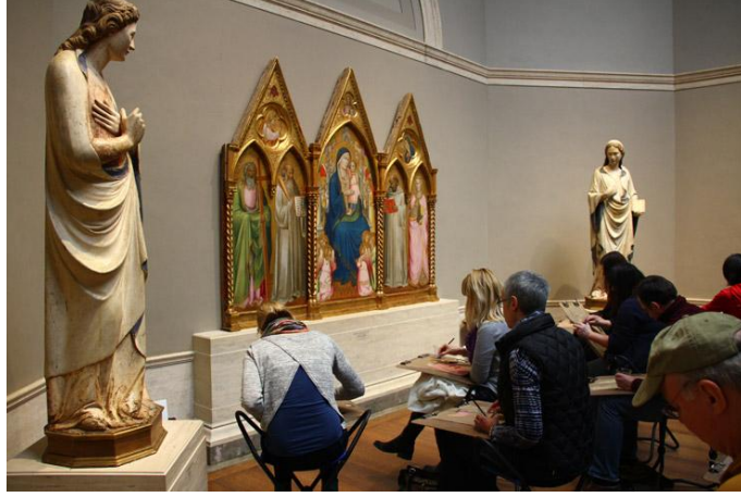
Resim: 14 “Ulusal Sanat Galerisi”nde eskiz yapan ziyaretçiler”.