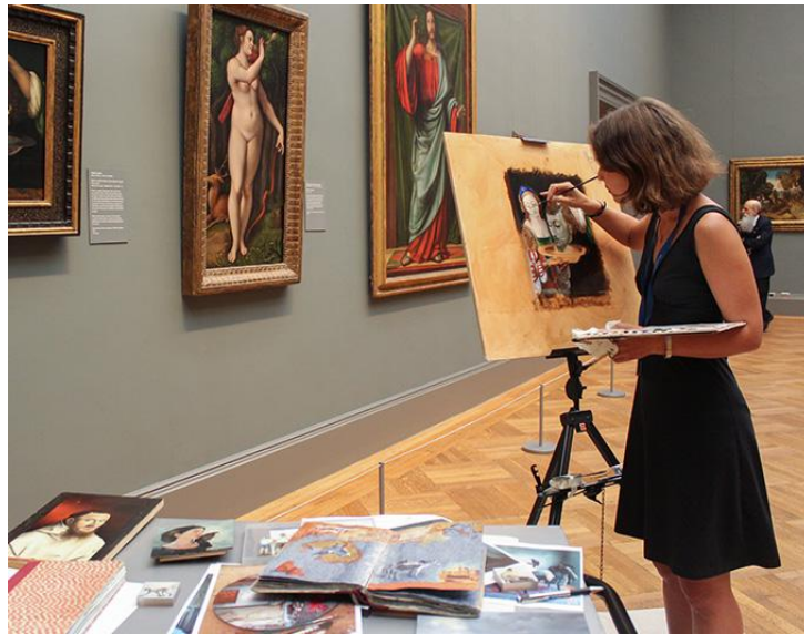
Resim: 11 “Metropolitan Sanat Müzesi’nde resim kopyalayan bir sanatçı”.

Metropolitan Sanat Müzesi, sanatçı programları kapsamında sunduğu “kopyalama programı” ile sanatçılara bir sanat eserini kopyalamaları ve tekniklerini geliştirmeleri için zaman ve mekân sunmaktadır. Metropolitan Sanat Müzesi bu program ile 1872'den bu yana müzenin koleksiyonundaki orijinal eserlerin yeniden yorumlanmasını sağlamaktadır. Program, yoğun teknik çalışmayı ve derin gözlemi desteklerken resim, heykel ve tekstilin dâhil olduğu ancak bunlarla da sınırlı olmayan pek çok alanı kapsayan çeşitli ortamlar sunarak sürekli katılımını teşvik etmektedir (Resim 11), (Resim 12), (Metropolitan Museum, 2019b).