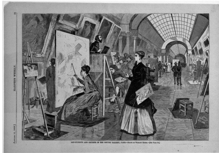
Resim: 6 Winslow Homer, “Art-Students and Copyists in the Louvre Gallery, Paris”, 1868.

Sanat müzelerinde yapılan kopyalama geleneğini tasvir eden pek çok önemli sanat eserinin de varlığından söz etmek gerekirse, New York kentindeki Brooklyn Sanat Müzesi’nde bulunan Winslow Homer tarafından ahşap kazıma tekniğinde 1868 yılında yapılan orijinal adıyla “Art-Students and Copyists in the Louvre Gallery, Paris” isimli eseri örnek verebiliriz (Resim 6). Louvre Müzesinin galerilerinde kopyalama çalışmaları yapan sanatçı ve öğrencileri betimleyen Homer, bu çalışmada Fransa İç Savaşı sonrası kadınlar için sanat eğitimindeki devrimi ele almıştır (Brooklyn Museum, 2019).