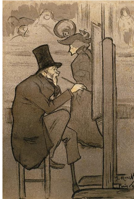
Resim: 8 Isidre Nonell, “Copista en el Museu del Louvre”, 1897.

On dokuzuncu yüzyılda aynı konuyu temel alan bir eser de 1897 yılında Isidre Nonell tarafından mürekkep ve karakalem tekniğiyle yapılmış bir çizimdir (Resim 8). Orijinal adı “Copista en el Museu del Louvre” olan eser İspanya’nın Barselona kentinde bulunan Katalan Ulusal Sanat Müzesi arşivinde yer almaktadır. Bu eserde Louvre Müzesinde kopyalama yapan bir erkek sanatçı ve kadın bir müze ziyaretçisi resmedilmiştir (Museu Nacional d'Art de Catalunya, 2019).