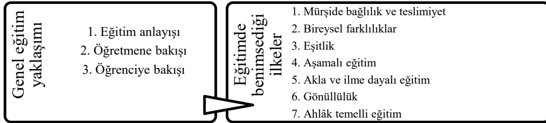
Şekil 1. Bulgulardan elde edilen kategori ve temalar

Şekil 1.'de görüldüğü gibi içerik analizi sonucunda elde edilen temalar, Hacı Bektaş Veli'nin eğitime genel yaklaşımı, eğitimde benimsediği ilkeler şeklinde iki kategoriye ayrılmıştır. Birinci kategorideki temalar eğitim anlayışı, öğretmene bakışı ve öğrenciye bakışı; ikinci kategorideki temalar mürşide bağlılık ve teslimiyet, bireysel farklılıklar, eşitlik, aşamalı eğitim, akla ve ilme dayalı eğitim, gönüllülük ve ahlâk temelli eğitimidir.