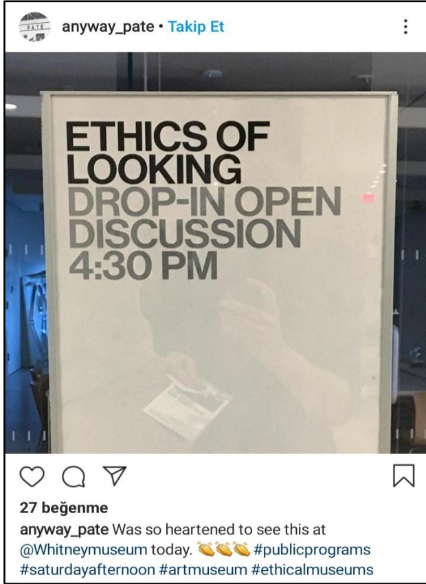
Görsel 2. Withney Amerikan Sanatı Müzesi etik sohbetleri bilgilendirme panosu.

bağlantılı olan bu yaklaşımla ziyaretçi sergileri gördükten sonra, temsilin siyaseti ve etiği hakkında hazırlanan müze tartışma serilerine katılabilmektedir. Böylece Whitney Müzesi, bu haftalık oturumlarda toplumla katılım odaklı diyalog ve tartışmayı teşvik edebilmekte ve müzecilik uygulamalarına eleştirel bir gözle bakabilmektedir (Bkz. Görsel 2). Müze bu etkinlikleri #ethicalmuseums etiketiyle sosyal medya platformlarında da duyurmaktadır.