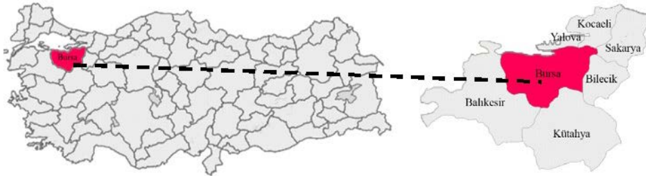
Şekil 1. Bursa konumu

Anadolu’nun kuzey-batısında, Marmara Bölgesi’nin güneyinde, 40°12” kuzey enlemi, 29°04” doğu boyları arasında yer alan Bursa, Marmara Bölgesi’ni Batı Anadolu’ya (Ege Bölgesi) ve İç Anadolu’ya bağlayan kavşak noktasında, Türkiye’nin üç büyük şehrinin, İstanbul, Ankara ve İzmir’in oluşturduğu üçgenin merkezinde bulunmaktadır. İlin yüzölçümü 11 466 km 2 ’dir. Bursa kentinin kuzeyinde Marmara Denizi ve Yalova, kuzeydoğusunda Kocaeli ve Sakarya, doğusunda Bilecik, güneyinde Kütahya ve batısında Balıkesir illeri bulunmaktadır (Şekil 1).