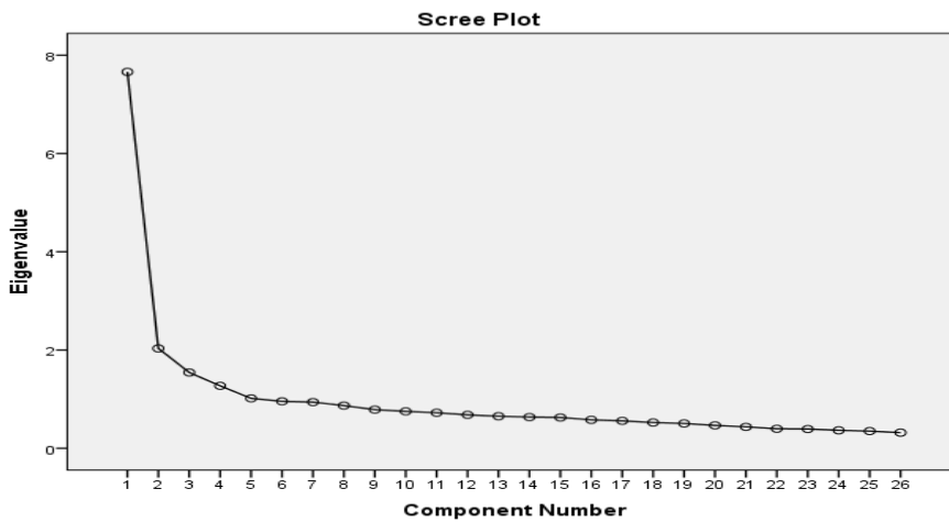
Şekil 1. Faktör Yapısı Dağılım Çizelgesi

Ölçekte faktör yükü, bir maddenin ait olduğu faktörü açıklama gücünü göstermektedir. Bu değer yüksek olması maddenin ait olduğu faktörü açıklama gücünün yüksek olduğu anlamına gelir. Maddenin açıklama gücünün yeterli olarak kabul edilebilmesi için faktör yükünün en az .30 düzeyinde olması gerekir. Ancak ilgili literatüre bakıldığında araştırmacıların alt kesme noktası olarak genellikle .40 değerini temel aldığı görülmektedir. 32 Bunun yanı sıra faktör yükleri arasında binişiklik ölçütü olarak .10'dan daha düşük bir fark bulunması gerektiği kabul edilmektedir. 33 Öte yandan korelasyon değerinin kabul edilebilmesi için .30 ve .90 arasında olması gerektiği düşünülmektedir. 34 İşte çalışmanın ölçek geliştirme sürecinde bu ölçütler dikkate alınarak faktör yükü .40'ın altında bulunan 35 madde çıkarılmıştır.