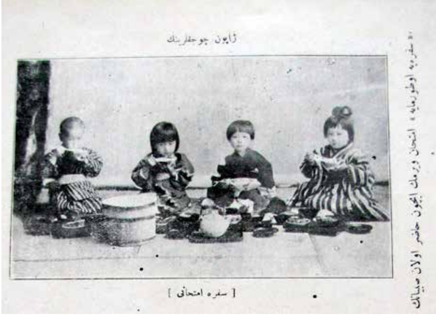
Resim-2 Japon çocuklarının sofraya imtihanı

Bu kıstasları başaran çocuklar şereflerine düzenlenecek yemeklerde ve davetlerde ebeveynlerinin yardımına ihtiyaç duymadan “diplomalı olarak “ yemeklerini yerler.