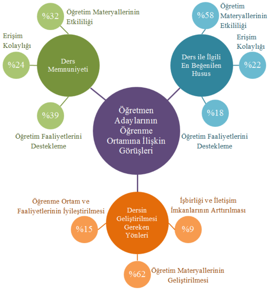
Şekil 4.1 Öğretmen Adaylarının Öğrenme Ortamına İlişkin Görüşleri