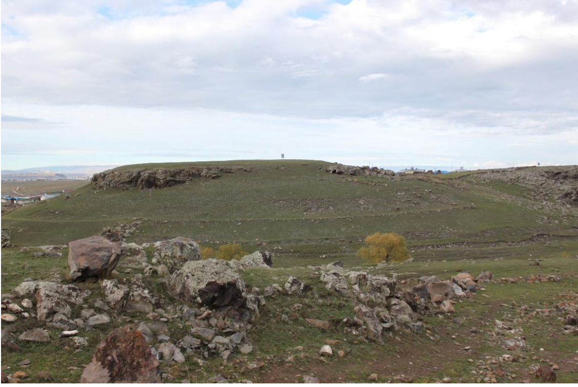
Levha 3. Borluk Vadisi'nin batı ucunda bulunan Azat Höyük.

Höyük ve burada bulunan kaya resimlerinin tarihlemesini yapabilmek ve aralarındaki analogiyi kurabilmek adına 2015-2016 yılında bu bölgede çalışılmıştır. Höyük etrafından toplanan malzemeler en erken Kura-Aras Kültürü'nü işaret etmektedir 1 . (Lev. 4) Bununla birlikte bu araştırma sırasında vadide bulunan kaya resimlerinin Mağaracık Köyü (Lev. 5) ile başlayıp Azat Köyü'ne kadar uzandığı görülmektedir (Bkz. Harita 1).