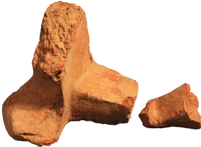
Levha:4.1. Kura-Aras Kültürü Taşınabilir ocak altı.

Vadide pano halinde birden çok olan resimler dışında çalışma bölgemize yakın ancak vadi dışında olan tekli resimlerin betimlendiği kaya resimleri de tespit edilmiştir (Lev. 6).