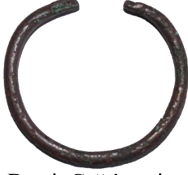
Levha:4.6. Demir Çağı'na ait metal bilezik (Kars Müzesi).