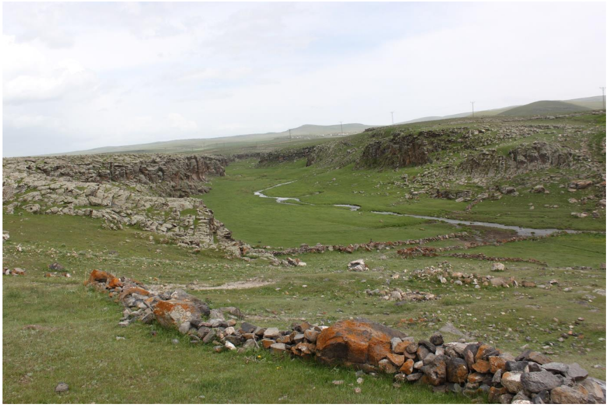
Levha 1. Azat Höyük'ten Borluk Vadisi.

Doğa içinde sınırları belirli bir bölgenin ekosistem özelliği göstermesi için canlı ve cansız varlıkların etkileşimine bağlı bir ilişkiler ağına ihtiyaç vardır. Dolayısıyla insan, hayvan ve doğanın bizatihi kendisinin içi içe girip birbirlerini etkiledikleri veya birbirinden etkilendikleri lokal bölümler bu anlamda önem kazanmaktadır. İşte bu bölümlerden birisi Borluk Vadisi'dir (Lev. 1). Borluk Vadisi'nin de içinde bulunduğu Güney Kafkasya İlk ve Orta-Son Tunç Çağı'nda iki kültürün orijin bölgesini oluşturan özel bir coğrafyadır. (Yardimciel, 2015a: 42) Bu kültürler İlk Tunç Çağı'nda var olan Kura-Aras Kültürü (Işıklı, 2011: 15) ve Orta-Son Tunç Çağı'nda var olan Aras Boyalıları Kültürü'dür. (Yardimciel, 2015b: 28) Bu sebeple bu bölgede yapılacak her araştırmaların bölge tarih ve arkeolojisine önemli katkıları olacaktır.