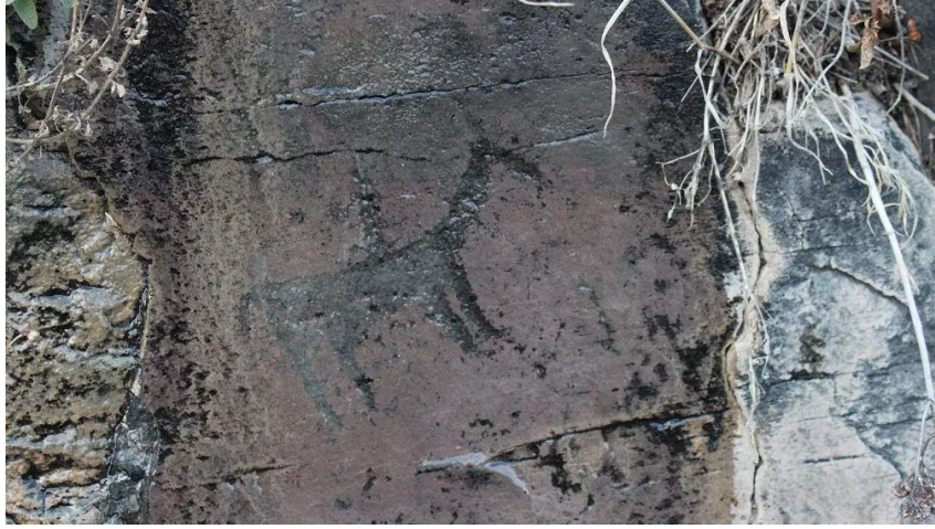
Levha 5. Borluk Vadisi'nin doğu ucunda bulunan Mağracık Köyü'ndeki resimlerden bir süvari betimlemesi.