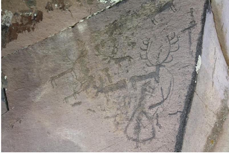
Levha 9. Kağızman küçük panodan kaya resimleri (K.Zeynelabidin Yaşlı).