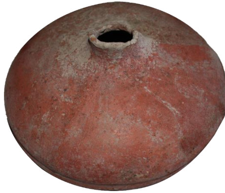
Levha:4.5. Azat höyük'ten Demir Çağı'na ait matara (Kars Müzesi).

Bu işlenmiş kemik objeler yüzey buluntuları olup dönemleri konusunda kesin hüküm vermek olanaksızdır. Ancak höyük ve civarında yoğun bir Kura-Aras Kültürü kalıntısı olduğu da gözlerden kaçırılmamalıdır.