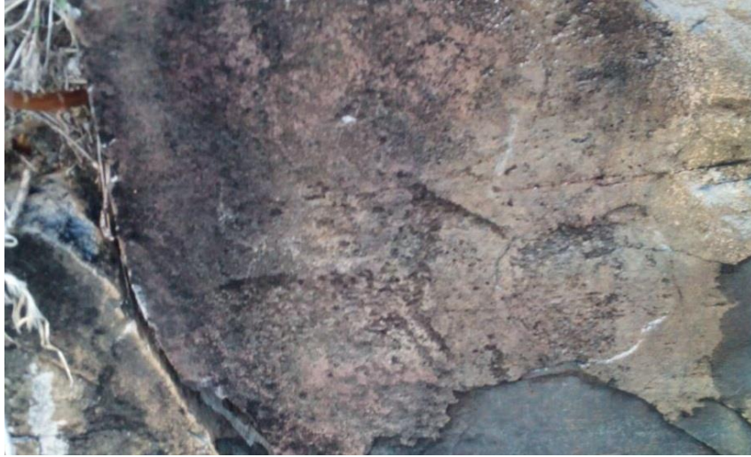
Levha 6. Borluk Vadisi'nde olmayan ancak vadiye yakın köy altı mevkiindeki süvari betimlemesi.

Bölgenin denizden yüksekliği 1830 metredir. Resimler ortalama olarak vadi tabanından 10-15 m. Yükseklikte bulunan andezit kayaların özellikle güney yamaçlarında bulunmaktadır. Kar, yağmur, güneş, rüzgâr bazen ise insanoğlu etkisi ile resimlerin tahrip olduğu anlaşılmaktadır (Belli, 2011: 80).