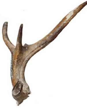
Levha 10. Azat Höyük'ten kızıl erkek geyiğe ait boynuz parçası.