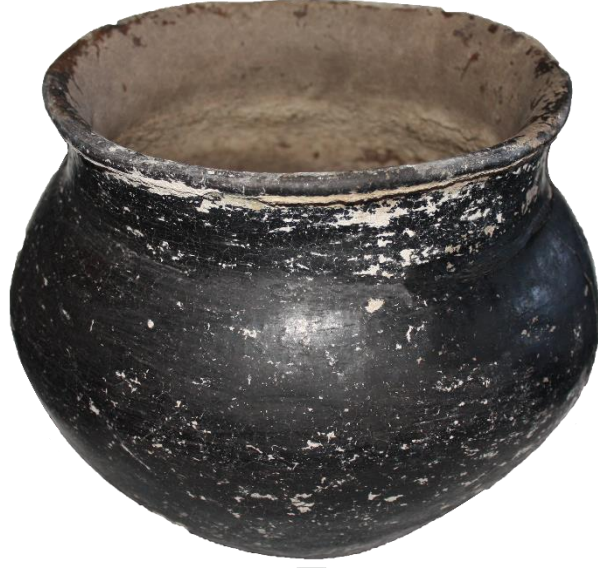
Levha:4.2. Kura-Aras Kültürü'ne ait çömlek.