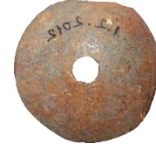
Levha:4.7. Kemikten ağırşak (Kars Müzesi).