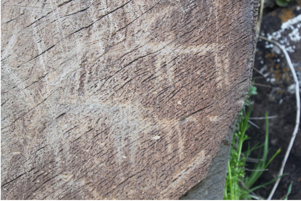
Levha 2. İkisu Mevkii kaya resimlerinden dağ keçisi betimlemesi.

Kaya resimleri ekolojik ilişkiler ağının en somut örnekleridir. Bu resimler vadinin tek bir yerinde olmayıp; Kervan Resimleri , Katran Kazanı ve İki Su Arası mevkilerinde bulunmaktadır. (Belli, 2007: 32-33) İnsanlar kendileri dışında bulunan canlıların resimlerini vurgu ve kazıma tekniği ile ekosistemin bir diğer parçası olan kayalar üzerine betimlemişlerdir. Borluk Vadisi aynı zamanda günümüzde modern Kars Kenti'ne en yakın prehistorik yerleşmeye sahiptir. Bu yerleşme yeri ise Azat Höyük 'tür (Lev. 3). Höyük, kaya resimlerinin olduğu vadiye yer alması açısından önemlidir. Katran Kazanı olarak bilinen pano ile höyüğün arası sadece 500 m.'dir. Bunun dışında höyük vadiye hâkim bir noktada olup vadinin batı yönündeki bitiş noktasındadır. 1941 yılında Prof.Dr. Kılıç Kökten tarafından tespit edilen yerleşme yerinin diğer ismi ise Dünder Tepe'dir. (Kökten, 1945: 474). Azat Höyük'te aynı bilim insanı tarafından 1952 yılında sondaj çalışmaları yapılmıştır. Bu sondajlar sırasında İlk Tunç Çağı Kura-Aras Kültürü'ne ait arkeolojik buluntulara ulaşılmıştır. Orta Tunç Çağı Aras Boyalıları Kültürü'ne ait arkeolojik buluntular tarif edilse de bunlar Hitit malzemeleri olarak tanımlanmışlardır (Kökten, 1945: 474). Oysaki günümüz tarih ve arkeoloji bilimlerinin çalışmaları ışığında Hitit İmparatorluğu'nun Güney Kafkasya'nın bu bölümüne etki etmediği bilinmektedir (Özfiat, 2001: 1-7).