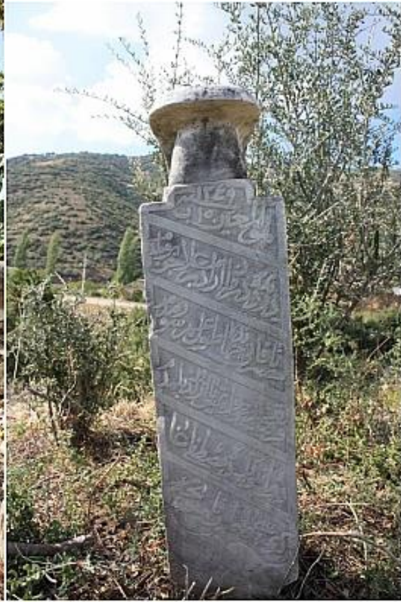
Foto 6. Kadın Hotozlu Baş Şahidesi