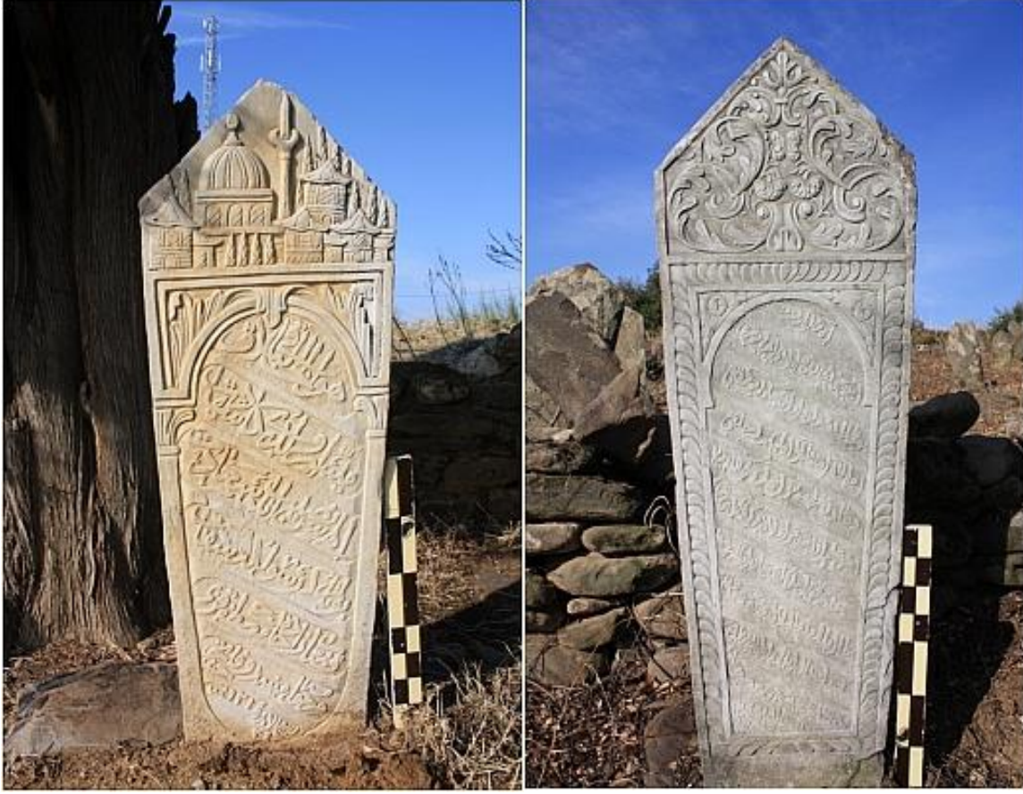
Foto 7. Kadın Sivri Kemerli Baş Şahideleri

Mezar Taşlarından bir tanesi hariç tamamı dikdörtgen formludurlar. Bunun tek örneği olan silindirik gövdeli mezar taşı şekilde görülmektedir (Foto 8). 8