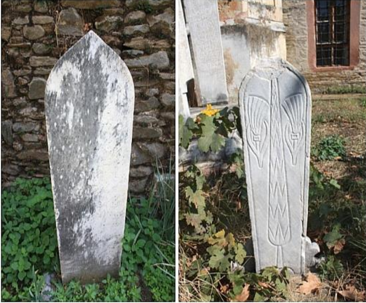
Foto 9. Ayak şahideleri

Kitabeler Sadece Baş Şaidesinin gövde kısmında yer almaktadır. Yazılar genelde etrafı oyularak kabartma şeklinde yazılmıştır (Foto 4-5-6). Yazı Türü olarak ilk dönemlerde Sülüs, son dönemlerde ise Sülüsle beraber Talik yazı da kullanılmıştır. Nadir de olsa Rik'a türü yazıya da rastlanmaktadır. 9