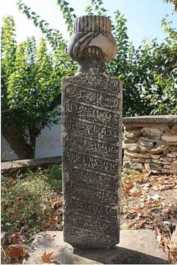
Foto 5. Erkek Kavuklu Baş Şahidesi

Kadın mezar taşları dikdörtgen formunda olup tepelik kısmı genellikle sivri kemerlidir. Süslemenin yoğun olduğu tepelik kısmında çeşitli bitkisel motiflerin yanında Batı Anadolu'ya has bir özellik olan mimari unsurlara(cami tasvirli) sıkça rastlanır. 6 Ayrıca Kadın mezar taşlarında Hotoz denilen başlıklı örnekler de vardır. Erkek mezar taşları genellikle sadedir. Gövde kısmındaki kitabenin dışında herhangi bir süsleme yoktur (Foto 6-7). 7