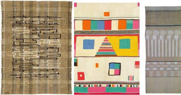
Resim 10. Anni Albers, tapestry dokuma, 1950.

1919 yılında Walter Gropius'un kurduğu, sanat ve zanaat okulunun kombinasyonu olan Bauhaus Okulu, tekstil sanatının yeni anlam kazanmasına öncülük etmiştir. Dokuma atölyesinde Anni Albers, Otti Berger, Gunta Stölz gibi sanatçılar, yapı ve malzeme unsurlarına vurgu yaparak etkili tapestry örnekleri dokumuşlardır. "Bauhaus dokuma atölyesinde üretilen ilk kumaşlar, ressam Paul Klee'nin etkisi altında dokunan "resimsel dokumalar" ya da tapestrylerdir. Ancak bu, çok uzun sürmemiştir ve Gropius'un mimari konseptinin etkisini göstermeye başlamasından öncedir. Çalışmalarda vurgu, fazlasıyla malzeme ve konstrüksiyon üzerine yapılmıştır. Renk, mimari ve makine sanatını yansıtacak şekilde nötrleştirilmiştir. Konu ilk önce soyut, sonra somut olmuştur. Bu ruhla, muazzam güzelliğin tapestryleri diğerleriyle birlikte, Anni Albers, Otti Berger ve Gunta Stölz tarafından üretilmiştir (Constantine and Larsen, 1972, s. 17).