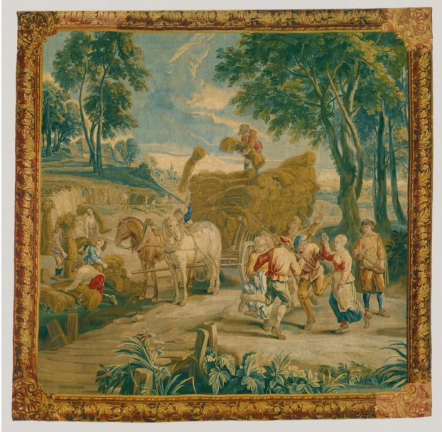
Resim 5. 1712–28 yıllarına ait tapestry dokuma.