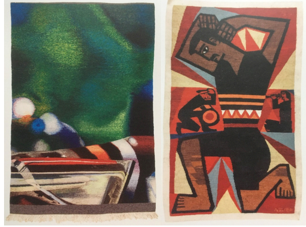
Resim 18. "İsimsiz", Eser: Özdemir Altan, 1973.

söylenebilir. Mustafa Aslıer (D. 1925 – Ö. 2015), Gazi Eğitim Fakültesi Sanat Bölümü mezuniyetinden sonra Almanya'da Grafik Bölümünde yüksek lisans eğitimi almıştır. Sanatçının Resim 19'da bulunan "Zeybek" adlı figüratif eseri, kilim tekniği kullanılarak uygulanmıştır.