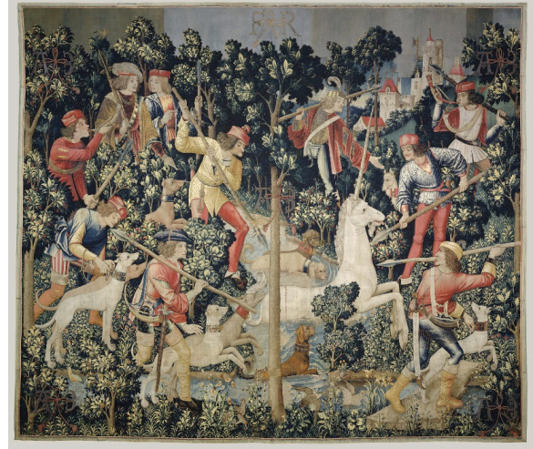
Resim 3. 1495-1505 yıllarına ait tapestry dokuma.

Tapestryler atkı etken dokuma türü olan kilim tekniği ile elde edildiğinden, renklendirme ve dolayısıyla resimleme atkı malzemesi ile gerçekleştirilmektedir. Kartona çizilen renk alanı dolana kadar, belirtilen koddaki atkı ipliği ile uygulama yapılarak tasarım gerçekleştirilmektedir. Tapestry dokumalarında güçlü resimsel anlatımların yer alması, dokumacıların ustalığına, uygulamada kullanılacak ipliklerin inceliğine ve renk çeşitliliğinin fazla olmasına bağlıdır.