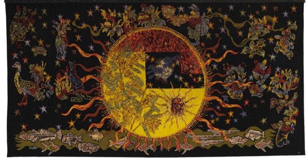
Resim 13. "Australia" – Tapestry dokuma, Tasarım: Jean Lurçat, 1960-1961.