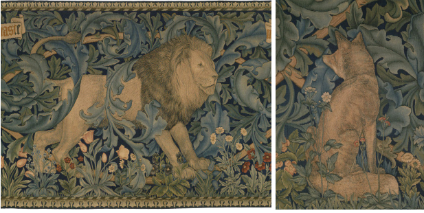
Resim 8. ve Resim 9. "The Forest" – Tapestry dokuma,1887. Detay

1919 yılında Walter Gropius'un kurduğu, sanat ve zanaat okulunun kombinasyonu olan Bauhaus Okulu, tekstil sanatının yeni anlam kazanmasına öncülük etmiştir. Dokuma atölyesinde Anni Albers, Otti Berger, Gunta Stölz gibi sanatçılar, yapı ve malzeme unsurlarına vurgu yaparak etkili tapestry örnekleri dokumuşlardır. "Bauhaus dokuma atölyesinde üretilen ilk kumaşlar, ressam Paul Klee'nin etkisi altında dokunan "resimsel dokumalar" ya da tapestrylerdir. Ancak bu, çok uzun sürmemiştir ve Gropius'un mimari konseptinin etkisini göstermeye başlamasından öncedir. Çalışmalarda vurgu, fazlasıyla malzeme ve konstrüksiyon üzerine yapılmıştır. Renk, mimari ve makine sanatını yansıtacak şekilde nötrleştirilmiştir. Konu ilk önce soyut, sonra somut olmuştur. Bu ruhla, muazzam güzelliğin tapestryleri diğerleriyle birlikte, Anni Albers, Otti Berger ve Gunta Stölz tarafından üretilmiştir (Constantine and Larsen, 1972, s. 17).