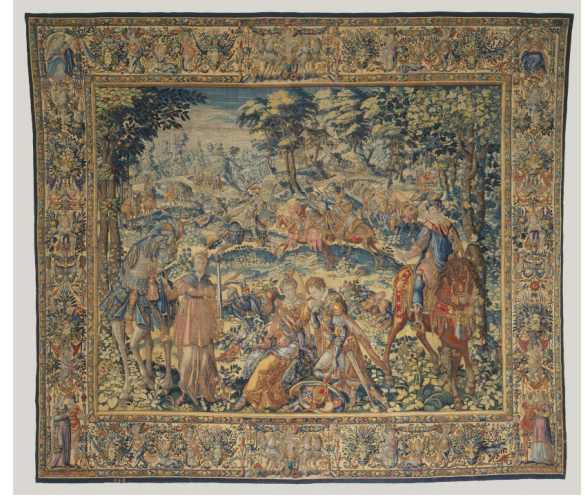
Resim 4. 1590-1595 yıllarına ait tapestry dokuma.