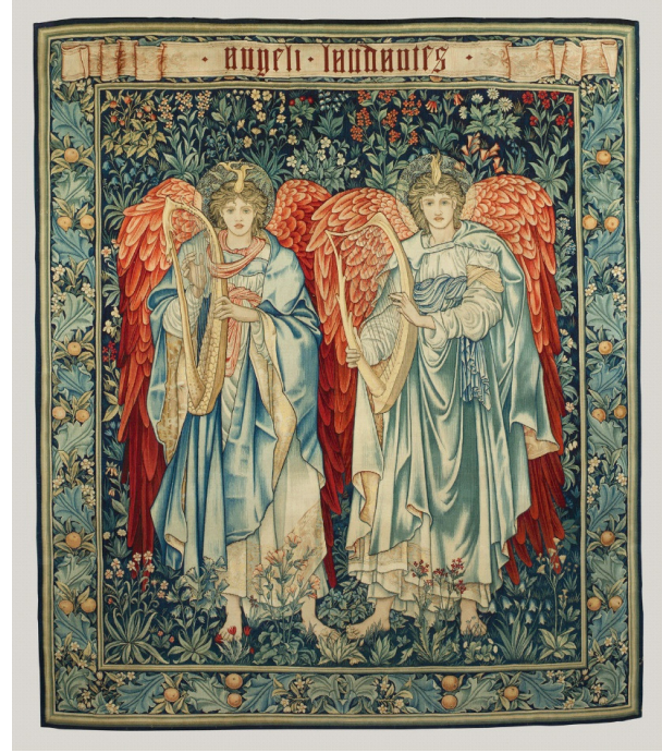
Resim 6. 1898 yılına ait tapestry dokuma.

18. yüzyılın sonlarına doğru iç mekânların daha sıcak olması ve daha ekonomik olan duvar kâğıtlarının moda olması, tapestry dokumalarına talebin azalmasına neden olmuştur. Dolayısıyla bu durum üretimin de azalmasına neden olmuş Londra ve Brüksel atölyeleri kapatılmıştır (Özay, 2001, 23). 19. yüzyılda da tapestry dokumalarına talep azalmaya devam etmiştir. Endüstri devrimi ile makineleşmenin hızla artması, seri üretime geçişe neden olmuş, el emeğine bağlı oldukça zahmetli ve maliyetli olan tapestry dokumalarının üretimine gölge düşürmüştür.