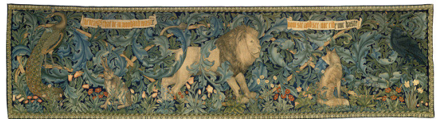
Resim 7. “The Forest”, Tapestry dokuma, 1887. Tasarımcılar: William Morris, Philip Speakman Webb, John Henry Dearle