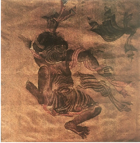
Resim 17. Mehmet Siyahkalem'den uyarlama, 1970. Yorum ve Uygulama: Zekai Ormancı ve Öğrencileri.

Devam eden yıllarda akademisyen sanatçıların önderliğinde tapestry sanatı ile ilgili birçok etkinlik gerçekleştirilmiştir. Yapılan bu etkinlikler, sanat ve tasarım alanında akademilerde düzenlenen sempozyumlar, Türkiye'de tapestry sanatının gelişimine şekil veren oluşumlardır.