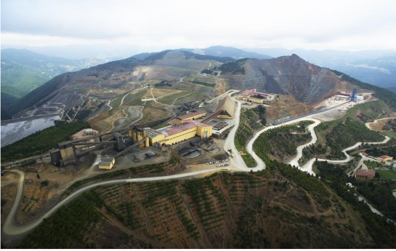
Ek-1) Eti Küre Bakır Maden İşletmesi