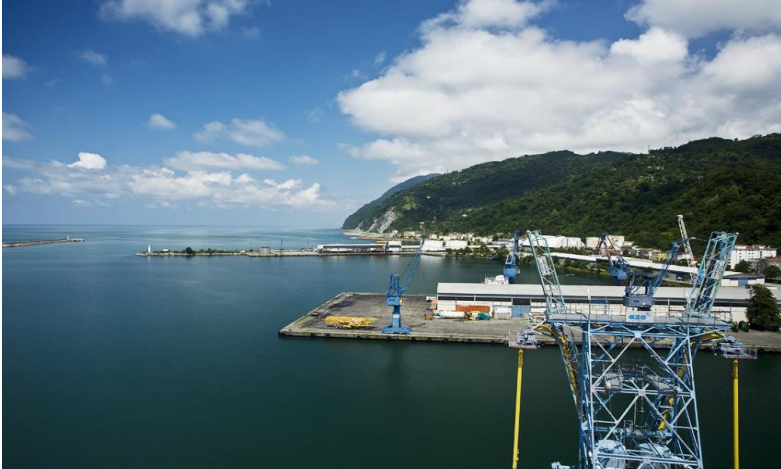
Ek-2) İnebolu Limanından Bir Görünüm