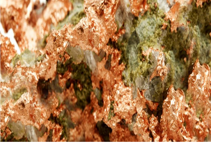
Ek-3) Bakır Konsantresi