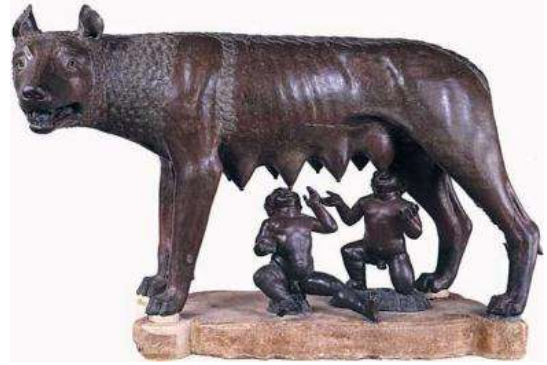
R.2: Romalılar'da Kurttan Süt Emen Çocuklar

İlginç bir biçimde Romalılarda da, bir dişi kurdun çocukları emzirdiği sahneler tanıklık edilmektedir. (R.2). Olay şöyle gelişmiştir; Latium bölgesinde Kral Numitor, erkek kardeşi tarafından devrilmiştir. Kralın kızının yeni varisler doğurmaması için bakire kalması sağlanmaya çalışılmış ancak bir gün bu kız, Mars'ın tecavüzüne uğrayarak "Romulus ve Remus" isimli ikiz çocukları dünyaya getirmiştir. Bu çocuklar ölmesin diye Tiber nehri kıyısına terk edilirler. İşte bu anda bir dişi kurt onları bulup, emzirmeye başlar. Sonra da bir çoban bu çocukları yanına alır. Çocuklar büyüyüp de, kraliyet soyundan geldiklerini öğrenince, Numitor'un tekrar başa geçmesini sağlarlar ve böylece yeni kurulan kente isim olarak "Roma" adı verilir.(MÖ.4.yy.lar). (Ergüven, 2012:115).