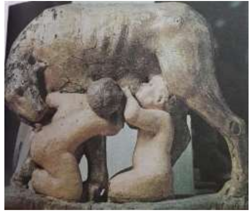
(Ergüven, 2012:115 ; Jung, 2009).

Oğuz Türklerinde ise Oğuz boyları ve Oğuz Kaan'ın gök ve yerin kızı ile evlendiği anlatılır. Ve bu şekilde soy devam eder. Ayrıca Türklerin ağaçtan türediğine inananlar da söz konusudur. (Çoruhlu, 2011b:125-126,130).