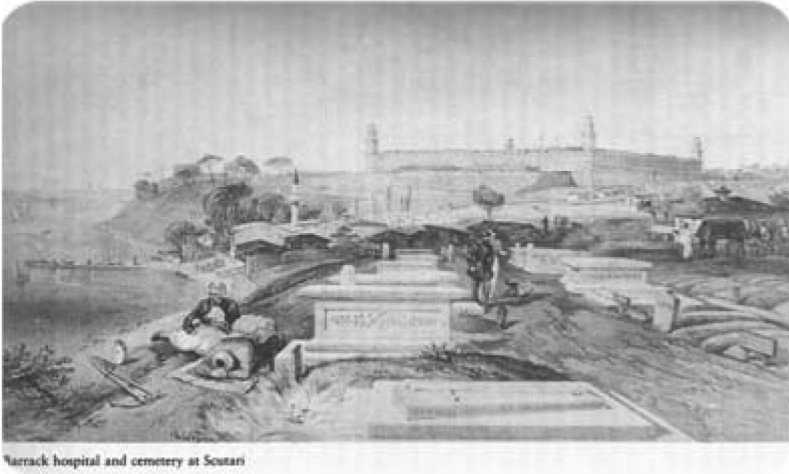
Resim 2. Üsküdar “Dev Perişanlık”