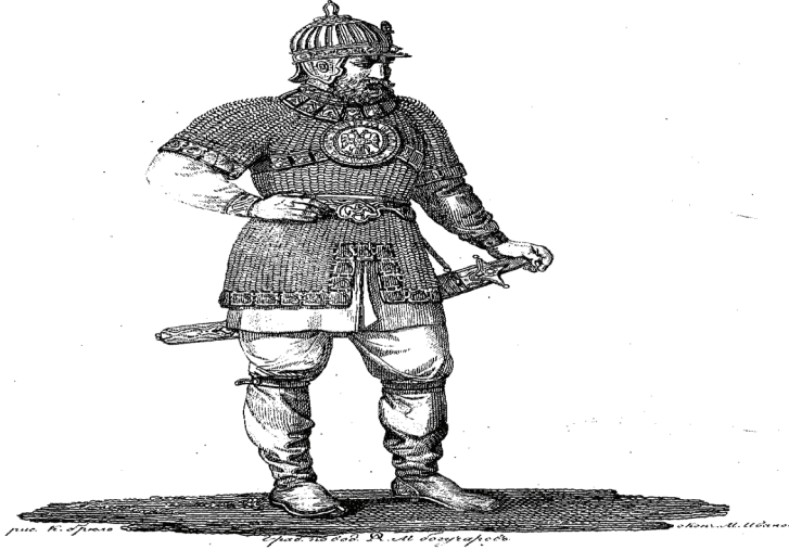
ЕРМАКЪ ТИМОФЬЕВИЧЪ Завоеватель Сибири въ его настоящемъ Русскомъ вооруженіи, слѣдующа рисункамъ Сивирской Лѣтописи по списку Ремезова.