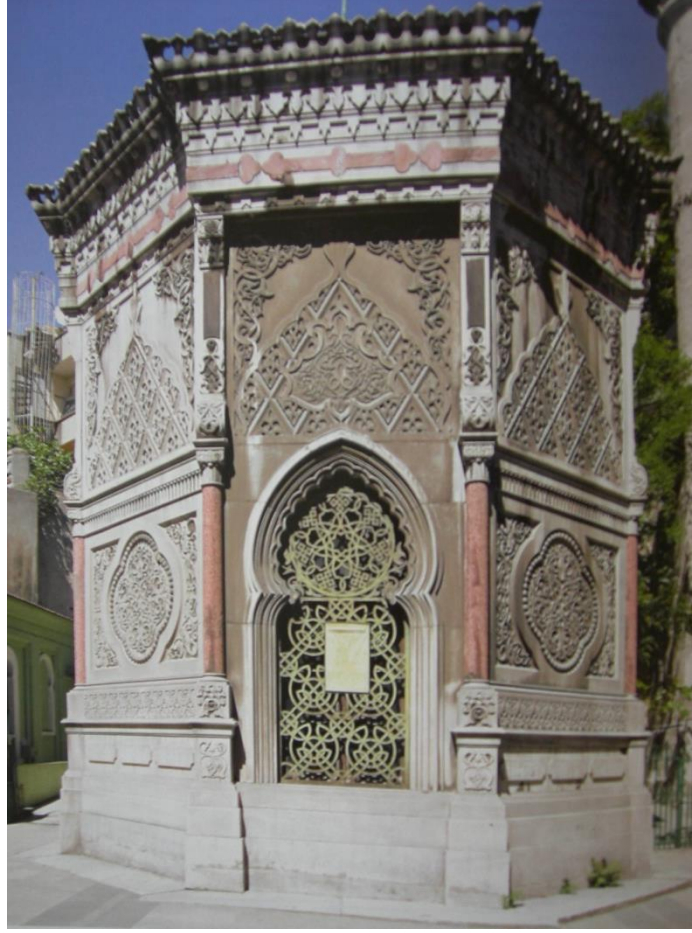
Resim 3: Fuad Paşa Türbesi (Kuban, 2007: 608).

Tanzimat sonrası “ Osmanlılık ” anlayışını mimari üzerinden yeniden canlandırmak üzere yapılan önemli bir girişim Abdülaziz döneminde Viyana Sergisi için hazırlanan “ Usûl-i Mi'mârî-i Osmanî ” adlı kitaptır. Bu kitap, Tanzimat sonrasında Osmanlı'nın kimlik kurgusundaki düşüncelerini mimarlık ve sanat üzerinden dünyaya açmaya çalışan bir kültürel kimlik ifade metni olarak dikkat çekmektedir (Ersoy, 2013). Ayrıca, Sultan Abdülaziz döneminde inşa edilen Beylerbeyi Sarayı'nın mimari tarzındaki genel batılı etkilere rağmen elçi kabul salonunun oryantalist bir tasarıma sahip olması dışarıya karşı Osmanlılık simgesinin yansıtılmaya çalışıldığını düşündürür. Diğer taraftan, Tanzimat ile birlikte gelişen “ Osmanlılık ” anlayışı, II. Abdülhamid döneminde, dış etkenler ile Balkanlar'daki dinî ve milliyetçilik akımlarının güncelleşmesi sonucunda bekleneni vermemiştir (Karal, 1988: 539-543). II. Abdülhamid bu noktadaki stratejisini Arap eyaletlerini kazanacağı bir yöne çevirir. Böylelikle, İslamcılık politikasını Osmanlılık düşüncesinden de yararlanarak pragmatik bir