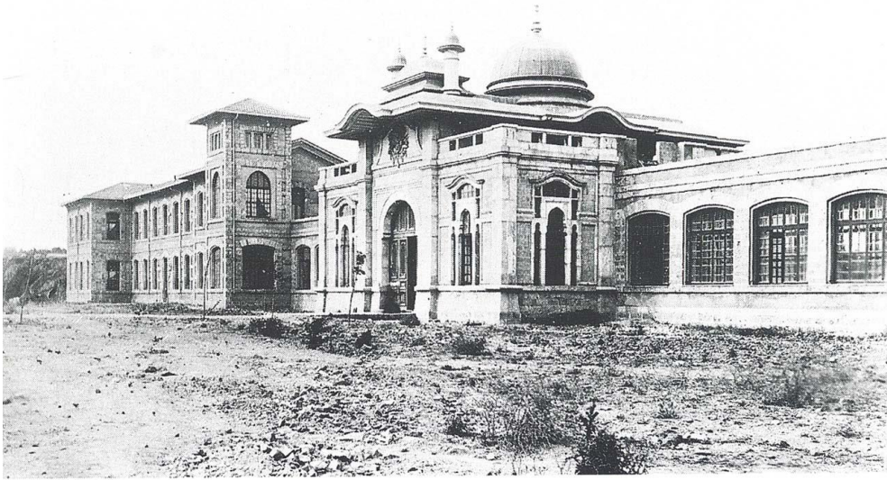
Resim 7: Haydarpaşa Mekteb-i Şahane Binası (Barillari ve Godoli, 1997).

ziyaretlerine resmi bir sıfat kazandırılarak, Osman Gazi'nin babası ve Osmanlı Hanedanı'nın efsanevi kurucusu Ertuğrul Gazi'nin türbesinde her yıl ayrıntılı bir anma töreni (ihtifal) düzenlenmiştir. II. Abdülhamid Söğüt kasabasında ayrıca, Orhan Gazi Camisi'ni tamir ettirmiş, 1903-1905 yılları arasında kare planlı, kurşun kaplı tek kubbeli, kırmızı kesme taştan çift minareli Hamidiye Camisi'ni ve caminin hemen karşısına üzerinde tuğrası bulunan, kırmızı kesme taştan pencere ve kapı söveleri olan iki katlı taş Hamidiye İdadisi'ni yaptırmıştır (Güntan, 2007: 104).