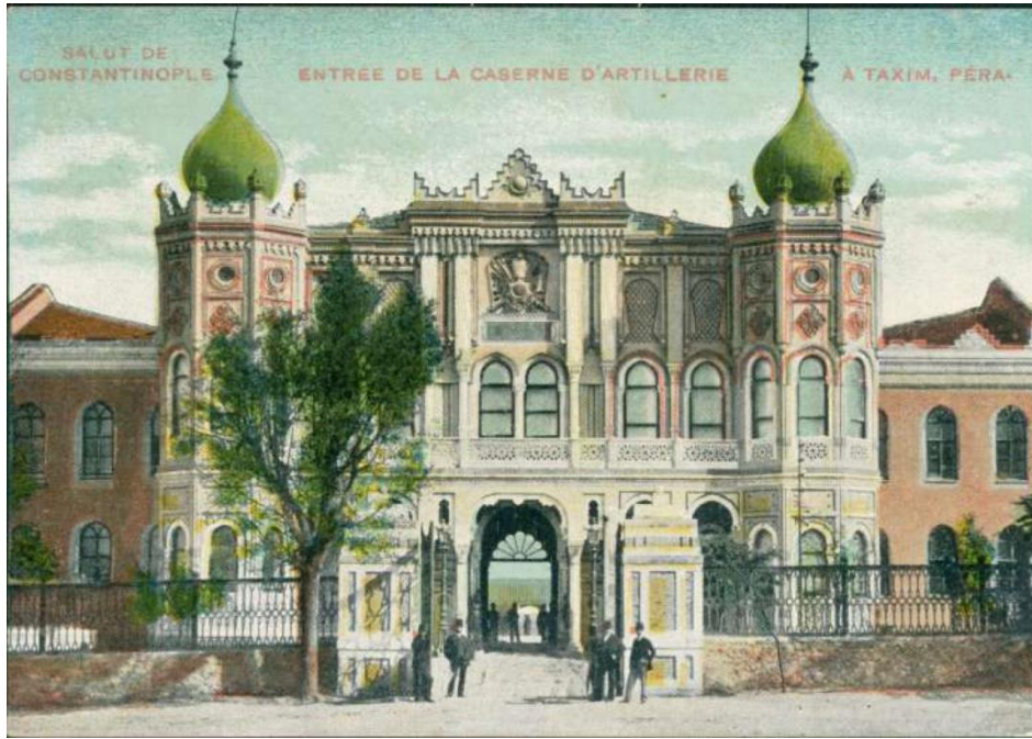
Resim 2: Eski bir kartpostalda Taksim Topçu Kışlası'nın “oryantalist” üsluplu giriş cephesi.

son dönemlerine ait arşiv belgelerindeki çizimlerde bazı kamusal ve konut yapılarında görülen “oryantalist” üslup öğeleri; genelde yönetici elite ilişkin bir tercih olarak tanımlanabilir. Paşalar ve saraylıların konutlarında olduğu gibi (Resim 1), bu elitist grubun faaliyet gösterdiği devlet yapılarında da “oryantalist” üslubun sergilenmek istendiği söylenebilir. “Oryantalist” tarzdaki yapılar onları inşa edenlerinden daha çok, kabul ve tercih edenlerini yansıtır. Bu durum mimarlık örgütlenmesi içinde mimar-müteahhitlerin devlete yarı bağlı çalışmaları nedeniyle öznel yaratılarını, kimi zaman ortaya koymaması/koyamaması ile ilişkilidir. Bu sebeple üslubun uygulayıcıları arasında mimarlık ve müteahhitlik alanında faaliyet gösteren gayrimüslimlerin ve yabancıların olması da şaşırtıcı değildir. Dolayısıyla, özellikle devlet yapılarında iktidarın yönelimlerinden azâde bir tasarım düşüncesi olmadığı için “oryantalist” üslup; dönemin geçerli diğer batılı üslupları gibi, farklı etnik kökenden kişiler tarafından ve işverenin istekleri doğrultusunda uygulanmıştır (Şenyurt, 2015).