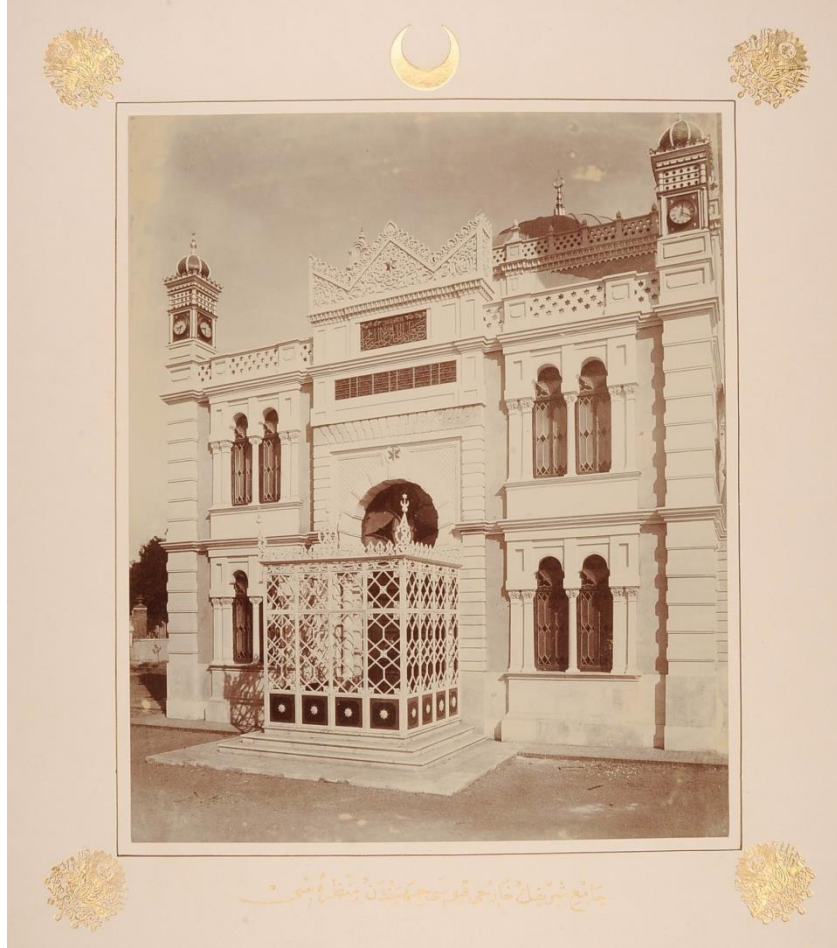
Resim 4: Selanik Hamidiye Cami'nin giriş cephesi (O.A., YEE.d., Gömlek no: 410).

öğelerine ilişkin bilgi sahibi olmak “oryantalist” uygulamaların doğuda ve batıda aynı söylem ve düşünce ile üretildiği anlamına gelmemektedir.