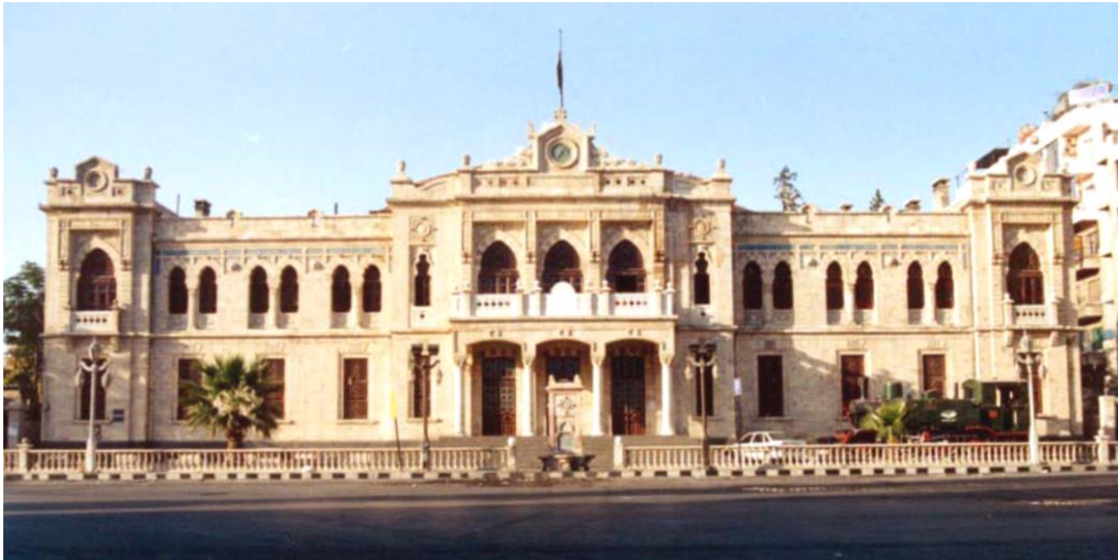
Resim 5: Şam'daki Hicaz Demiryolu İstasyon Binası ( http://nabataea.net/hejaz1.html ).

II. Abdülhamid'in İslam dünyasındaki prestiji oldukça yüksekti ve İslam ülkelerine ait mimari öğeleri başkent dışında imparatorluğun çok çeşitli bölgelerinde kullanması, siyasi amaç olan İslam birliğinin sürekliliğinin görsel ifadesi için önemliydi. Özellikle Avrupa emperyalizminin sömürge idaresinden bunalan yüz milyonlarca müslümanın Yıldız'a binlerce bağlılık telgrafı göndererek yönlerini İstanbul ve padişaha döndürdükleri belirlenmiştir. Sultanın iç politikadaki başarısı, imparatorlukta müslüman kavimleri devlete ve tahta çok iyi bağlamasından kaynaklanmıştır. Halife sıfatını en belirgin şekilde vurgulayan padişah, II. Abdülhamid'tir. Bu vurgulama, İslam aleminde kabul görmüştür. Hicaz Demiryolu aracılığıyla Osmanlı topraklarındaki eyaletler arası ilişkinin artması, panislamist görüşün hızlı yayılması ve herhangi bir düşman harekâtı ya da ayaklanma esnasında asker-cephane sevkياتının hız kazanması dikkat çekicidir (Karal, 1988: 469). Resmi olarak hacıların seyahatini kolaylaştırmak amacıyla yapıldığı ilan edilmişse de Hicaz hattının inşası bir çıkış olarak yorumlanabilir. Bununla birlikte Şam Hicaz Demiryolu İstasyon binasının (Resim 5) “oryantalist” üslubu oksidental mimari bir tepki olarak değerlendirilebilir.