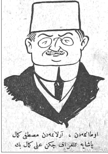
Resim 4: Güleriyüz, 5 Mayıs 1337, s.7.