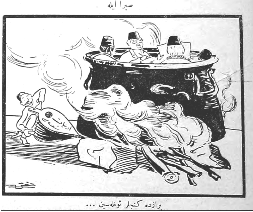
Resim 9: Sıra İle: Biraz da gençler üflesin... Aydede , 10 Nisan 1338, s. 3.

şubesi yazan bir körüğü kullanan bir genç, kazanın altındaki ateşi harlamaktadır. Karikatürün altında şu ifadeye yer verilmektedir: “Biraz da gençler üflesin...” 61 . (Bkz: Resim 9). Bu boykot günlerinde Ali Kemal’e mizah sütunlarında sık sık yer verildiği görülür. Ali Kemal’e öğrenciler tarafından yumurta atılmasına Ayine sütunlarında yer verir (Bkz: Resim 10). Güleryüz , “Yumurta Banyosu” başlığı altında Ali Kemal’i mizah konusu yaparken 62 (Bkz: Ek-2); Karagöz de Ali Kemal’in düştüğü bu gülünç duruma sessiz kalmaz. (Bkz: Ek-3). Darülfünun boykotunda Türk gençliği büyük bir başarı elde etmiş ve aralarında Ali Kemal’in de olduğu beş kişiyi üniversiteden attırmışlardı. Bu başarıya sütunlarında yer veren Güleryüz , gençleri elinde süpürge ile bu beş kişiyi süpürür halde çizmiş ve karikatürün altında şu ifadelere yer vermiştir: “ Darülfünun Talebesi: Artık bu mikropları içimizden attıktan sonra, temiz nefes almamız imkanı hasıl olacak ” 63 (Bkz: Ek-4).