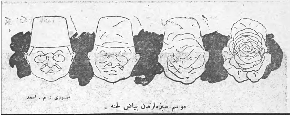
Resim 7: Mevsim sebzelerinden beyaz lahana. Diken , 4 Kanunuevvel 1335

Milli Mücadeleye destek veren yayın organlarını lahana yaprakları, karpuz kabukları şeklinde yeren, eleştiren Ali Kemal 48 , bu sözlerinden sonra dönemin mizah sütunlarında yer alan karikatürlerde lahana ve karpuzla ilişkilendirilir. Bizzat Ali Kemal kendi sözleri üzerinden mizah konusu yapılacaktır. Örneğin bunlardan birinde Ali Kemal’in kafası lahana ile özleştirilerek çizilmiştir (Bkz: Resim 7).