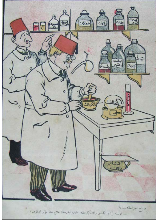
Resim 6: Güleryüz, 30 Haziran 1337, s. 5.

içinde Refik Halit, Ali Kemal'e şöyle seslenir: “Usta şu ikinci raftakilerden de ilave edersek ilaç daha müessir olmaz mı?” 44 (Bkz: Resim 6).