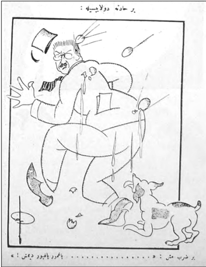
Resim 10: Bir Hadise Dolayısıyla Bir darpmış: “..... Yağmur yağıyor demiş” Ayine , 24 Mayıs 1338, s. 2.

Refik Halit, Milli Mücadelenin sonlarına doğru İstanbul sokaklarının “ Kahrolsun Ali Kemal ” tehditleriyle inlediği günlerde Ali Kemal’in sükûnetini bozmayarak, normal hayatına devam ettiği ifade eder 64 . Öte yandan Refik Halit, o günlerin mizah sütunlarında Ali Kemal’le sık sık aynı karede resmedilir. Ayrıca Refik Halit, Ali Kemal’i Mustafa Kemal Paşa’nın heykeli önünde diz çöken bir vaziyette tasvir eden bir karikatüre kendi dergisinde yer verir. Karikatürün başlığı şöyledir: “ Zafer temin edilince (Peyam) sahibinin alacağı tavır... ”. Karikatürün altında Nedim’e ait olan gazelin ilk cümlesine yer verilir: “ Mesti Nazım Kim Büyüttü Böyle Bi-Perva Seni ” 65 (Bkz: Resim 11).