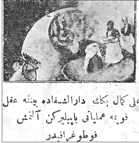
Resim 1: Ali Kemal Beyin Darüşşifa da beynine akıl koyma ameliyatı yapılırken alınmış