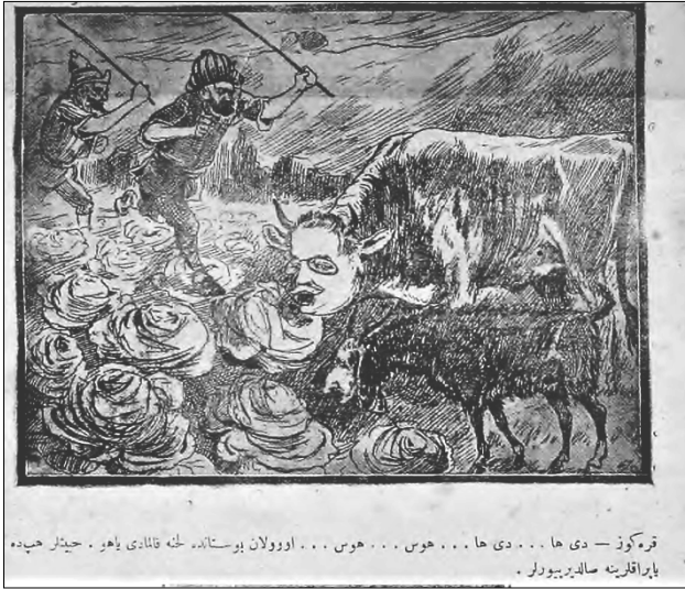
Resim 8: Karagöz: Dey ha... Dey ha... Hoş... Hoş... Bostanda lahana kalmadı yahu. Habisler hep te yapraklarına saldırmışlar. Karagöz , 5 Mart 1337

Milli Mücadele'nin en hayati günlerinde, ülkenin dört bir yandan işgal altında olduğu bir zamanda, halkın elinde avucunda kalan son varlığıyla Türk ordusunun Sakarya nehri önlerinde Yunan ordusuna karşı ölüm kalım savaşı yaptığı o günlerde, Ali Kemal'in olan bitene karşı vurdumduymaz tavrı da O'na karşı gelişen öfkenin bir diğer nedenidir. Örneğin, Ali Kemal'in bayramı Büyükkada'da yüzerek ve gezerek geçirdiğini anlattığı bir alıntıya yer veren Ayine, O'nun ülkenin içinde bulunduğu ıstıraplı hali umursamaz tavrına ağır bir eleştiri getiriyordu. Ayine, sütunlarından O'nu küçümseyen bir tonda şu ifadelerle yer veriyordu: “Görüyor musunuz zavallı Ali Kemal Bey, bayramını ne hazin bir masumiyetle geçirmiş?.. Melül melül yüzmüş, kalbinin vatan derdiyle talan olduğu nasıl belli, biz olsak çabalar, gürültü eder, suları karıştırırdık. Ali Kemal Bey ise melül melül, denizin ruhunu rencide etmeden, vatani düşüne düşüne adeta malaklar gibi yüzmüş” 54 .