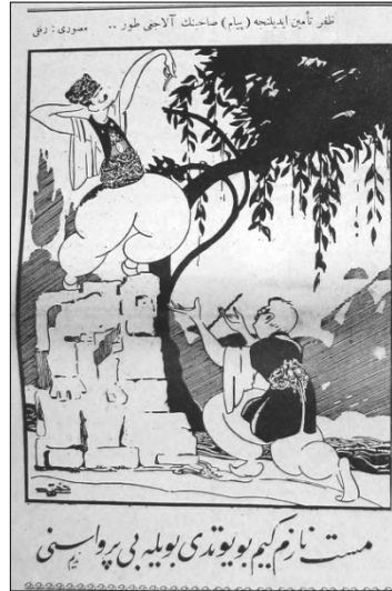
Resim 11: Aydede, 31 Ağustos 1338, s. 1.