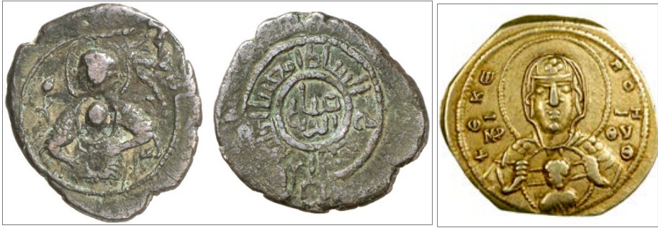
Şekil 1. Solda: Ziyâüddîn’in bakır sikkesi, basım yeri yok, tarihsiz, 6,59 g; 6 VII. Mikhail Dukas’ın bastırıldığı tetareronun ön yüzü (The Barber Institute Coin Collection, B5465; P. D. Whitting Collection).

Özetle bu makalede yukarıda zikrettiğimiz çalışmalardan farklı olarak oldukça nadir ve daha önce yayımlanmayan veya yeterli incelemeye tabi tutulmayan altı farklı tipte sikkeyi tartışmaya açacağız. Aşağıda görüleceği üzere British Museum ve American Numismatic Society gibi dünyada çok iyi tanınan kuruluşların koleksiyonlarının yanında, çeşitli saygın özel koleksiyon ve müzayedelerde karşımıza çıkan bu sikkelerin büyük bölümü çok nadirdir. Büyük oranda yıpranmış durumda olmaları, sikkeleri kimliklendirmeyi güçleştirmektedir. Ancak sikkelerdeki yazıların okunabilir kısımları üzerinden, gerek yazı tipleri ve gerekse figürler vasıtasıyla çıkarımlar yapmayı deneyecek, değerlendirmeler yapacağız.