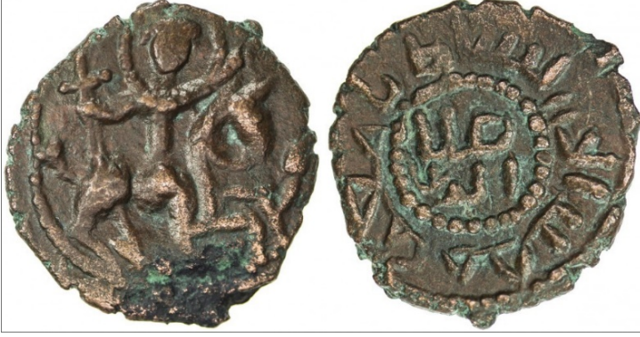
Şekil 2. Ziyâüddîn'in bakır sikkesi, basım yeri yok, tarihsiz, 4,17 g, https://www.acsearch.info/search.html?id=3263014 (Siteye giriř: 10. 01. 2019).

oldukları Irak Selçuklu sultanı Mahmud bin Muhammed Tapar'ın unvan ve adına yer verir.