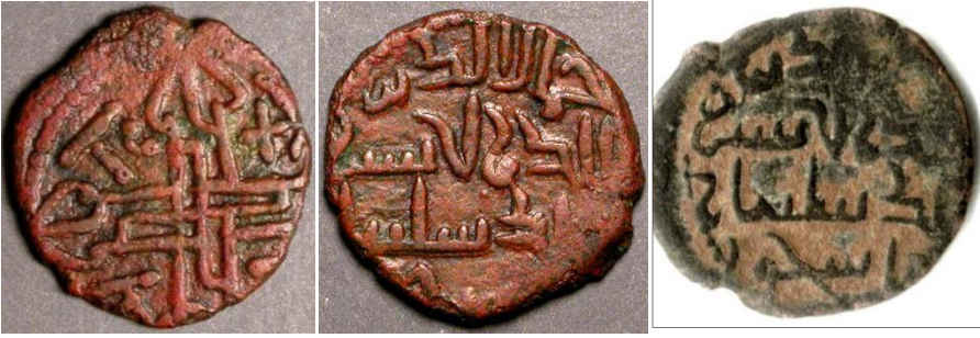
Şekil 6. Süleyman bin İshâk'ın bakır sikkesi, basım yeri yok, tarihsiz, 1,92 g, http://www.zeno.ru/showphoto.php?photo=23199 (Siteye giriş: 10.01.2019).

Kıymetli taşlarla süslü haç sembolünün dört köşesine nakşedilmiş IC-XC-NI-KA ifadesi IV. Mikhail (1034-1041) devrinde bastırılan Bizans anonim bakır sikkeleri C sınıfındaki örneklere benzemektedir. Yine muhtemelen 11. yüzyılın son çeyreğinde Trabzon'da basılan bakır sikkeleri andırmaktadır. 31 Her iki örneğin de arka yüzlerinde, mücevherlerle işlenmiş uç kısımlarında küreler bulunan kısa bir haç sembolü ve Süleyman'ın sikke tipinde olduğu gibi, her kenarında birbirini tamamlayan yukarıdaki ifade yer almaktadır. Buna karşın, Mengüceklî zanaatkâr Bizans haçını değiştirmiş; tamamen orijinal bir model ortaya çıkarmıştır. Ancak sürpriz bir biçimde IC-XC-NI-KA ibaresine dokunmamıştır.