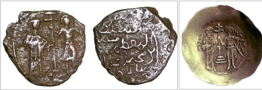
Şekil 3 Solda: İzzüddîn II. Saltuk'un bakır sikkesi, basım yeri yok, tarihsiz, 5,03 g., The Barber Institute Coin Collection, TK486; P. D. Whitting Collection; Sağda: II. Ioannes Komnenos'un Bastırdığı elektron aspron trakhynin arka yüzü, the Barber Institute Coin Collection, B5629; P. D. Whitting Collection.

السلطان المعظم مسعود بن محمد عز الدين سلق بن علي es-Sultân / el-Mu'azzam / Mes[‘ûd] / bin Muhammed ‘İzzü'd-[Dîn] / Salduk [bin / ‘Âli] (Bkz. Şekil 3)