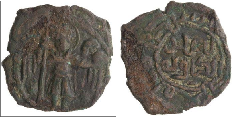
Şekil 7 Nâsîrüddîn Muhammed (?), bakır fels, 6, 3 g, American Numismatic Society Coin Collection, no. 1976.154.1; http://numismatics.org/collection/1976.154.1?lang=tr (Siteye giriş: 10.01.2019).

yaklaşımından hareketle, şunu rahatlıkla teklif edebiliriz ki Türkmen sikkeleri ya da objeleri üzerindeki bu haç sembolleri, politik ve ideolojik bir niyetle kullanılmış olmakla birlikte, dinî bir anlam ifade etmemektedir.