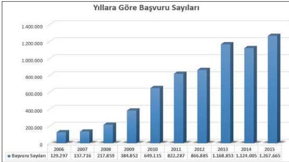
Tablo 1. BİMER Kapsamında Alınan Başvurularla İlgili İşlem Sayıları