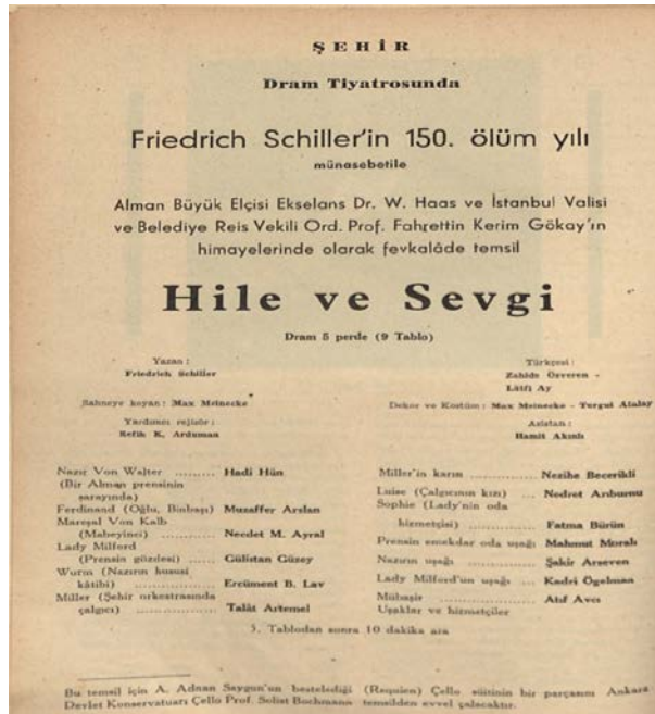
Şekil 2. Tiyatro Dergisi, Mart-Nisan 1955 Sayısı s. 10