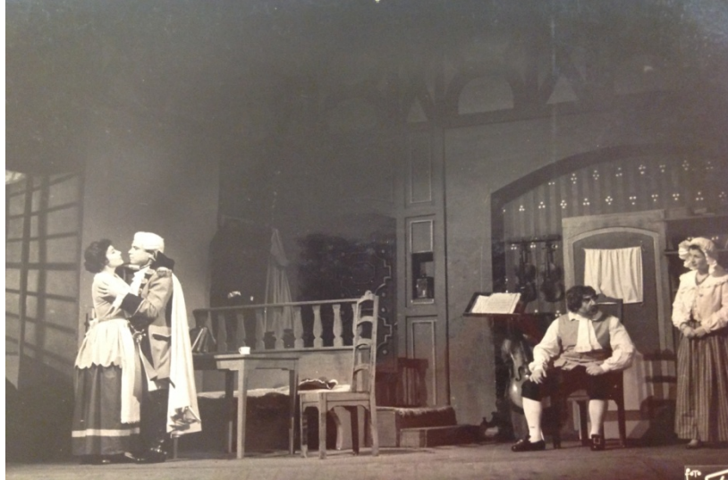
Şekil 3. 'Hile ve Sevgi' Oyunundan 1955 tarihli Bir Fotoğraf.

Oyun ve müziğine, bu prömiyerin ardından kritikler, öncelikle oyunun '5 perde – 9 tablo' ve toplamda üç buçuk saat uzunlukta olması sebebiyle, 1784 yılında yazılmış eserin, dönem dramtizasyonu içerisinde kaybolup kendine çekemediği eleştirisini getirmiştir (Ulunay,1955). Müziğin başlığı ise kimi yerde halen, Tiyatro Dergisi'ndeki künyede görünen ismi, '(Requiem) Çello Suiiti' olarak telaffuz edilmektedir (age). Bu noktada, oyundan oldukça evvel yapılmış olan tanıtım ve basılmış broşürlerde adı bu şekilde geçtiği için, sonradan bir düzeltmeye girilememesi sebep gösterilebilir.