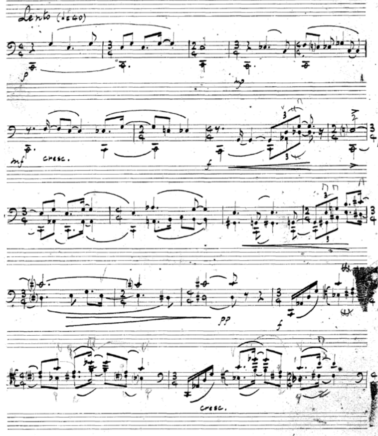
Şekil 4. Saygun'un El Yazısı ile Partita'nın Birinci Sayfası.

"refakatsiz" melodiler... Saygun yer yer de kendini tekrarlıyor: Op. 29 senfonisinin üçüncü muvmanında yerli malzemeyi minuetto ile birleştirmesi gibi burada da siciliano çerçevesi içine sokması; son muvmanda, senfoninin ilk kısmından sıçramış bir tem... Bütün bunlar - ve birçok şeyler -sağlam ve irtibatlı bir yapı içinde, bestekârın ilerdeki solo viylonsel eserlerinde herhalde birleşecek. (age)